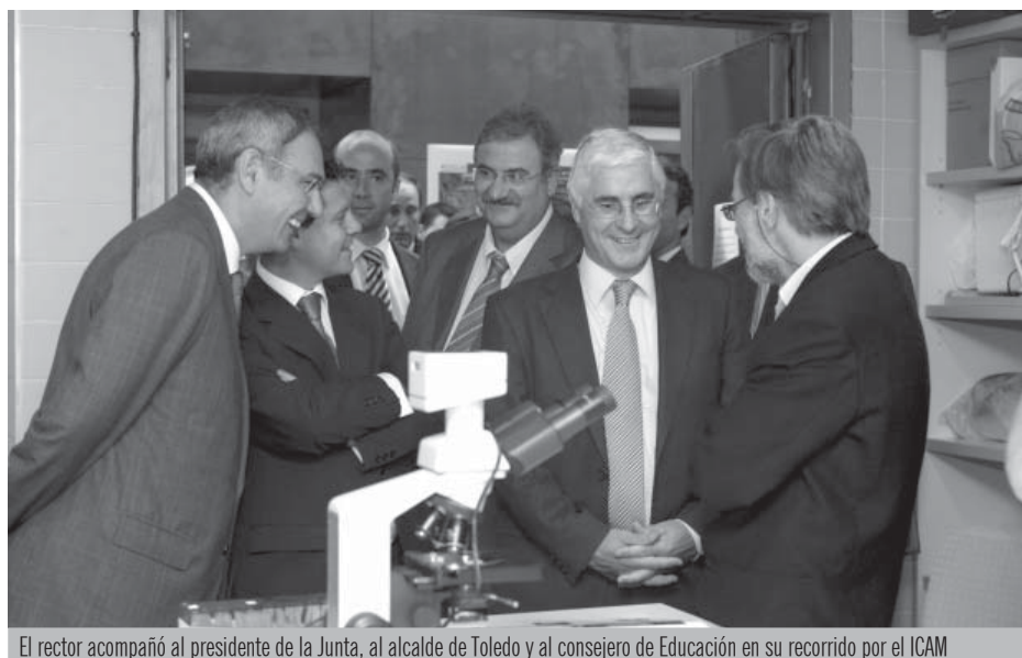
El rector acompañó al presidente de la Junta, al alcalde de Toledo y al consejero de Educación en su recorrido por el ICAM