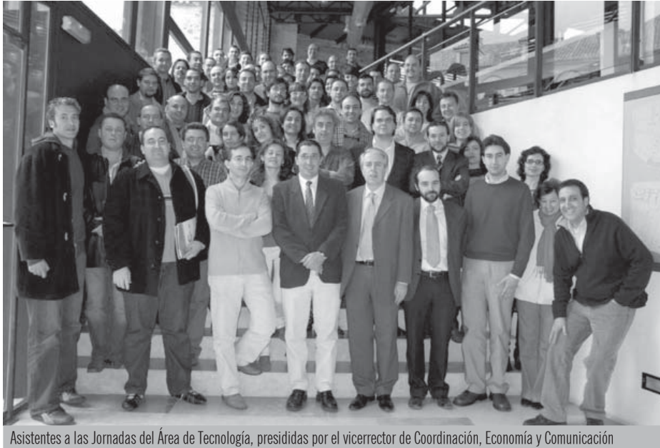
Asistentes a las Jornadas del Área de Tecnología, presididas por el vicerrector de Coordinación, Economía y Comunicación

El Área de Tecnología y Comunicaciones desarrolla una ingente actividad en el ámbito de las nuevas tecnologías al servicio del Personal Docente e Investigador, el Personal de Administración y Servicios y los alumnos