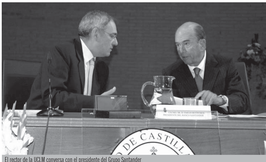
El rector de la UCLM conversa con el presidente del Grupo Santander

En el convenio se destinan fondos para acciones de cooperación del desarrollo, continuando una experiencia ini-