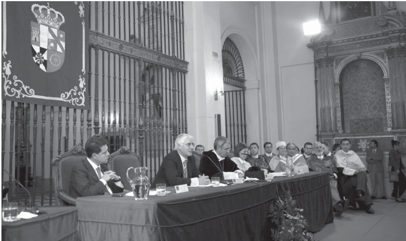
Mesa presidencial de la ceremonia de inauguración del curso 2007/2008, celebrada en la iglesia de San Pedro Mártir