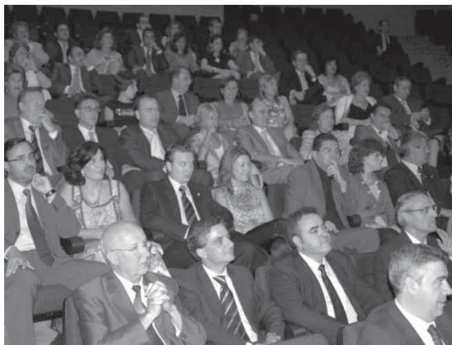
Numerosas personalidades participaron en la recepción del Consejo Social en Albacete