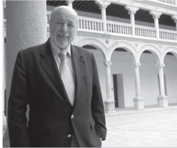
Juan Guzmán, el juez que procesó a Pinochet en Chile, recibió la medalla de la SIDS