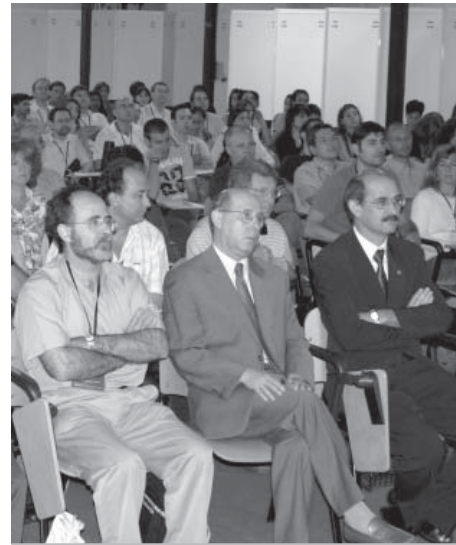
Vista de algunos de los asistentes a la Bienal