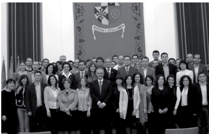
En el Campus de Ciudad Real tomaron posesión de sus plazas un total de 58 profesores