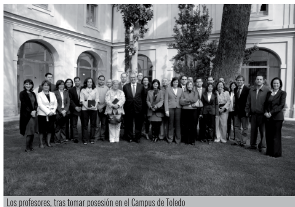
Los profesores, tras tomar posesión en el Campus de Toledo