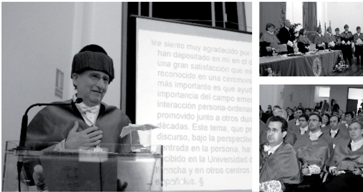
Siguiendo las agujas del reloj, Ben Shneiderman agradece la concesión del "honoris causa"; el profesor y sus padrinos, junto a la mesa presidencial, y, por último, un grupo de doctores en el acto

Ben Shneiderman colabora muy activamente con las escuelas de Informática de Albacete y Ciudad Real