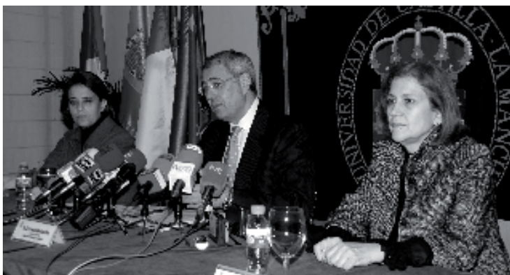
El rector, en su comparecencia en Toledo, entre las vicerectoras de este campus y de Estudiantes