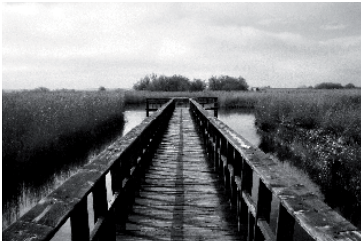
Las lluvias y otros aportes hídricos han devuelto la vida a Las Tablas de Daimiel, uno de los principales humedales