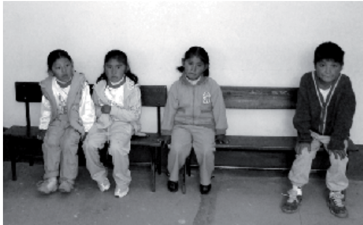
Un grupo de niños espera a ser atendido en la clínica Sr. de la Exaltación, en el barrio de Vino Tinto, La Paz

La ayuda de la UCLM ha servido para comprar un analizador de electrolitos en sangre