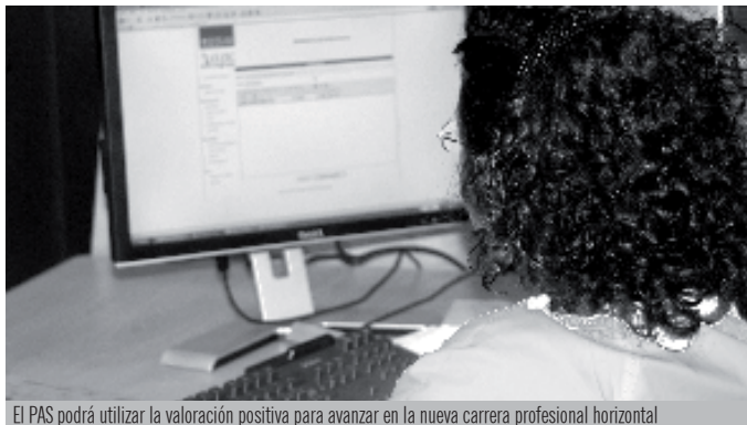
El PAS podrá utilizar la valoración positiva para avanzar en la nueva carrera profesional horizontal

Para finalizar, cabe destacarse el compromiso recogido en la RPT, vinculado a la evolución del contexto económico, para que el presupuesto destinado a este concepto se incremente en un 10% cada dos años. De esta forma, se pretende afianzar a medio plazo la apuesta por la calidad en la gestión y el reconocimiento a los trabajadores que realizó la institución hace años y cuyos resultados están siendo reconocidos y premiados por la sociedad.