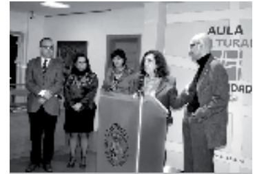
Familiares, amigos y compañeros de Feu, en el homenaje