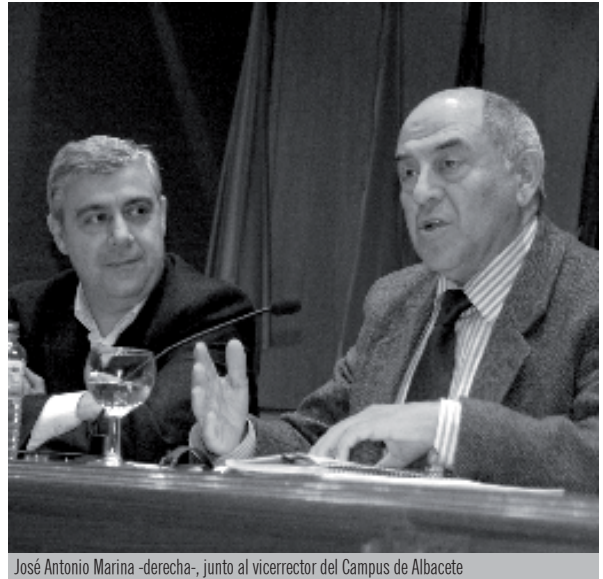
José Antonio Marina -derecha-, junto al vicerrector del Campus de Albacete