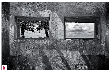
b. Primer premio en Fotografía y Nuevas Tecnologías: Habitación con vistas , de José Ramón Moreno Fernández