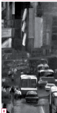
a. Primer premio en Pintura y Escultura: Street , de Alberto Orihuela Lemus.