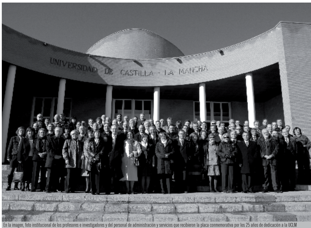
En la imagen, foto institucional de los profesores e investigadores y del personal de administración y servicios que recibieron la placa conmemorativa por los 25 años de dedicación a la UCLM

Personal Docente e Investigador y de Administración y Servicios y estudiantes celebran Santo Tomás en Albacete