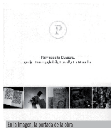
En la imagen, la portada de la obra

El libro ofrece fotos y comentarios de las obras más significativas