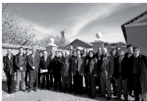
Los participantes presentaron el proyecto en la empresa Dehesa de los Llanos de Albacete