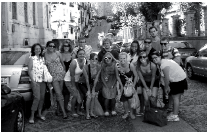
Históricamente, la mayoría de los alumnos del programa ESTO proceden de universidades norteamericanas

Este compromiso con la herencia cultural no constituye un obstáculo para que ESTO apueste por las nuevas