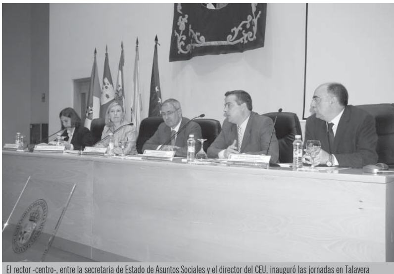
El rector -centro-, entre la secretaria de Estado de Asuntos Sociales y el director del CEU, inauguró las jornadas en Talavera

El rector presentó la Guía del Voluntariado en Talavera y Cuenca