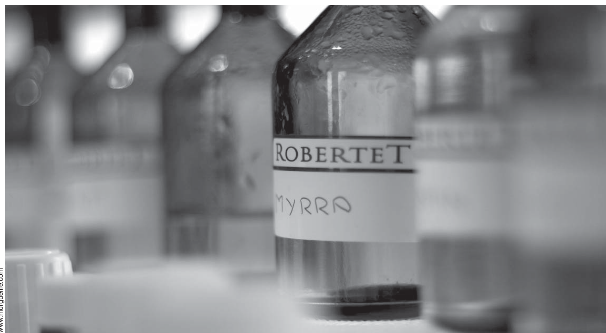
continúa en la página siguiente