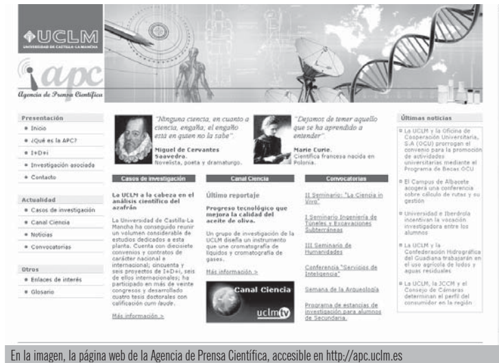
En la imagen, la página web de la Agencia de Prensa Científica, accesible en http://apc.uclm.es