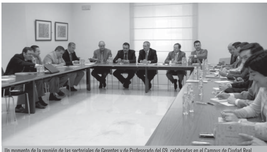
Un momento de la reunión de las sectoriales de Gerentes y de Profesorado del G9, celebradas en el Campus de Ciudad Real