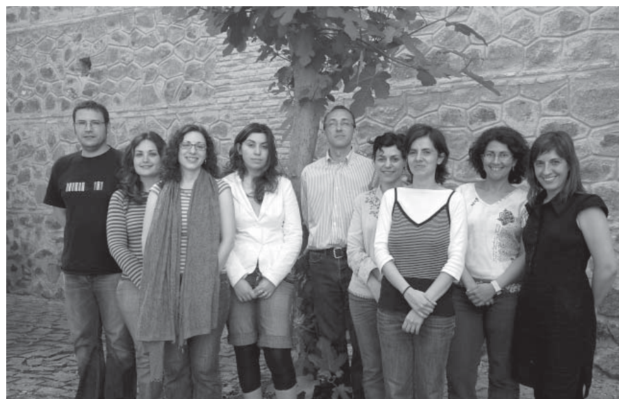
En la imagen, el equipo humano que trabaja en la Escuela de Traductores de Toledo

estrecharlas y hacérselas invisibles a los demás; es alguien que trabaja para la comunidad -la de aquí y la de allí-, pues él no necesita -para su disfrute- trasvasar el contenido de una vasija a otra vasija; no necesita -para su percepción intelectual- pintar el cuadro con otros colores, con otros signos, en otra lengua”.