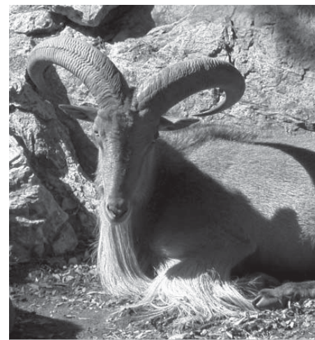
En la imagen, un arruí africano

de fincas de caza privadas. También hay un grupo en la isla canaria de La Palma. "Ya conocíamos la capacidad expansiva del arruí. Ahora urge llevar a cabo seguimientos para prevenir posibles efectos negativos sobre la fauna y flora ibéricas", apunta Cassinello. Y concreta que "el actual trabajo es un grave toque de atención sobre los posibles efectos negativos para la emblemática cabra montés, que se está recuperando ahora de pasa-