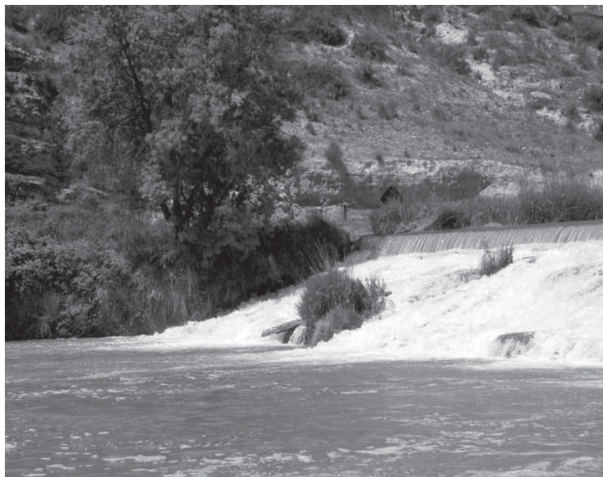
El río Júcar a su paso por la provincia de Albacete

La investigación se inició el pasado mes de junio y tendrá una duración aproximada de seis meses que podrá ser prorrogable de mutuo acuerdo entre las partes. El seguimiento de los trabajos se realizará desde el área de Desarrollo del Ayuntamiento y también por parte del técnico correspondiente de la Sociedad Cooperativa.