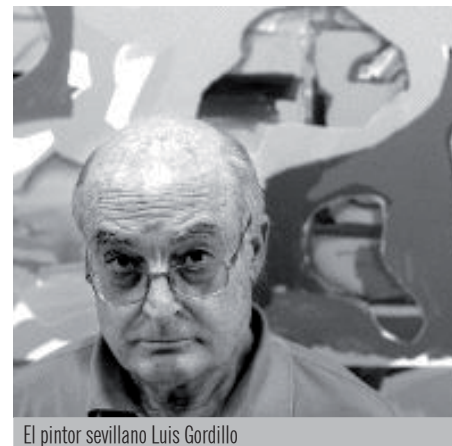
El pintor sevillano Luis Gordillo

En otro orden de cosas, el máximo órgano de representación universitaria