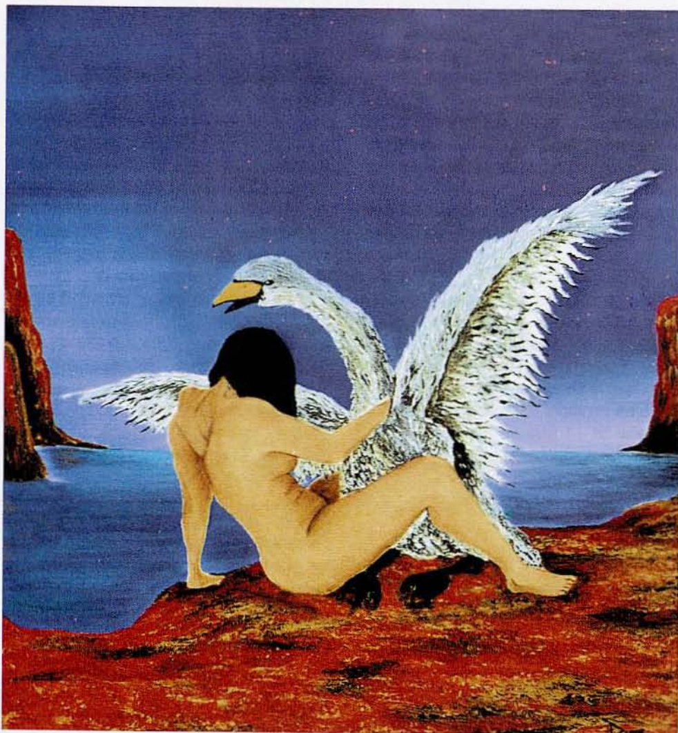
Leda y el cisne (Las multiplicaciones del deseo, 1999) Óleo sobre tela (45 x 50 cm.)