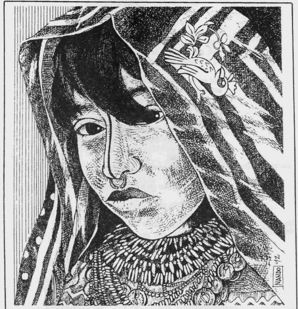
Princesa de la tribu indígena Punas, de la Isla San Blas, Panamá