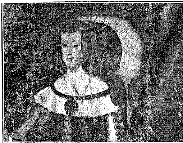
VELAZQUEZ.—Busto de un retrato de Doña María de Austria

Los tonos grises, plateados, dorados—recórdemos «La Fragua de Vulcano»—es de lo más real que ha producido la pintura. «Las sombras no están sino apenas restregadas, y las partes luminosas hechas a todo color; y el conjunto, con sus tonalidades amplias y justamente ejecutadas; es de valor tan exacto, que la ilusión es completa.»