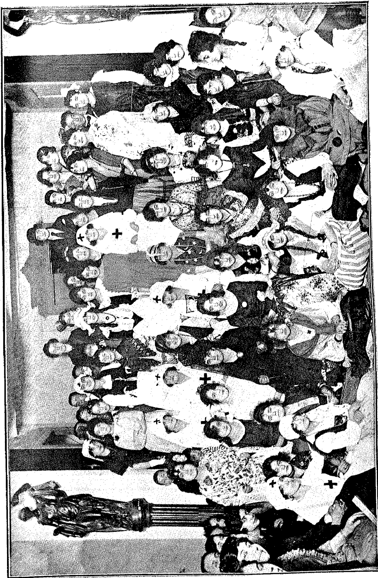
Lindas señortas que han dado esplendor con su presencia a los tradicionales bailes de máscaras que anualmente se celebran en el Centro Regional MANCHEGO, luciendo vistosos y ricos disfraces.