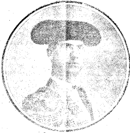
MANUEL RODRIGUEZ (Manolete)

¡Qué bello era!... Sus padres contemplaban desde lejos los ágiles movimientos de los peque-