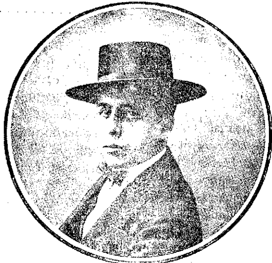
FRANCISCO POSADA Este simpático matador que es uno de los primeros en el arte y que lo conocemos, alternará el día 25 del corriente en la plaza de Almagro con Gaona y Ballesteros.

Posada lancea con lucimiento, oyendo una ovación.