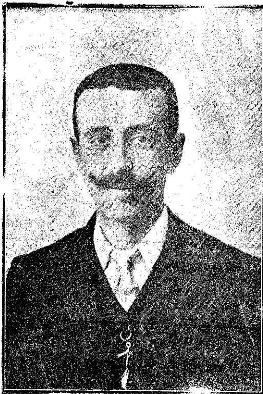
DON CARLOS DE MENDICUTI ALCALDE DE ALMAGRO Prestigioso joven, hijo del general del mismo apellido, que en el poco tiempo que lleva desempeñando dicho cargo, ha sabido captarse las simpatías de todo el vecindario, prueba inequívoca del celo y cariño que siente por sus convecinos.