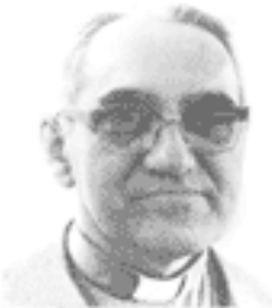
Monsenor Romero —