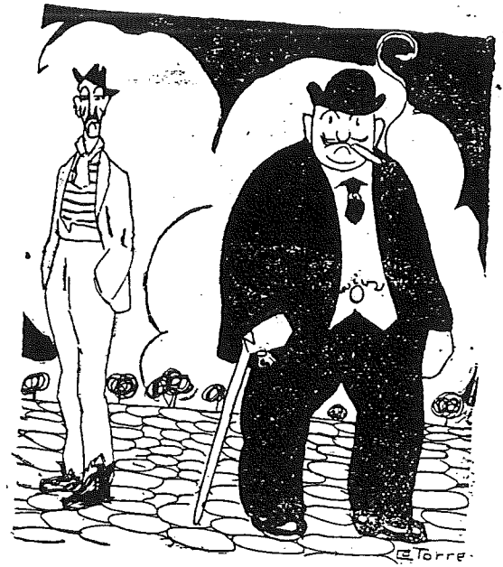
Antes de ser concejal.