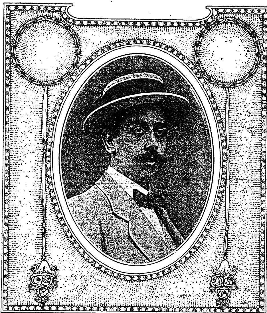
Fundador de PERO GRULLO el 13 de Noviembre