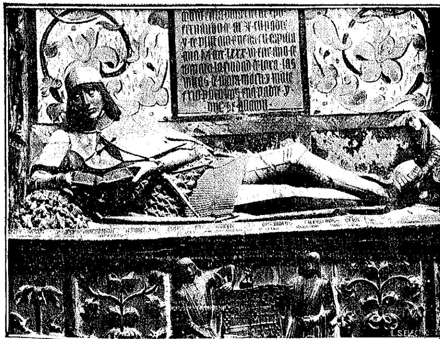
«El doncel del libro», maravillosa obra de arte que existe en la Catedral de Sigüenza.

sucesivamente, a los ricos pueblos castellanos. Comenzamos esta tarea, con Sigüenza, uno de los más importantes pueblos de Guadalajara.