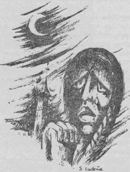
Las brujas de Salem

de lo que una mujer medianamente instruida, culta, cerebral o simplemente zarandeada, pero observadora, puede «ver» y escribir.