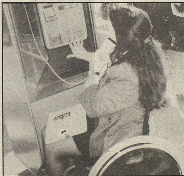
"Las barreras que sufren los minusválidos no son sólo físicas"

Hay más tipos de minusválidos a parte de los físicos, también hay, psíquicos y sensoriales, y éstos también tienen barreras de entendimiento, comunicación y urbanas. Estos colectivos están relacionados con el entorno que nos rodea a todos... pero tendríamos que pararnos y mirarlos (... y para esto hace falta sen-