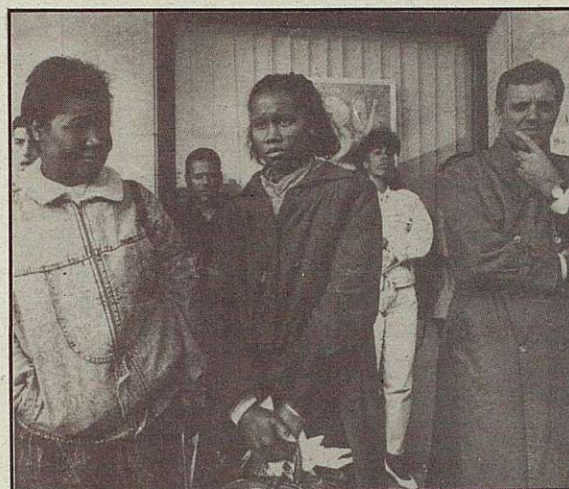
Mi padre era pobre y heredé su miseria.

Es evidente que no sólo se pretende actuar ante la Unión Europea, sino que lo que se quiere es llegar desde los problemas locales, regionales o de todo el Estado hasta lo supranacional y al mismo tiempo de-