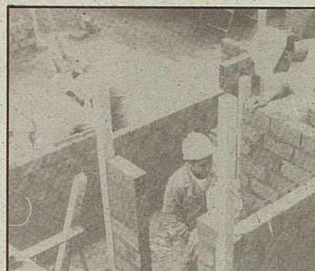
"El Consumo de drogas aumenta el riesgo de accidentes laborales"

"cursos de mediadores sociolaborales en intervención de drogodependencias" impartidos en toda la región, nos planteamos la necesidad de continuar trabajando en el tema de drogodependencias, para mejorar