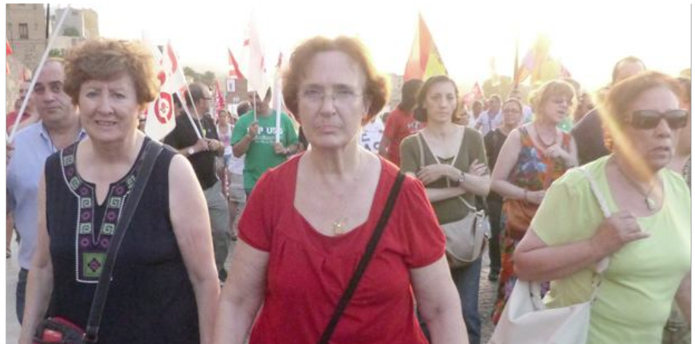
Manifestación del pasado 19 de junio en Toledo

Asimismo, pidió al Gobierno regional que deje la "mala práctica" de recurrir a la herencia recibida por el anterior