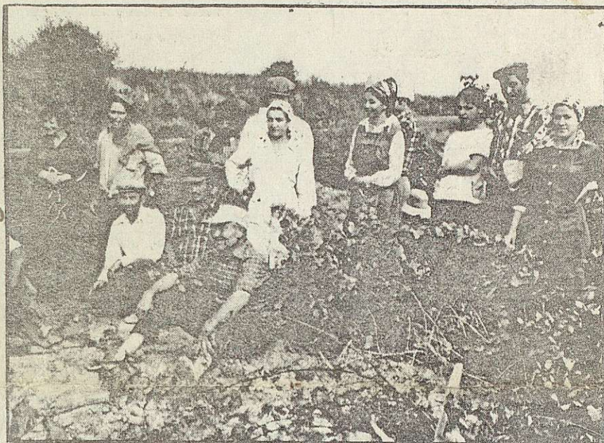
LOS JORNALEROS DE TOLEDO ESTAN PASANDO HAMBRE