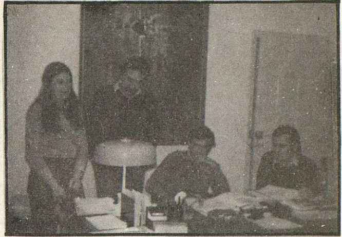
Colectivo de abogado y técnicos de la Asesoría Jurídica al servicio de CC.OO. de Toledo.

Paramayor claridad vamos a transcribir el modelo oficial y sobre él haremos cuantas aclaraciones sean necesarias.