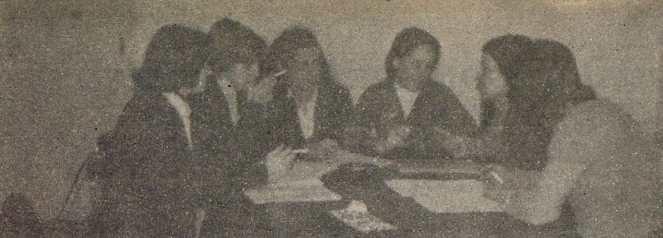
Un momento de la entrevista entre nuestro redactor y las feministas.