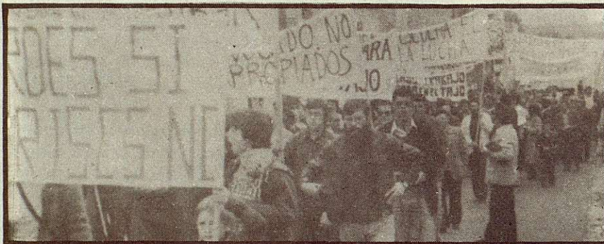
Barrio de Covachuelas