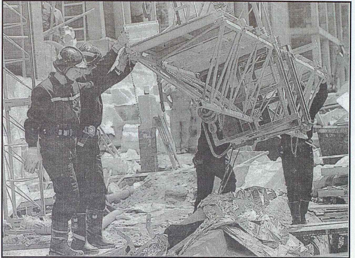
Un obrero yace muerto en un tajo tras caer desde lo alto de un edificio.

La falta de aplicación de las normas por parte de los empresarios, las malas prácticas preventivas de las Mutuas de Accidentes de Trabajo y la dejadez de la Administración para atajar de una vez por todas esta situación unidas a la precariedad