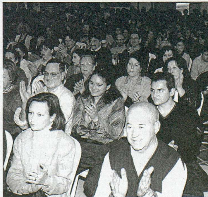
El lagar de San Prudencio se llenó de público en la inauguración de la exposición en Talavera.

La exposición, después de Talavera, se instaló en Villa de D. Fadrique en donde además del acto de inauguración se proyectó la película "siete días de enero" referida a los asesinatos, hace 25 años, de los abogados laboristas de CC.OO. en Atocha.