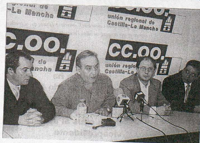
Trabajadores de la Escuela de Hostelería negocian, con el apoyo de CC.OO. una salida al conflicto