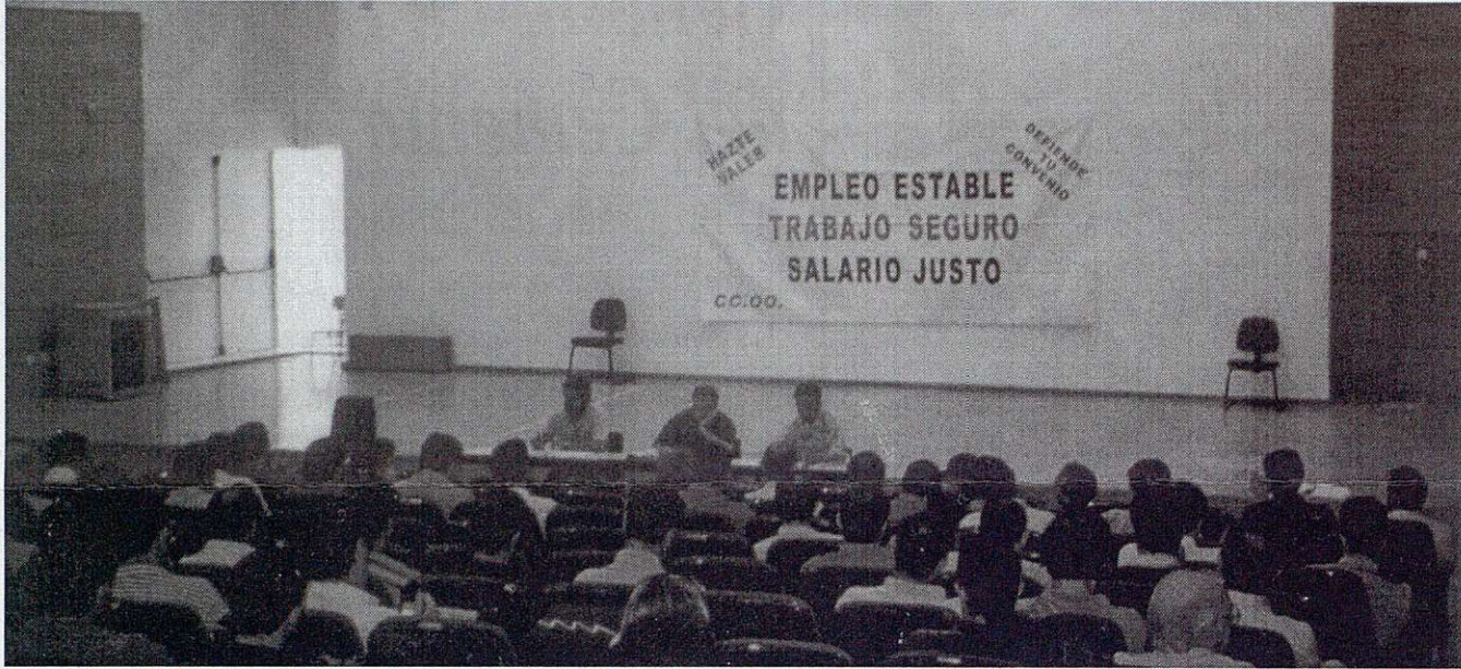
Reunión del Consejo Provincial de CC.OO.