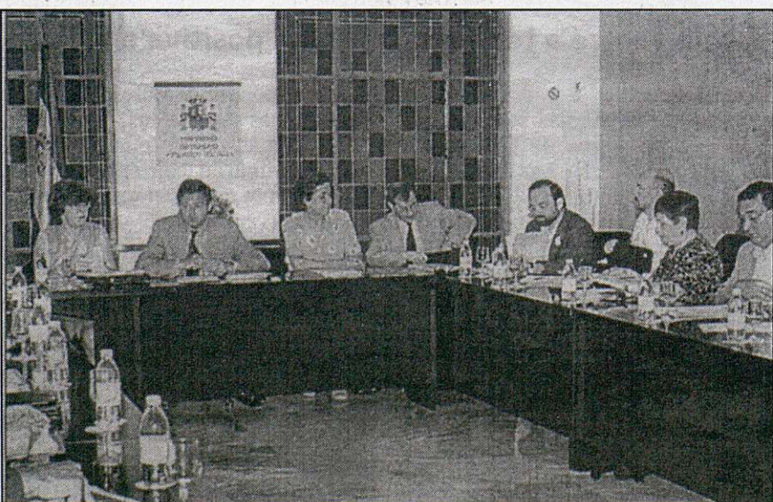
Representantes del Gobierno, CEOE y Sindicatos, el pasado lunes 2 de julio.

El calendario de reuniones que se han fijado las partes incluye reuniones de trabajo durante la semana y una reunión para analizar resultados cada Lunes.