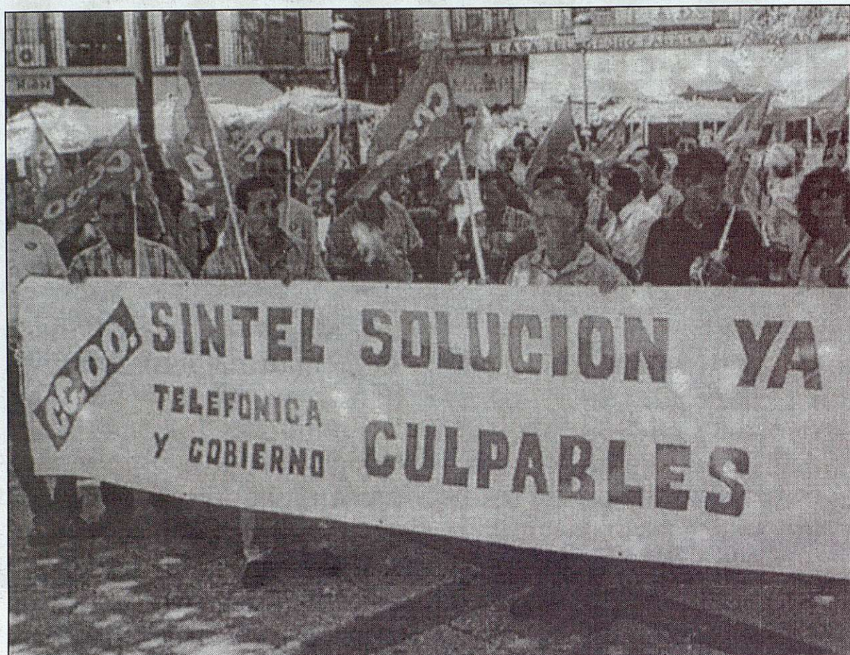
Concentración de Delegados/as en Zocodover, en solidaridad con los trabajadores de SINTEL