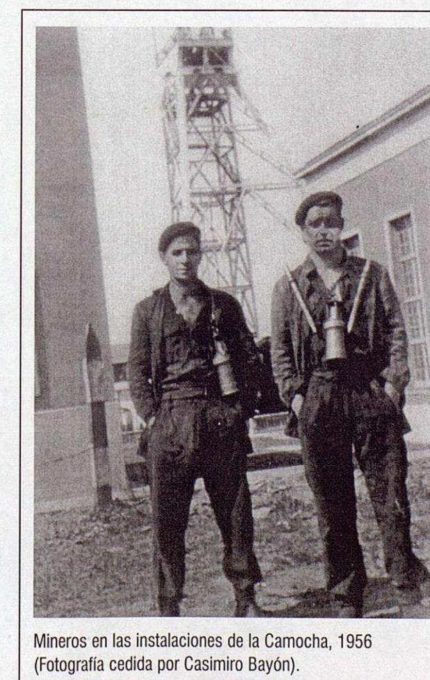
Mineros en las instalaciones de la Camocha, 1956 (Fotografía cedida por Casimiro Bayón).