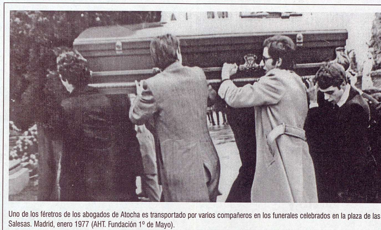
Uno de los féretros de los abogados de Atocha es transportado por varios compañeros en los funerales celebrados en la plaza de las Salesas. Madrid, enero 1977.

talleres, minas y tajos hasta la citada Asamblea General y la legalización del sindicato.