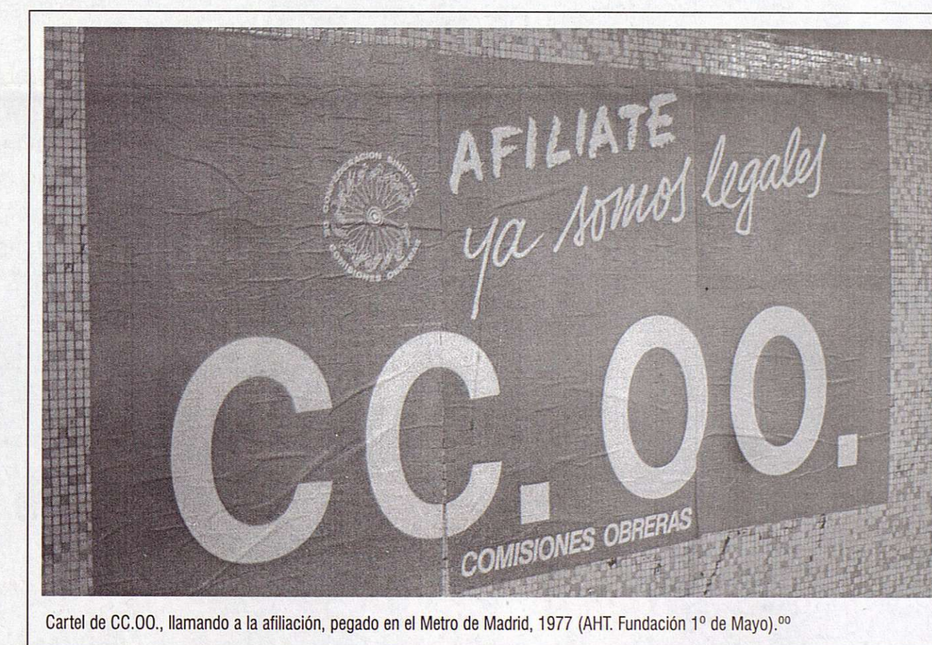
Cartel de CC.OO., llamando a la afiliación, pegado en el Metro de Madrid, 1977.

Granada, Ferrol, Madrid, San Adrián del Besós, Elda, Vitoria..., o el Proceso 1001 contra diez dirigentes de las Comisiones Obreras.