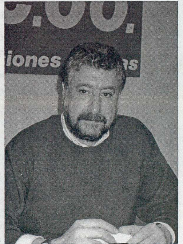
José M.ª Fidalgo Sº General de CC.OO.

Han pasado veinticinco años de la Asamblea de Barcelona, donde CC.OO. se constituyó como Sindicato... muchos años antes habían surgido las primeras Comisiones Obreras del metal vizcaino y de la minería asturiana.