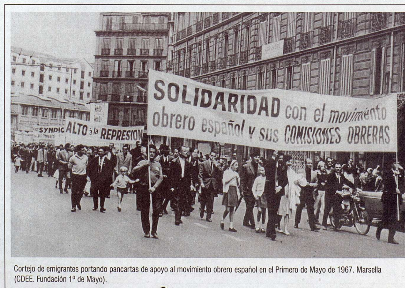
Cortejo de emigrantes portando pancartas de apoyo al movimiento obrero español en el Primero de Mayo de 1967. Marsella (CDEE. Fundación 1º de Mayo).

El tercer grupo da cuenta de las innovaciones que supusieron las Comisiones Obreras desde el punto de vista de la organización y la acción