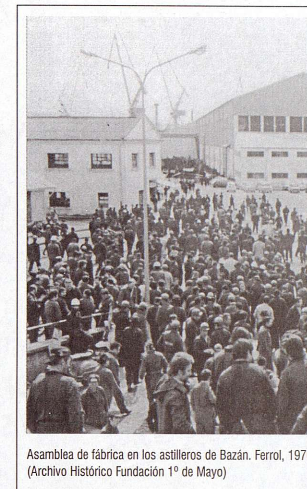
Asamblea de fábrica en los astilleros de Bazán. Ferrol, 1976

Los dos siguientes grupos de paneles reflejan dos tipos de episodios muy relacionados entre sí. Por un lado, se trata de las grandes movilizaciones del movimiento obrero. Por otro lado, se hace referencia a la represión que el franquismo desató contra Comisiones Obreras y la clase trabajadora, como respuesta a esas movilizaciones: detenciones, los crímenes de Erandio,