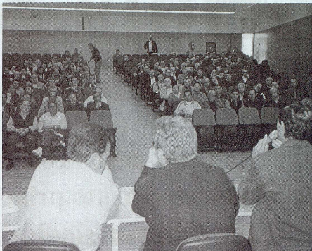
La asistencia a las asambleas ha sido numerosa.

Así mismo CC.OO. ha interpuesto recurso de súplica ante el Tribunal Supremo, contra la providencia de admisión a trámite del recurso de casación presentado por el Gobierno contra la Sentencia de la Audiencia Nacional que anula la congelación de los empleados públicos en 1997.