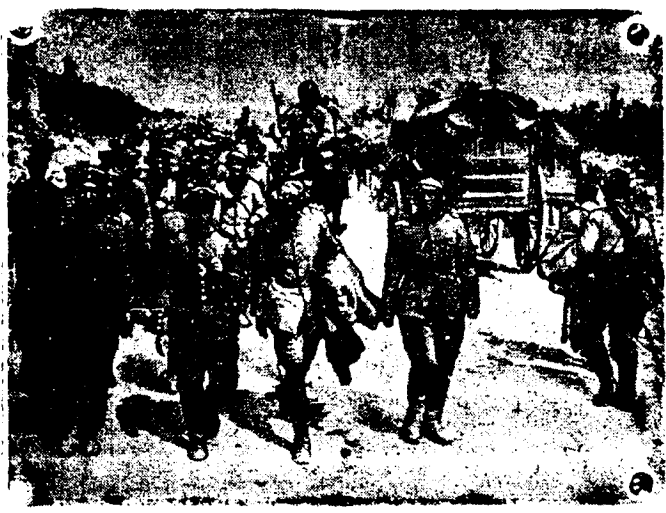
DE LA GUERRA.—Oficiales alemanes prisioneros.