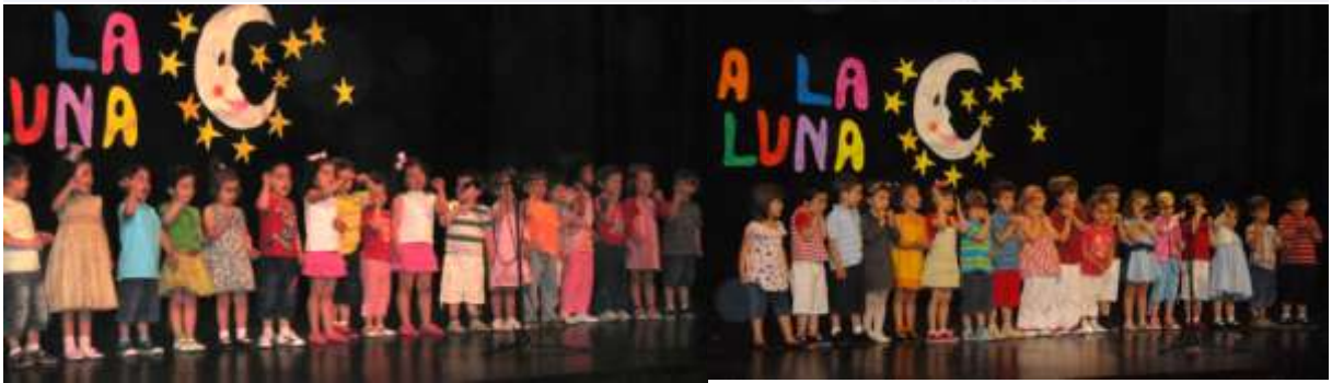
Los niños y niñas de 3A hemos recitado "Sol, Solecito" y 3B "Canción de cuna de los elefantes"

Este trimestre el tema del plan lector ha sido la astronomía. Como última actividad hemos realizado un recital dedicado al sol y la luna.