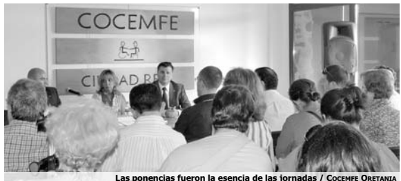
Las ponencias fueron la esencia de las jornadas

La clausura fue protagonizada por la miembros de la asociación Amipora, de Porzuna, que interpretaron el clásico de "El Quijote". Una actividad de la cuál se informa específicamente en la página 12 de este periódico.