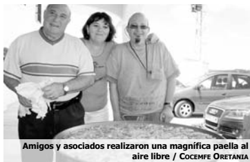
Amigos y asociados realizaron una magnífica paella al aire libre

Sin duda, una experiencia inolvidable para ellos. "Por eso pretendemos solicitarla también para el año próximo, para que así el máximo de personas pueda disfrutarla", concluye el presidente de la entidad.