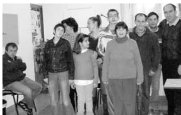
Ensayos de la obra 'El Árbol Mágico de Oramfya' / COCEMFE ORETANIA