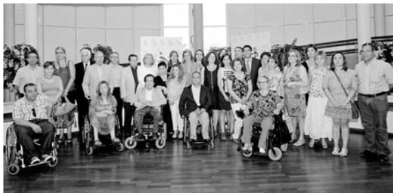
Foto de familia con usuarios, familiares y trabajadores

Un total de 20 personas a las que se les reiteró la necesidad de los entornos accesibles para todas las personas, no sólo para las personas con discapacidad.