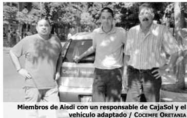
Miembros de Aisdi con un responsable de CajaSol y el vehículo adaptado

En definitiva, un acuerdo que beneficia recíprocamente a ambas entidades, ya que AISI, publica en el vehículo a Caja Sol y esta entidad, garantiza con su colaboración una mayor autonomía de las personas con discapacidad.