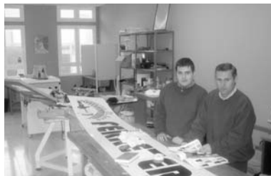
El taller de serigrafía también es parte de las actividades del Centro Ocupacional / COCEMFE ORETANIA