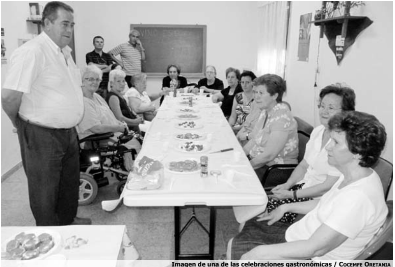
Imagen de una de las celebraciones gastronómicas

Sin embargo, la protagonista indiscutible durante estos meses ha sido la gastronomía, gracias a la celebración de una Jornada de Apicultura y Cata de Mielles en la que los asistentes descubrieron multitud de curiosidades sobre la apicultura; el funcionamiento de una colmena o los productos que fabrican las abejas. Además, pudieron degustar