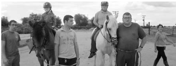
Integrantes de Cocemfe Asmicrip se beneficiaron de esta actividad

Gracias al constante e incansable trabajo de la organización y de la colaboración del consistorio del municipio, se pueden celebrar este tipo de jornadas. "El paraje está totalmente accesible, sobre todo para personas que están en silla de ruedas, ya que poseen rampas de madera, para acceder a cualquier parte", prosigue Uceda. El balance de este año ha sido "muy positivo", ya que socios, amigos y familiares de Cocemfe-Asmicrip pasaron un día distendido y agradable.