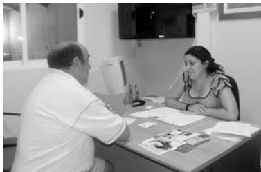
Una de las entrevistas que se desarrollan en el Servicio de Integración Laboral / MARÍA JOSÉ GARCÍA

Por este motivo, el máximo responsable de la entidad animó a los empresarios a apostar por este co-