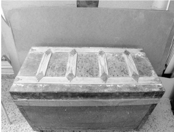
Uno de los baúles que se tiene previsto restaurar

La Asociación Sagrada Familia de Herencia lleva a cabo durante varios años el taller de Restauración de Muebles, con el fin de hacer revivir muebles, que en muchas ocasiones ocupan los lugares más olvidados de las casas