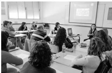
Imagen del taller que se desarrolló en Tomelloso