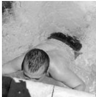
Los integrantes del centro ocupacional disfrutaron y se ejercitaron en el agua

El verano trae consigo jornadas más largas y calurosas que acompañan al ocio y disfrute al aire libre. Los parques acuáticos se convierten en el epicentro de este tipo de jornadas, ya que son lugares propicios para refrescarse de las altas temperaturas de las que se gozan en el centro de la llanura manchega. Conscientes de este hecho, el Centro Ocupacional Cocemfe de Bolaños organizó el pasado 8 de julio una salida hacia