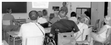
Asistentes a la charla