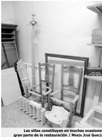
Las sillas constituyen en muchas ocasiones gran parte de la restauración / María José García

son más fáciles de emplear y corregir si se comenten errores". Así se ha de seguir dirección de la veta de la madera hasta que se haya cubierto toda la superficie del mueble. "Hay veces que se emplea un paño de algodón después, con el fin de eliminar el exceso de tinte y evitar las saturación del color". Después de todo este proceso, se ha de dejar secar durante al menos dos días en un lugar ventilado y seco, donde no le dé el sol directo, por ello, y a pesar de que el espacio de la sede es reducido, se puede