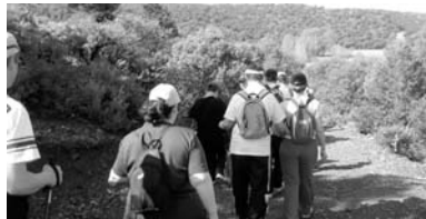
Los integrantes de Adifiss caminaron varios kilómetros a orillas de las lagunas

La jornada sirvió de encuentro con otras asociaciones de la provincia y la región, ya que reunió a un total de 86 personas de las asociaciones Afad, Apam, Coraje, Adace Albacete y Ciudad Real y Laborvalía, y supuso el comienzo de las cinco rutas que el Gobierno de Castilla-La Mancha tiene programadas hasta el mes de noviembre. Así, las próximas citas serán en La Hoz el Río Dulce, el 15 de octubre en la provincia de Guadalajara, y en la Sierra de San Vicente, el 12 de noviembre en Toledo.