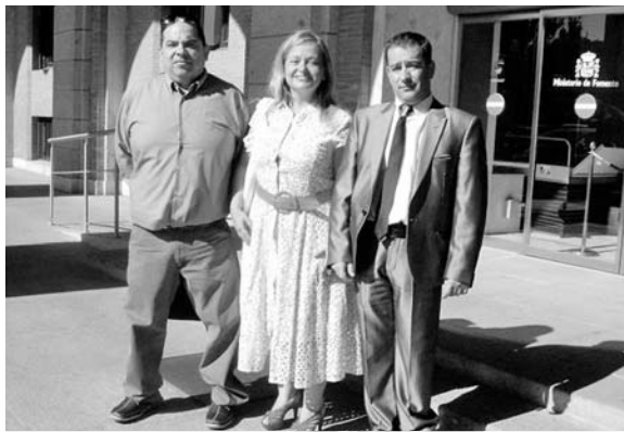
Presidente y tesoroero de Aisdi, junto con la concejala de Bienestar Social de Puertollano, a las puertas del Ministerio de Política Social