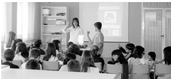
Malagón fue otra de las localidades a las que llegó el taller organizado por la OTA / COCEMFE ORETANIA