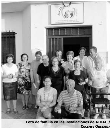
Foto de familia en las instalaciones de AIDAC / COCEMFE ORETANIA

probar algunas especias mediante el maridaje con distintos alimentos. Sin duda, una oportunidad única para conocer las propiedades que estas plantas otorgan a sopas, ensaladas, postres o salsas.