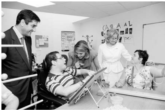
Un momento de la visita de la presidenta castellano-manchega

http://promociones.universia.es/microsites/promociones/fundacion_becas_capacitas/index.html