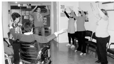
El Tai Chi ayuda a paliar los síntomas de la artritis