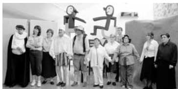
Los actores de Amipora que interpretaron Don Quijote

asociación porzueña, llegó la hora de salir al escenario. Nervios y miedo escénico quedaron atrás cuando los integrantes pisaron las "tablas" del espacio reservado en el albergue rural de Puerto Vallehermoso, en La Solana. Sus propios compañeros y gran parte de los integrantes y directores de las asociaciones federadas que conforman Cocemfe-Oretania Ciudad Real esperaban expectantes. Y el resultado fue todo un éxito, que quedó patente y demostrado en el aplauso que Amipora recibió.