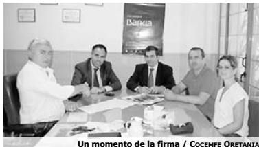
Un momento de la firma

Entre los servicios que se prestan destacan el apoyo a las actividades de la vida diaria, fisioterapia, terapia ocupacional, sala de relajación multisensorial, reeducación cognitiva y del lenguaje, animación sociocultural, terapia psicológica, asistencia social, transporte adaptado, equinoterapia, acuatrapia y deporte adaptado.