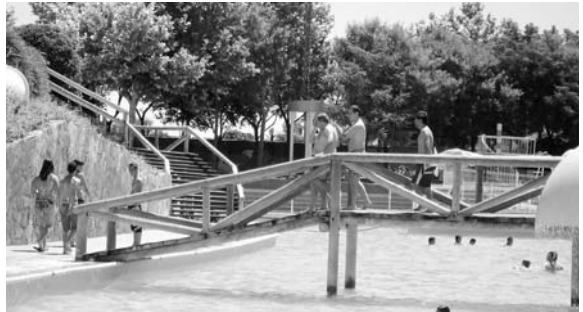
Imágenes de las instalaciones de Playa Park