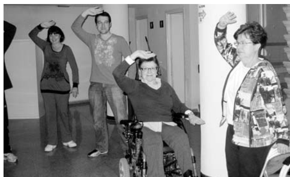
Algunos de los asociados practicando Tai chs

El taller, que tiene un carácter anual puesto que se recomienda un trabajo continuado, se desarrolla en la sede de Acrear y se centra en "los 8 tejidos de seda", es decir, estiramientos especialmente diseñados para fortalecer la relación músculo tendón, que beneficia al tratamiento de patologías reumáticas.