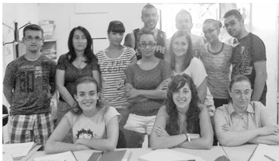
Foto de familia de los integrantes del curso de Lenguaje de Signos

Oramfys desarrolla desde el pasado 4 de julio y hasta el próximo 31 de agosto el taller Lenguaje de Signos, en el que alumnado está aprendiendo cómo comunicarse con personas con discapacidades, principalmente auditivas