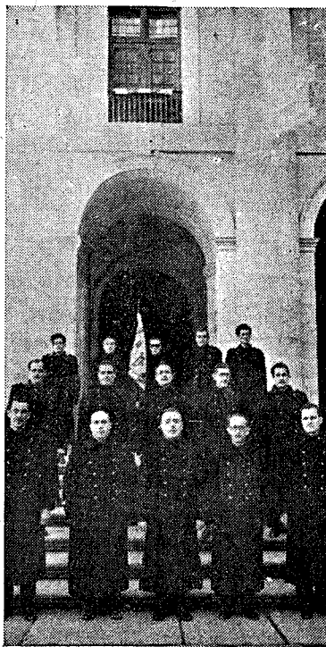
La guardia falangista de nuestra provincia ante la tumba del Fundador, forma en el Patio de los Reyes.

También se ha creado una nueva Centuria de las Falanges Juveniles, con alumnos del Co-