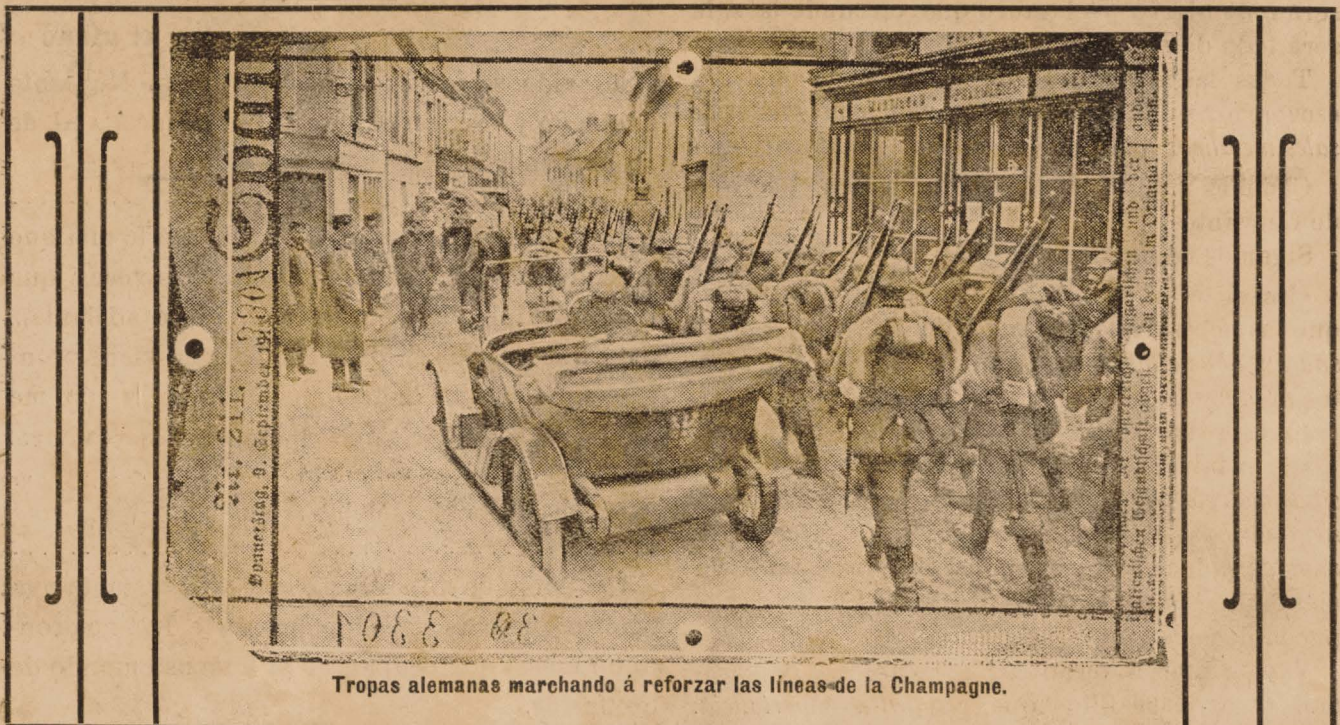
Tropas alemanas marchando á reforzar las líneas de la Champagne.

«La capacidad cúbica del local destinado á los