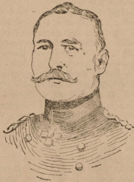
FIGURAS DE LA GUERRA

EL VON KLEIS que manda uno de los Cuerpos del ejército que opera en Flandes Guls Correter