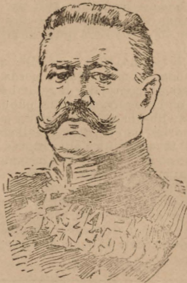
FIGURAS DE LA GUERRA

El general alemán VON HINDENBURG cuyo onomástico acaba de celebrarse en Alemania con gran regocijo por sus victorias sobre los rusos