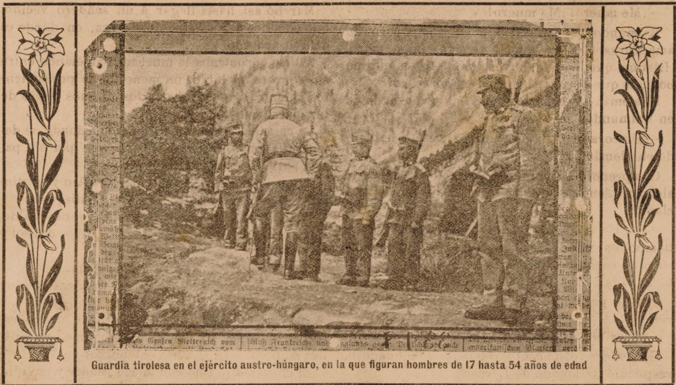
Guardia tirolesa en el ejército austro-húngaro, en la que figuran hombres de 17 hasta 54 años de edad

cuerpo, consiguió abandonar la hondura donde cayó. Miró, febril, en torno suyo. Ni una luz, ni una patrulla salvadora. Continuó arrastrándose y avanzando con angustiosa lentitud entre