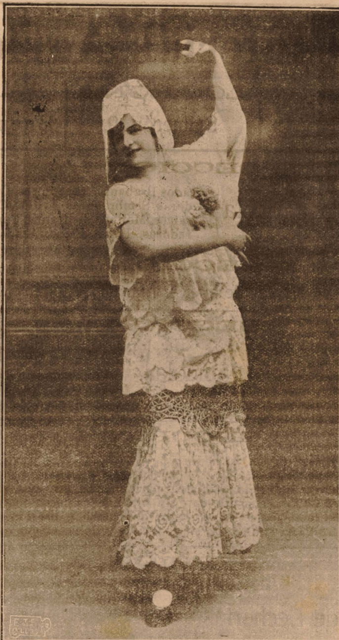
LA IDEAL MARUJILLA Bella artista de varietés, que actua en Cervantes.