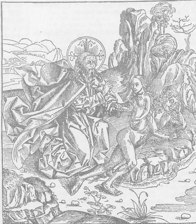
Formación de Eva

Ad Adá vt videret ca: ad no inuenit ad/ unoz filia sibi. immisit dñs spozoz in Adá z mlt vna de costis e? repleis carne. p car? edificauit in muliere. Quá adá videt dicit: h nico os de offib? meis h vocabit. Ifsa qd latie mlt interpretat: qz de viro supra e. facta igit adá de? in padifum trahit/ lit: z ibi de costá uoluit? Eua. pduxit: sibiq; socii formante: hññ fecit de capite ne viro dñaref: no de pede viro ne pñerret: h de latere vt amor? ym/ culti p baref: etiá vt no loca gener? nobilitare: h vir tute vniufq; sibi coparet gram. h extra padifus vir fact? e: mulier vero intra paradisu. E reaf deni/ qz extra padifus h est inferior loco vir fact? melioz inuenit p Eua q in padiso facta fuit Adá igit p/ doptafu primu boiem sumu? oim rez fabricatoz deus sexto die fecit qm z vicesima marci beffis terre creans cunctisq; repulib? z volucib? de limo terre rubeo i agro damasceno táq; creaturaz omi/ nu fine z possessore finit.