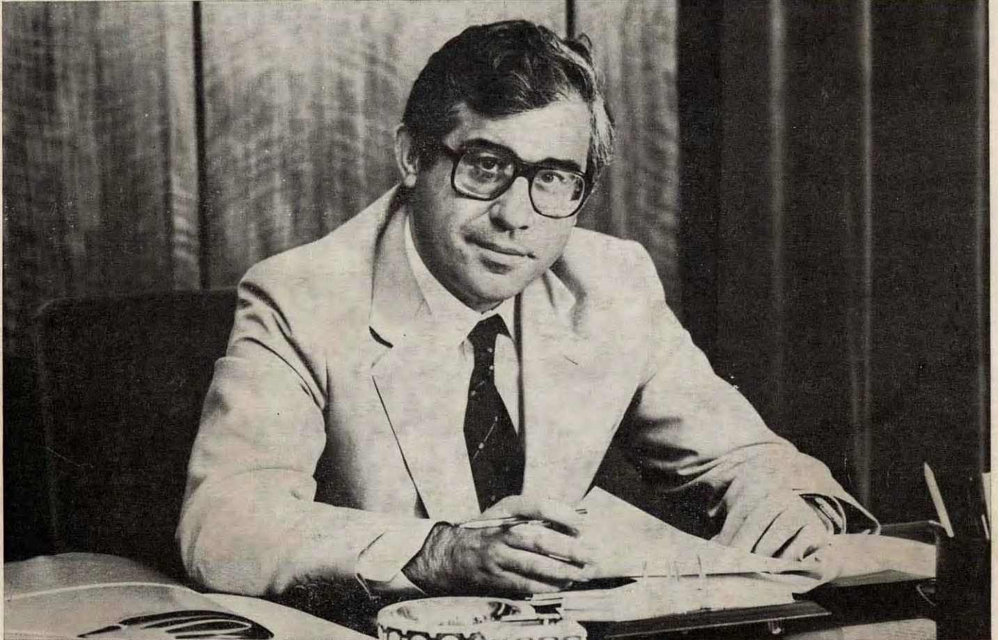
Don Jesús García Cobacho, Presidente de la Excma. Diputación Provincial de Toledo, tomó posesión de su cargo el día 20 de septiembre de 1982

REVISTA DE LA DIPUTACION PROVINCIAL DE TOLEDO