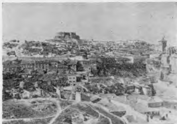
Panorámica de Chinchilla

La patria chica del gran teólogo Fray Melchor Cano, plebética de historia, con su Iglesia de Santa María del Salvador, de portada gótica y ábside plateresco, declarada Monumento Nacio-