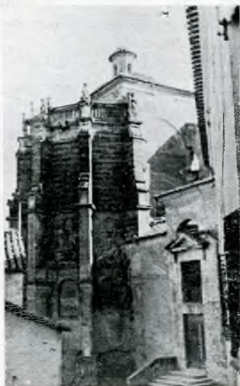
Angulo artístico de la Iglesia Chinchilla