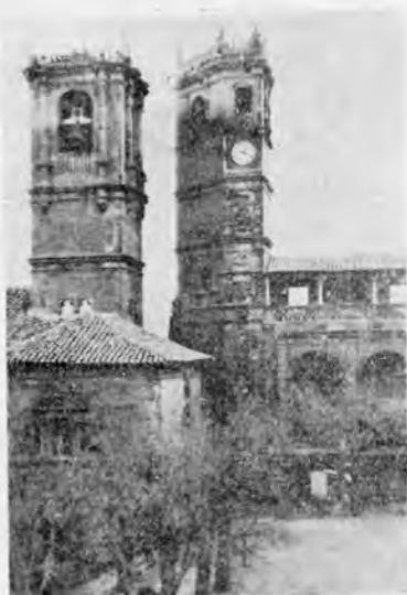
Las dos Torres.- Alcaraz

ALCARAZ.- Ciudad histórica de importancia estratégica en la guerra de la reconquista, enclavada en un terreno agreste, con su hermosa Plaza declarada Monumento Nacional y bajo la protección de la Dirección General de Bellas Artes y Comisaría del Tesoro Artístico Nacional; Iglesia de la Santísima Trinidad, con bello pórtico de estilo gótico; Torre de Tardón; Puerta de la Aduana; Iglesia de Franciscanos, con valiosas imágenes de Salcillo y de Roque López y retablos de gran valor arquitectónico; Ruinas del Castillo y del acueducto árabe que lo abastecía, y sus calles pinas entre recovecos de piedra y escudos de armas, que paralizan el vértigo de la historia en este remanso de paz y añoranza que es la "Cabeza de Extremadura y llave de toda España", patria de Simón Abril y de doña Oliva Sabuco de Nantes, y sede de las Cortes de Alfonso VIII el de las Navas con don Sancho de Navarra y don Pedro de Aragón, ocasión que motivó la denominación del Castillo de Cortés.