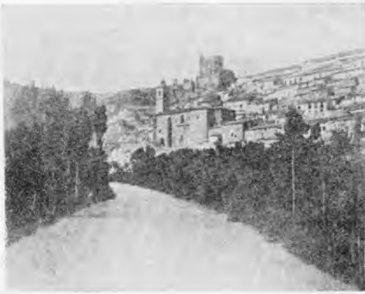
Perspectiva de Alcalá del Júcar

término, pero parece ser que radica ya en el colindante de Munera, según hemos visto anteriormente.