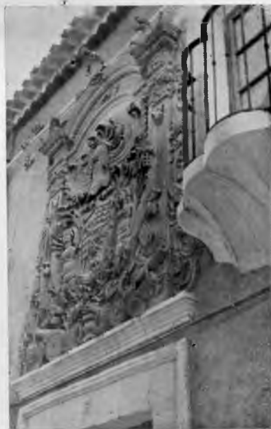
Escudo de Armas de la Heráldica Chinchilla