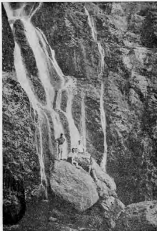
Los Chorros.- Riopar

LIÉTOR. - Letábrum, en su denominación romana, célebre por la batalla que allí se libró entre el Cónsul romano Flamíneo y el Régulo Corribilón, con una Iglesia Parroquial que alberga un maravilloso retablo barroco construido en 1.600 por iniciativa del Conde de las Navas; Pintura mural del florentino Pietro; Dolorosa y San Juan, de Salcillo, y, en el orden natural, una gruta inexplorada, con estalactitas, emplazada sobre un acantilado de más de 100 metros de altura, por cuyo fondo discurre el río Muño, dándole al paisaje belleza sobria y colorista.