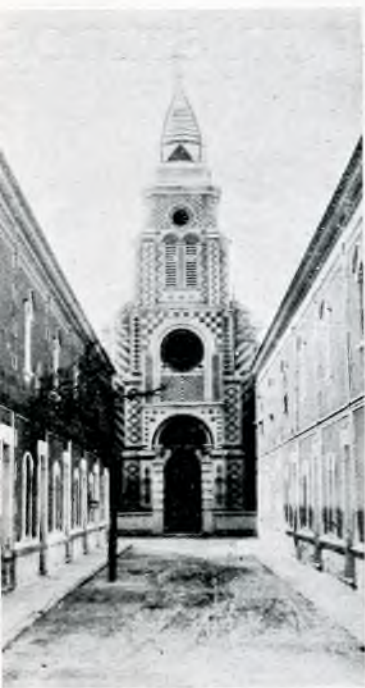
Iglesia y Barrio de San Francisco Caudete