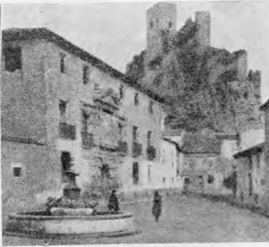
Casa Grande y Castillo.- Almansa

Con su famoso Castillo, declarado igualmente Monumento Histórico Nacional; la Casa Grande, donde se celebró la entrevista de reconciliación entre don Jaime el Conquistador y Alfonso X el Sabio, de soberbia portada barroca y patio interior de dos pisos de estilo jónico e indudable