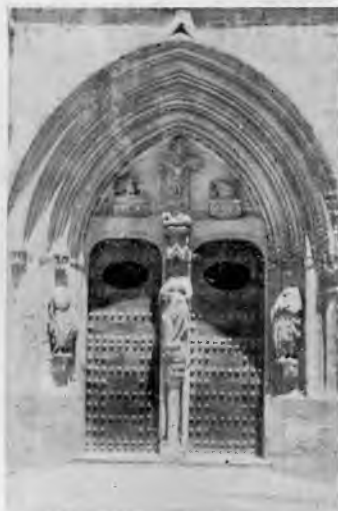
Pórtico parroquial.- Chinchilla