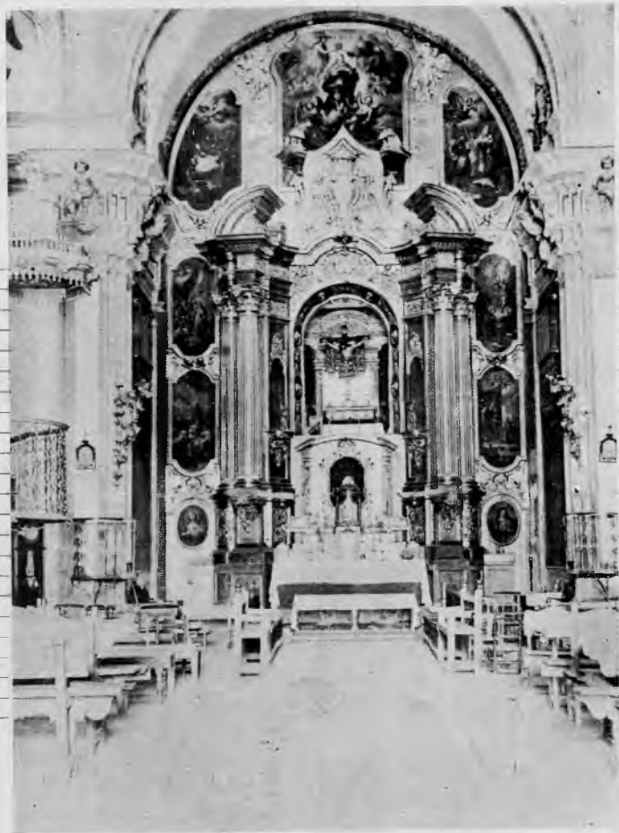
RETABLO DEL ALTAR MAYOR DE LA PARROQUIA DE PEÑAS DE SAN PEDRO