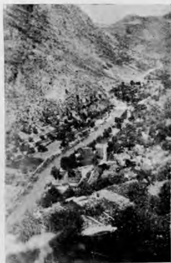
Presa "Bermeja", en el Río Mundo.- Liétor