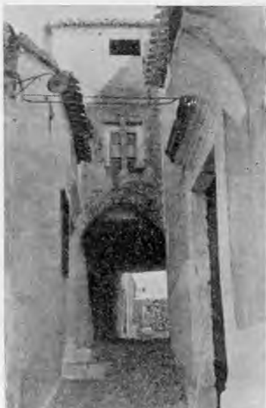
Calle del Arco.- Chinchilla

nal; Casa Consistorial, portada renacimiento; Castillo, que fué del Marqués de Villena; Iglesia de Santo Domingo, de artesonado mozárabe; Iglesia de Santa Catalina, mezquita de moros; termas, pozos y cisternas de origen morisco; valiosos Ternos en la Parroquia, y diversos lugares de auténtico interés, que deleitan al visitante durante varias horas y cuya enumeración ocuparía por sí solo un volumen expresamente escrito sobre Chinchilla.