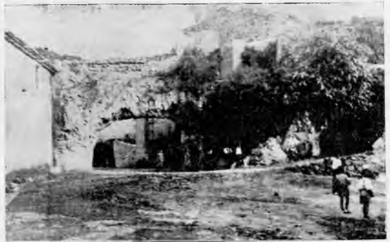
Arcos de las Moreras.- Letur

Verdadero oasis en medio de la llanura manchega, ofrece un paisaje realmente interesante en las Lagunas de Ruidera, que en número de trece, van vertiendo unas en otras sus aguas, haciendo un conjunto que en la actualidad