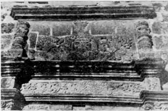
Lignum Crucis.- Alpera