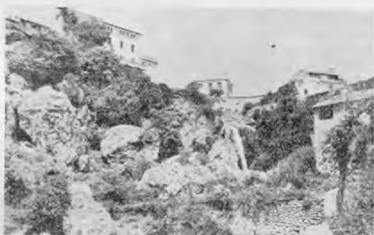
Charco del Diablo.- Letur

AYNA.- Izada sobre una mole de roca, este pueblo se ha llamado la pequeña Suiza española, por su espléndido paisaje, semejando un velero anclado en el río Mundo, que se lanza turbulento en medio de peñascos, encinas y madroños. Ofrece uno de los panoramas más bellos en que puede recrearse el espíritu.