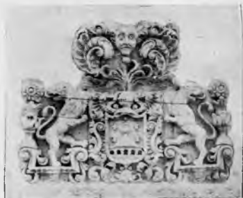
Escudo nobiliario.- La Roda