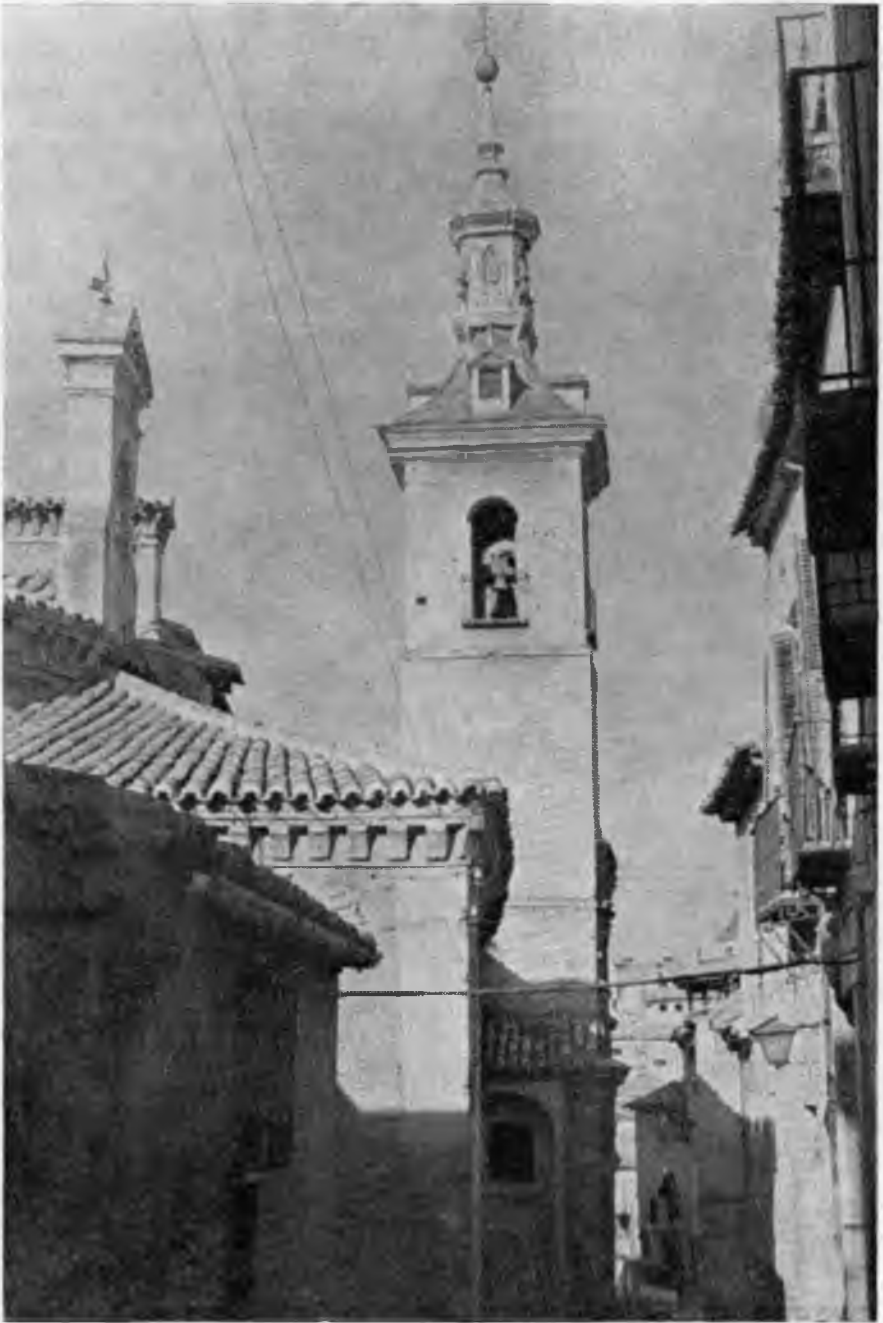
Torre parroquial de San Justo y Pastor, en Toledo