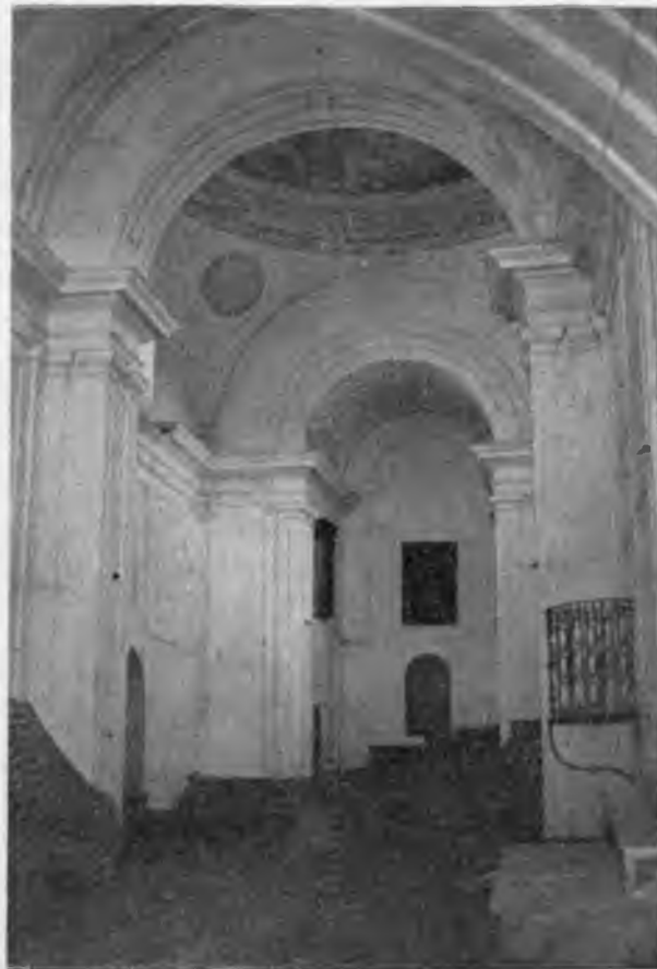
Iglesia de San Sebastián, en Lillo (Toledo). Exterior e interior