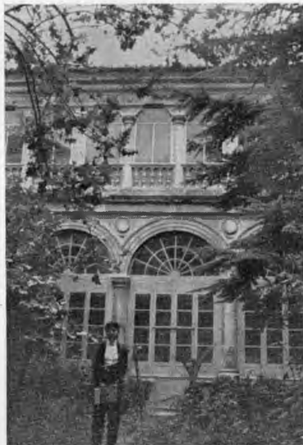
Convento de Santo Domingo, de Ocaña (Toledo). Fachada principal y claustro