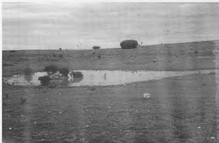
Estado del Navajo de Riosalido en la primavera de 1997, este depósito surge de agua a Riosalido.

Ranz Yubero me regala algunas de sus valiosas publicaciones, y un artículo sobre "las Tres Guadalajaras", en donde se distribuye la provincia entre Arévacos, Carpetanos, Olcades y Lusones (Bellos, Tittos y Lobetanos).