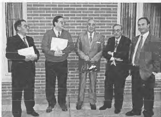
Comité Ejecutivo del Encuentro.