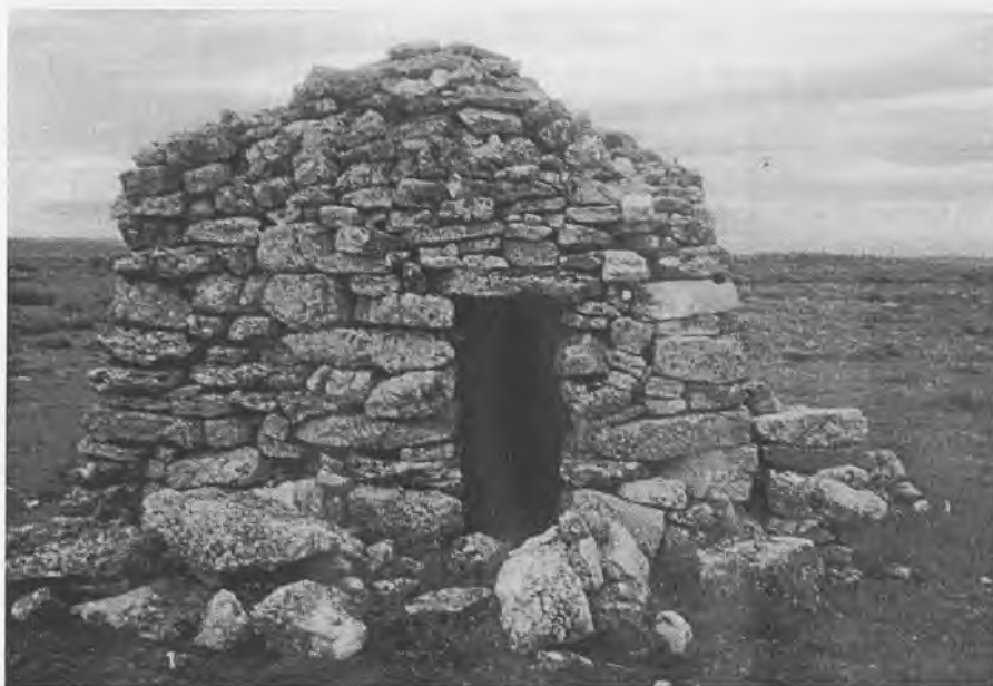
La importancia de la ganadería se ve en este “rancho”, que ha servido de refugio de pastores.

b) Ganadería : Corrales, Dehesillas, Desillas, Majada, Pradera (4), Praderas (3), Prederilla, Praderillos, Prado (9), Resplenda, Sesteros, Sexteros, Solana (5), Verdinal (2), Zerrada (2), Zerradilla.