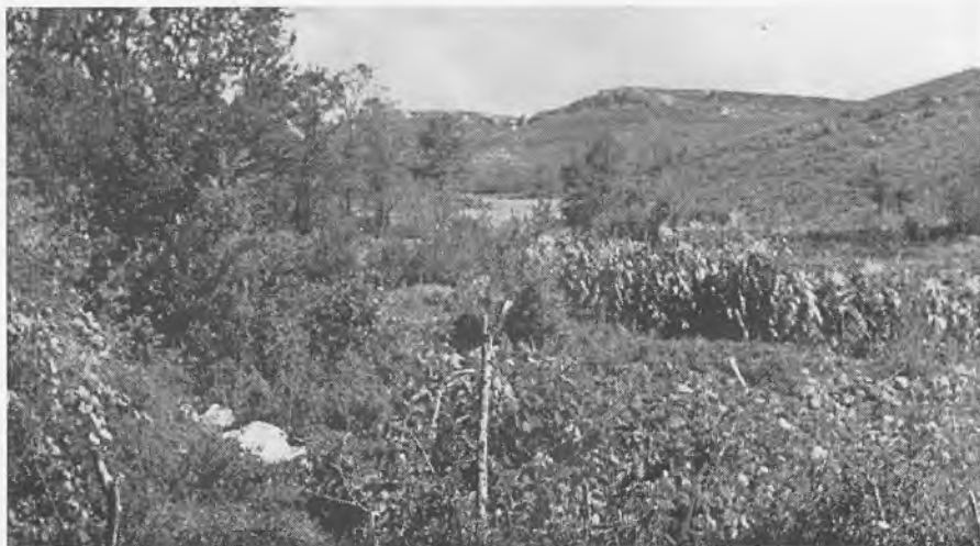
Imágen de la Fuentevieja , que sirvió al juez para tomar posesión del término.

17. Estando en el término , en la parte de la fuente, al pie del cerro del arcial, tomó posesión de todo el término . Haciendo autos de posesión se paseó por dichos términos.