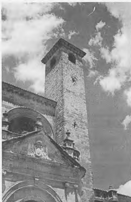
Detalle de una de las torres de la Catedral de Sigüenza.

La calle en trabajosa cuesta que me lleva a la catedral, está casi vacía, ya se han ido, por estas fechas, los veraneantes, y en este día cualquiera, los transeúntes son pocos. El pavimento de esta calle principal se ve alterado por los escudos, a todo color, de la ciudad y del Cardenal Mendoza, de D. Pedro González de Mendoza, obispo y benefactor de la ciudad; cuyo palacio, por cierto, se esta reconstruyendo y viene a cerrar una herida de la Guerra y la Plaza. Es un lejano palacio de tipo renacentista italiano, en donde, todavía se puede ver una torre lateral.