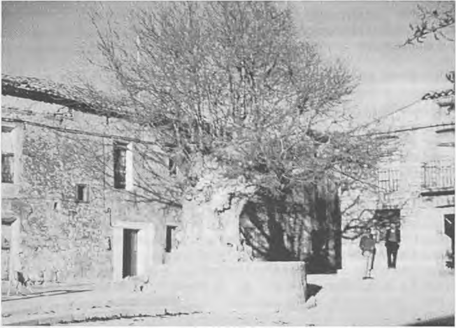
Imagen retrospectiva de la Olma de Riosalido , éste era el lugar donde el concejo se reunía en verano.

2. Este juez manda a los regidores reunir al Concejo , y a los vecinos, por llamamiento de campana, para notificarles la real cédula.