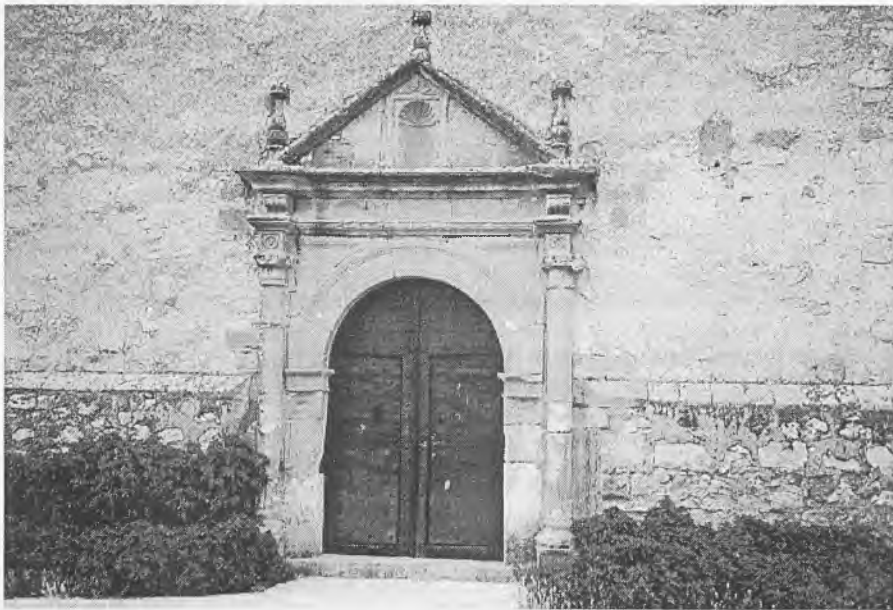
Portada de la iglesia de Riosalido.

“En la villa de Riosalido a 8 días de julio de mil seiscientos treinta y uno en presencia de D. Diego Gutierrez, cura y abad...”