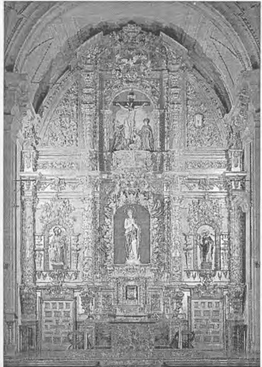
El actual retablo barroco del Seminario seguntino procede de Berlanga de Duero. Fue instalado en los años de la última postguerra.

Desde el final de la pasada guerra civil, no ha transcurrido ningún año sin, al menos, la ordenación sacerdotal de un alumno del Seminario seguntino y en el último medio siglo unos cuatro centenares de seminaristas seguntinos han accedido al presbiterado, de ellos 63 en los últimos diez años.