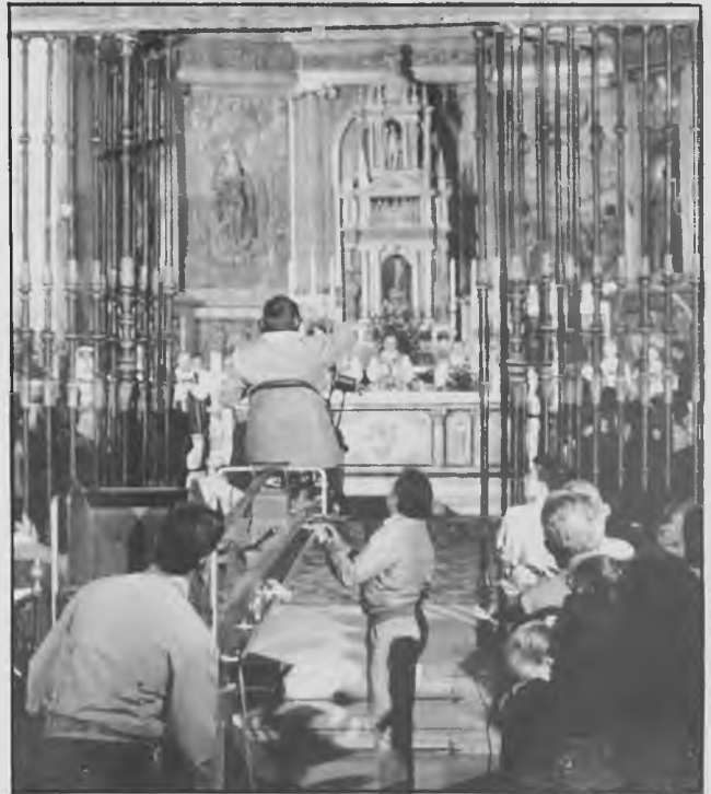
Un momento de la celebración Eucarística. El cámara de TVE se acerca al altar