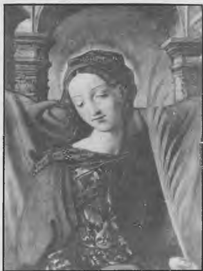
FIG. 5.—Detalle de la imagen central de Santa Librada, con la palma del martirio. Como en la pintura más antigua, que se conserva en el altar de San Marcos, 1511, se la representa con la palma del martirio, pero sin atributos que recuerden para nada la Cruz.

I.— Las reliquias de Santa Librada, virgen y mártir , traídas verosíblemente del Sur de la actual Francia, —entonces Aquitania—, por el obispo don Bernardo de Agén, son reliquias que por su volumen e importancia reciben la denominación de cuerpo . A lo largo de los siglos han recibido culto en los más diversos lugares, sobre todo de la catedral de Sigüenza, donde se veneran. Dada su acusada actividad itinerante, han llamado poderosamente mi atención para su estudio que vengo realizando desde hace más de veinticinco años.