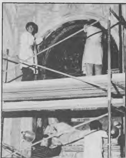
Momento de las obras de restauración de las tablas góticas que coronan el mausoleo del Doncel

Durante los días 27 al 30 de junio y 11 al 15 de julio se ha realizado una campaña de restauración en nuestra Catedral, por licenciados en Bellas Artes, de la facultad de