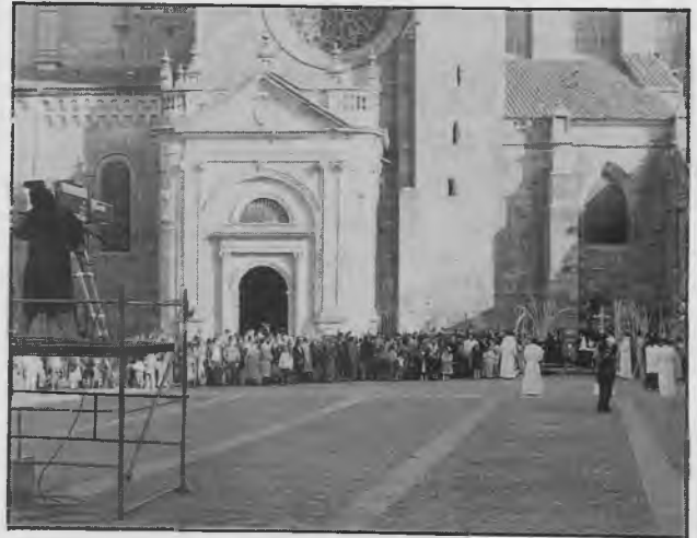
Antes de la Eucaristía, la Bendición de Ramos y Palmas en la Plaza Mayor

En aquella vispera nació la idea —luego una realidad— de que la Bendición y Procesión de Ramos sería no en el Claustro —idea primitiva—, sino desde el rincón de la Plaza Mayor que hace esquina con la casa de los canónigos, recorriendo la Plaza mendocina y penetrando en la Catedral por la puerta del Mercado. Aquel día se empezó a medir y tasar el milagro tecnológico de la televisión.