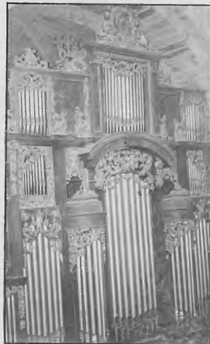
El órgano catedralicio volverá a vestir de estos tubos restaurados su inigualable música

Por fin, le llega ya su turno al órgano, tras tres años de espera. El número anterior de ABSIDE dedicó su reportaje al tema. Sabido de nuestros lectores es que en la misa televisada del 27 de marzo se estrenó una parte de la mencionada restauración, aproximadamente el 30 %, que constituye la llamada caja expresiva.