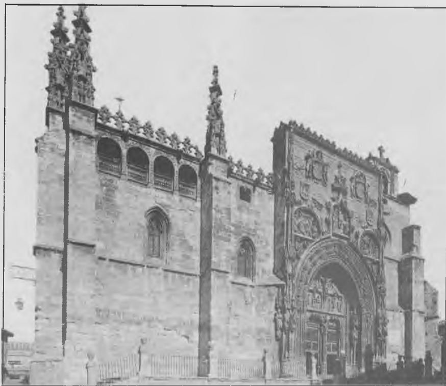
Panorámica de la Iglesia de Santa María, de Aranda

pueblo entonces crecedero y hoy crecido, que estaba —y está— como acostado a la ribera del Duero. Y que tiene, entre otros atractivos, una airosa Iglesia de Santa María, gloria y prez del