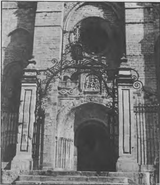
PLANO DE LA FACHADA DE LA CATEDRAL VOZ EN OFF

(Ofrecemos el texto de los comentarios que sirvieron de reportaje previo a la misa televisada el día 27 de marzo pasado. Con música de Pergolesi, Gil de Muro poetizó así sobre nuestra Catedral.)