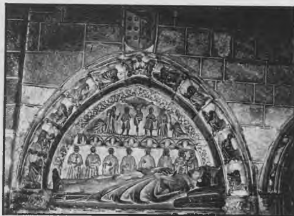
Sepulcro del Obispo D. Blasco en la Catedral de Avila

don Pedro III. Algunos breves datos anteriores pueden encontrarse en RENALES CARRASCAL, Joseph: Catalatto/seguntino, Serie Pontificia, y Annales/Diocesanos./Que da a luz/El Doct. D.../Cura que fue de las Parroquias de Alcolea, y Villa-verde, en el Obispado de Sigüenza, despues Cura de/la Parroquial de la Villa de Sesseña, Partido de/Illescas, en el Arzobispado de Toledo, y al/presente Canonigo en la Santa Iglesia/Catedral de Sigüenza./Que dedica/Al Illustrissimo Señor/Don Fray Joseph Garcia, Obispo, y/Señor de Sigüenza, etc./Con Licencia. En Madrid: Por los Herederos de/la Viuda de Juan Garcia Infanzon./Año de M.DCC.XLII . Pág. 55, que copia descaradamente a Portocarrero y pone a don Blasco después de don Pedro III, en el lugar XXI del episcopologio, y antes de don Gonzalo de Aguilar, aunque añade: «Creido se ha, que fue su successor Don Pedro Barroso, más hallo, que lo fue Don Gonzalo antes que este».