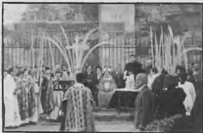
Momento de la misa televisada desde nuestra Catedral. Bendición de Ramos en la Plaza Mayor