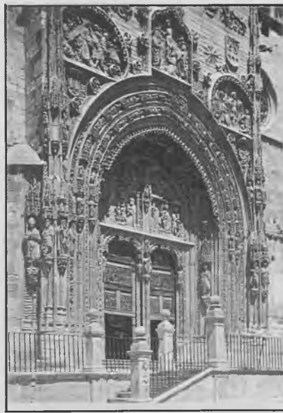
Detalle de la fachada principal de la misma iglesia, objeto de este artículo

Confieso que lo que más excitaba mi curiosidad, y también mi imaginación, eran los escudos. Santa María los tiene espléndidos. Escudos reales, episcopales y municipales cuya descripción somera, entonces suficiente, buscaba yo en las historias escritas de la villa y de la parroquia. Los escudos se me antojaban importantísimos. Eran como un acertijo. Llenos de símbolos, cargados de intenciones. Pronto aprendí, por ejemplo,