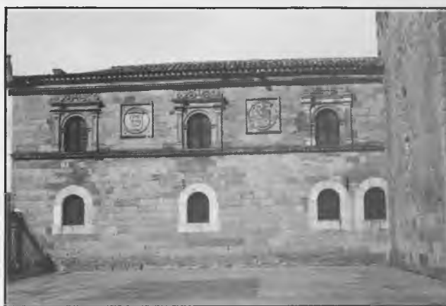
Edificio de la Contaduría y del General de la Gramática

El edificio que se construyó sirvió a partir de entonces de límite norte al patio de los Perdones, existe ante la fachada principal de la Catedral (7). Su alargada planta rectangular, que por el oeste se apoyaba en el lienzo de la muralla catedralicia que aún permanecía en pie en aquel sector, sufría un ligero estrechamiento por el este para ajustarse al cuerpo inferior de la torre norte de la fachada de la Catedral y para poder alcanzar los muros perimetrales de la capilla del Corpus Christi, la actual parroquia de San Pedro. Desde esta capilla, y a través de una tribuna existente hasta hace pocos años en su primer tramo, se podía acceder al piso superior de los dos que en altura componían el nuevo edificio, en el cual se ubicó la Contaduría, y por las escaleras interiores del mismo al General o aula de Gramática, que se