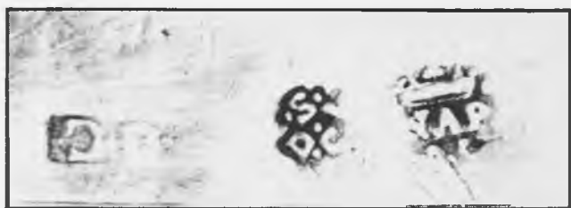
Marcas de los candeleros napolitanos.

a la ciudad italiana de Nápoles (5); pensamos que la del artífice es la de cuatro letras, y la de dos corresponde al contraste. Desconocemos la cronología que corresponde a estas marcas, por ello su datación la hacemos teniendo en cuenta su tipología. A pesar de su procedencia extranjera, guardan gran semejanza con las piezas de este tipo realizadas en Madrid y Sigüenza en el siglo XVII, pero sobre todo con las madrileñas de fines de siglo; por ello nos inclinamos a pensar que fueron realizados en los últimos años de la citada centuria. Son obras sencillas y bien ordenadas.