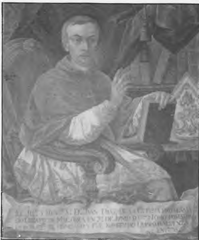
Retrato del Prelado Díaz de la Guerra en su época de Obispo de Mallorca.

Sigüenza tuvo en él a uno de sus más grandes Obispos. En los 23 años que residió y estuvo al frente de la diócesis, la ciudad se engrandeció y prosperó en todos los órdenes, incluso en el económico. Muchos Obispos le habrán