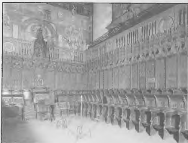
Coro catedralicio, uno de cuyos sitialos fue ocupado por el maestro Ciruelo.

Durante tres años ejerció Ciruelo su magisterio filosófico en Sigüenza, aunque en ocasiones los documentos capitulares, que le califican como egregio varón , le asignan el título de Maestro de Teología. Tan importantes debieron ser sus lecciones que se interesó por ellas el obispo titular de Laodicea y auxiliar en Sigüenza del Cardenal Carvajal, Fray García Bayón, dominico y uno de los más valiosos predicadores de su tiempo, hasta el punto de que con fecha 19 de abril de 1504 solicitó del Cabildo seguntino, al que pertenecía, la gracia de recibir lecciones del Maestro Ciruelo en la cámara que el propio obispo tenía en la Universidad, sin perder por ello presencia en coro, gracia que el Cabildo concedió.