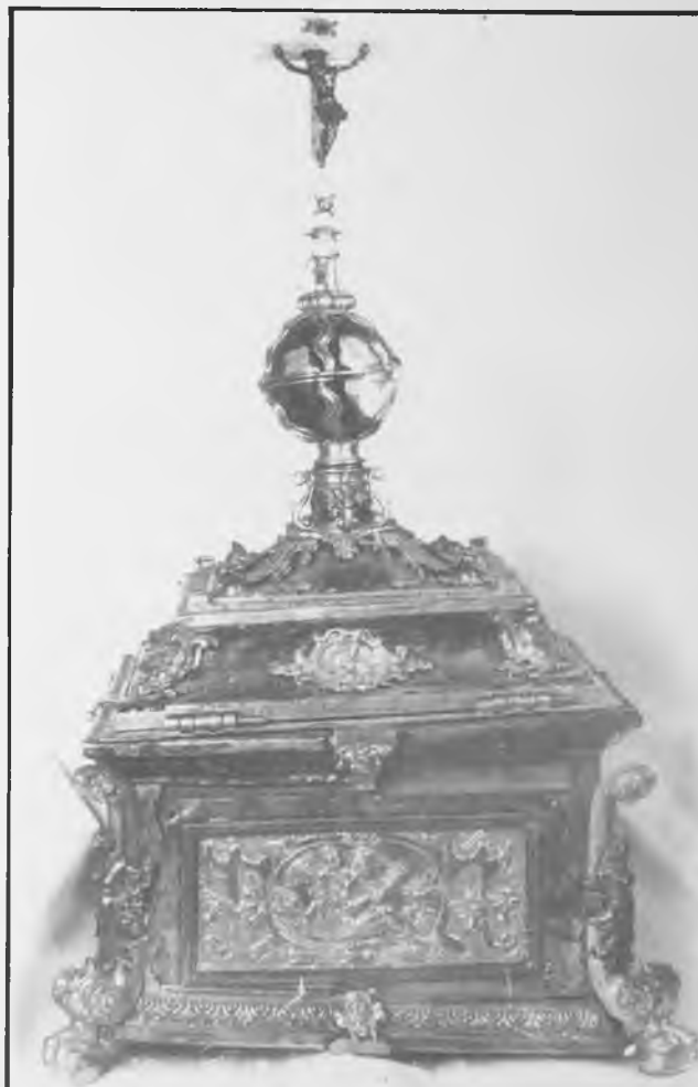
Arqueta. ¿Italia?, fines del siglo XVI.

No podemos precisar exactamente cual es su procedencia geográfica, pero creemos que es italiana atendiendo a la inscripción que presenta el marbete de su interior: "regaló al conde de Tendilla un Papa". Su llegada a la Catedral se debe al obispo Figueroa y Córdoba, quien ocupó la sede episcopal entre 1580 y 1605, que, según Pérez Villamil, la donó tras adquirirla en la testamentaría del conde de Tendilla (2).