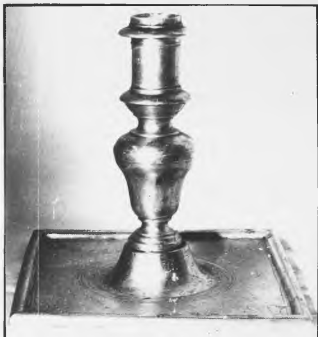
Candeleros. Nápoles, fines del siglo XVII.

a la ciudad italiana de Nápoles (5); pensamos que la del artífice es la de cuatro letras, y la de dos corresponde al contraste. Desconocemos la cronología que corresponde a estas marcas, por ello su datación la hacemos teniendo en cuenta su tipología. A pesar de su procedencia extranjera, guardan gran semejanza con las piezas de este tipo realizadas en Madrid y Sigüenza en el siglo XVII, pero sobre todo con las madrileñas de fines de siglo; por ello nos inclinamos a pensar que fueron realizados en los últimos años de la citada centuria. Son obras sencillas y bien ordenadas.