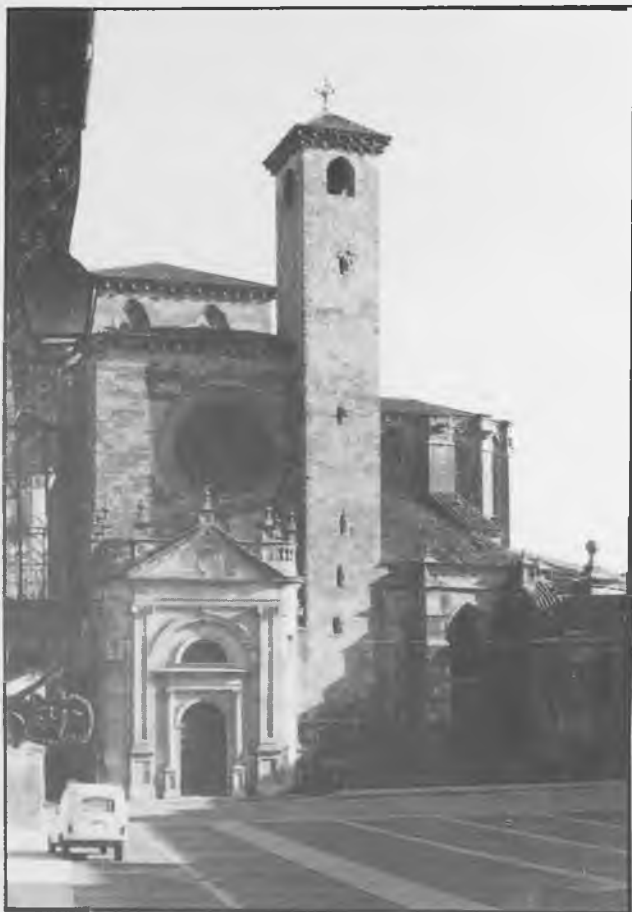
Puerta del Mercado en el muro sur de la Catedral, construida por iniciativa de Díaz de la Guerra.

Fueron testigos propuestos por el denunciante y prestaron declaración bajo juramento las siguientes personas: