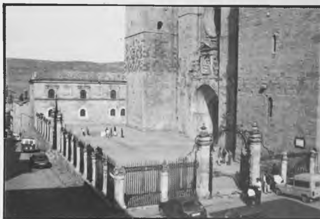
Patio de los Perdones.

Una vez construidas las gradas y realizado el enlosamiento se colocaron en torno al patio seis colum-