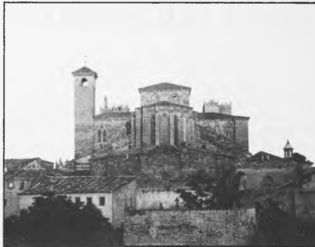
El vendaval que castigó tan duramente nuestra ciudad en la primavera pasada asolando también el arbolado de la Ronda, nos permite contemplar una excepcional e inédita panorámica del ábside catedralicio, captado al amanecer en esta magnífica fotografía de Rafael Amo.