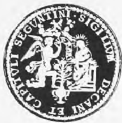
Publicaciones del Cabildo de la Santa Iglesia Catedral Basílica de Sigüenza

páginas e incluye una espléndida colección de fotografías, así como planos del templo. La publicación ha sido patrocinada por el Obispado y