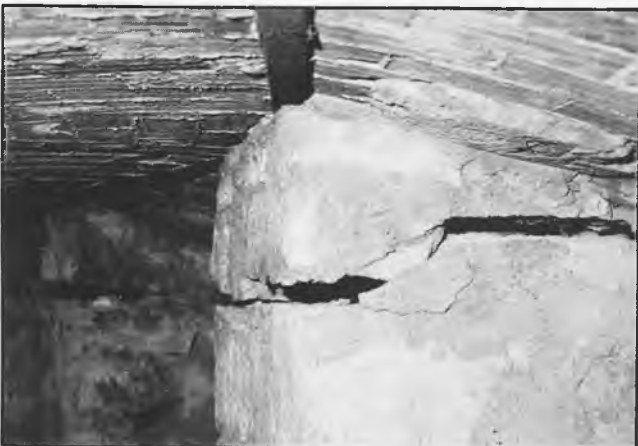
Grietas de uno de los botaretes de la cubierta de la Gírola

Ha sido una polémica de papel. Ha tenido visos de tormenta de verano. En cualquier caso, una de esas codiciadas serpientes veraniegas que, al final, surten efecto. La Catedral de Sigüenza estuvo en el centro de la actualidad. Se hicieron eco todos los medios de comunicación. La culpa la tenía —la sigue teniendo— la girola catedralicia cerrada al público desde hace más de un año: ese mal de la piedra que se resquebraja y que deja girones de historia, de arte, de vida. El claustro y la capilla del Doncel también se sienten aquejados de la misma dolencia. Y la reparación se hace precisa. Ahora parece que va a llegar. Y pronto. Pero antes sucedió una breve historia en poco más de quince días, que reza así: