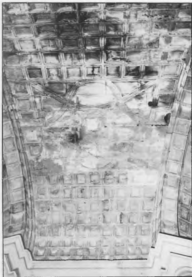
Medallón de la Girola, casi completamente desaparecido