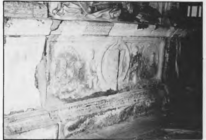
Frontal deteriorado como consecuencia de la humedad en la Capilla del Doncel

MARTES, 14 DE JULIO: En el espacio informativo de mediodía de Castilla-La Mancha se emite durante noventa segundos el reportaje referido, que es anunciado en el sumario muy sensacionalísticamente: « Cerrada al culto la Catedral de Sigüenza ». El desarrollo del reportaje se ajusta más a la realidad. Los problemas afectan tan sólo a la Gírola, Claustro y Capilla del Doncel. La información es así correcta.