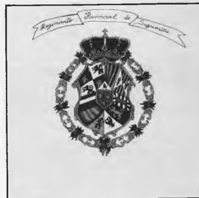
Bandera Coronela del Regimiento Provincial de Sigüenza. 2.ª mitad del s. XVIII.