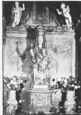
Ntra. Sra. la Virgen de la Mayor Patrona de Sigüenza