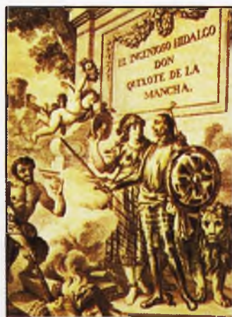
Campaña: Un Quijote, un euro (Pág. 22)