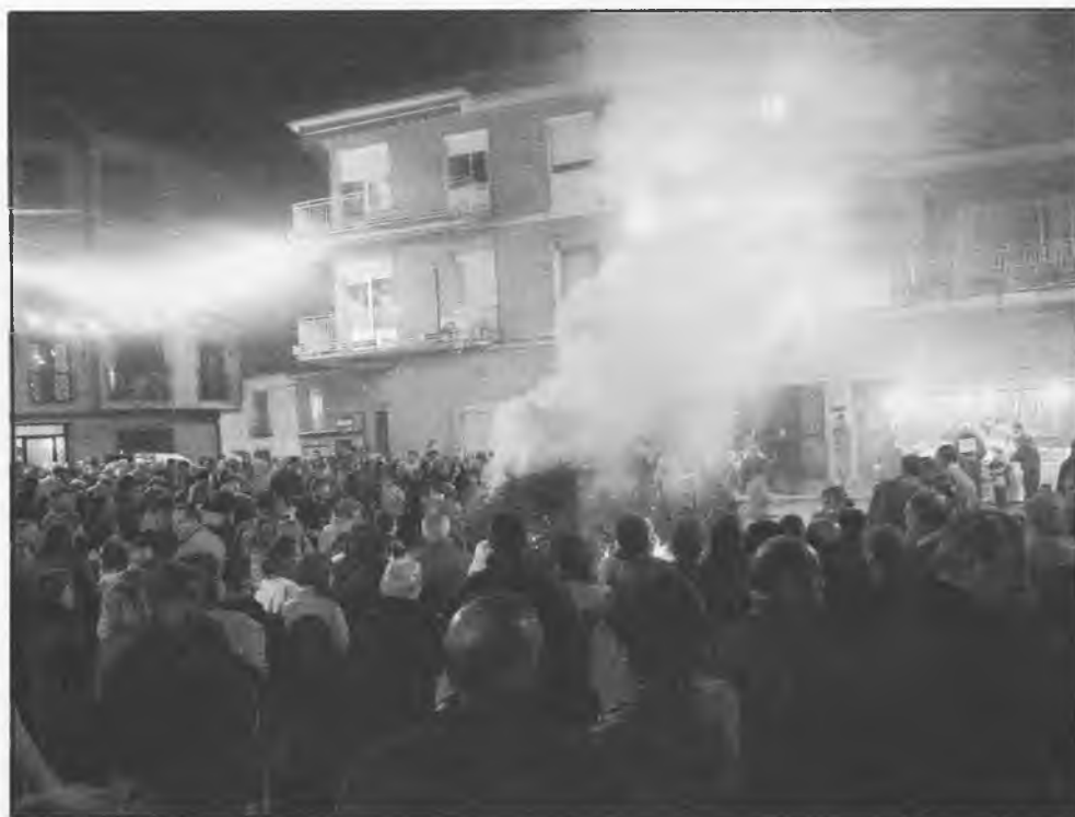
Se encendió la tradicional hoguera de San Antón, como viene sucediendo hace muchos años

- La Guardia Civil de Daimiel, detuvo a un individuo, que había producido un grave altercado absurdo. Viajaba en un autobús Monasterio-Barcelona y exhibiendo un destomillador, amenazó al conductor y pretendió que se apearan los viajeros. Alguien avisó a la Guardia Civil, que se presentaron y hubieron de forcejear con el asaltante, hasta reducirlo.