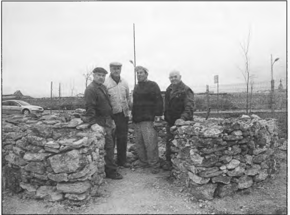
Miembros de Bolote, están construyendo, artesanalmente, este bombo, para conmemorar su 25º aniversario

Además de esta iniciativa, Bolote colaborará con la Banda Municipal de Música, para adaptar piezas populares que puedan ser representadas. Igualmente editará un "Bolotín", que recogerá las actividades de la asociación a lo largo de estos veinticinco años. Organizarán el habitual encuentro Folk, una exposición etnográfica, una muestra con una proyección de villancicos y un recital con todas las personas que han pasado por Bolote.