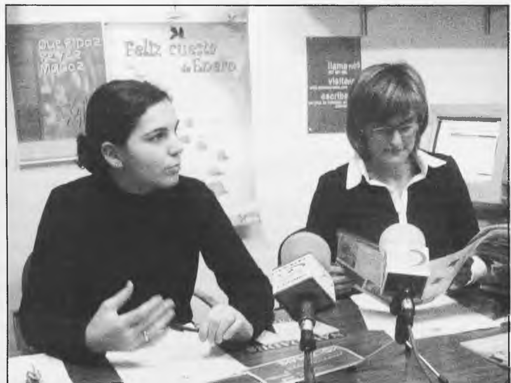
Concejal de Consumo y responsable de la OMIC

Daimiel, volvió a instruirnos, como siempre se avecina la época de rebajas, de los derechos que asisten a los consumidores, y nos aconsejó sobre como realizar adecuadamente nuestras compras, recordándonos entre otros puntos, que una reducción del precio no tiene que significar una peor calidad de un producto, que en estos debe figurar, tachado, el precio anterior al lado del nuevo precio, o la diferencia entre los conceptos rebaja y saldo.