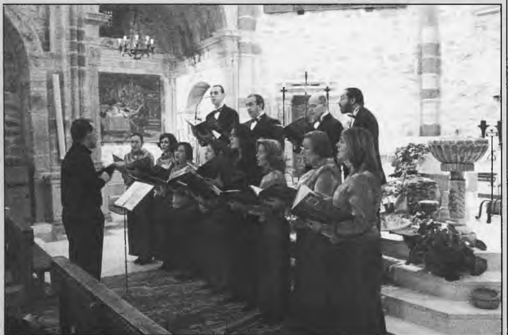
Actuación del Coro de Cámara Laminium en Terrinches