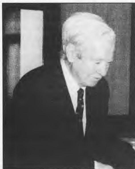
Don Faustino Sanz Herranz, uno de los imagineros españoles más importantes de todos los tiempos.

Don Faustino tiene la característica personal más inequívoca de cualquier genio que se precie de serlo: La humildad.