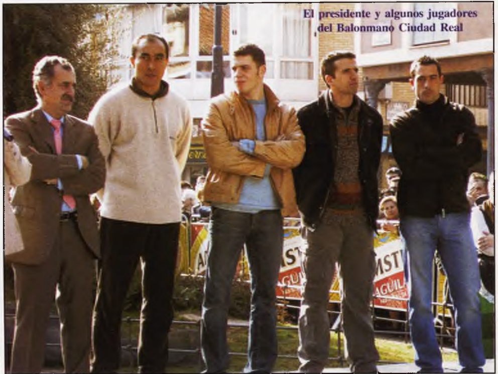
El presidente y algunos jugadores del Balonmano Ciudad Real

El viernes, día 23, ya podía visitarse la carpa instalada en el centro de la Plaza de España -coincidió con la quema de la hoguera de La Paz-, donde echamos en falta la multitud de barras que había el año pasado. En esta edición, se instaló una barra central gestionada por miembros del Patronato de Turismo: Tourbycicis, El Bodegón, Hotel-Restaurante Las Tablas y Cooperativa Los Pozos. También pudimos apreciar que, la gélida noche no dejaba lugar a dudas, era necesaria la instalación de un elemento que proporcionase calor al interior de la carpa. Esperemos, que para sucesivas ediciones, se tenga en cuenta que las fechas en las que se celebra esta fiesta y, al menos en la carpa, se