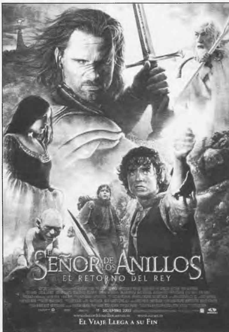
Ya se presentó en España "El Señor de los anillos": El retorno del Rey"

Pero ahí no queda la invasión de las trilogías. Para este año 2004, tendremos más terceras partes como: Misión Imposible, Harry Potter y el Episodio III de Star Wars, incluso en nuestro país ya se habla de la llegada de Torrente III. Al final tendrá razón aquel refrán que decía: "A la tercera va la vencida".