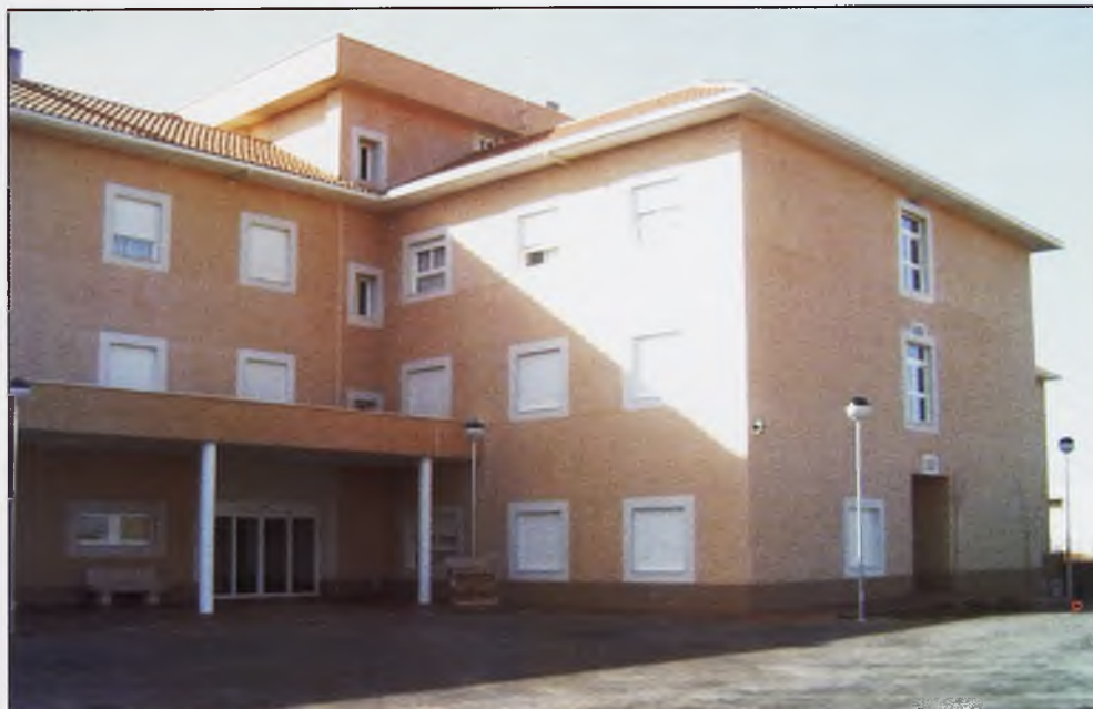
La residencia "La Masiega", ofrece este extraordinario aspecto.

En anteriores artículos, ya comentamos la extraordinaria dotación de esta residencia. Entre los servicios que ofrece están el de alojamiento y manutención, además de los servicios de asistencia social, médicos y sanitarios. También dispone de otro tipo de actividades como: animación sociocultural, fisioterapia, servicio de lavandería, traslado de residente, peluquería y servicios religiosos. Cuenta con un total de 44