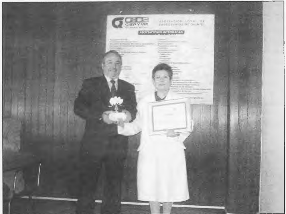
El presidente de la Asociación de Empresarios, junto a la ganadora del Concurso de Escaparates, que correspondió a Floristería "Las Camelias"

El Banco de Ropa de Cruz Roja de Daimiel, idea surgida aproximadamente hace un año y que tiene como objetivo