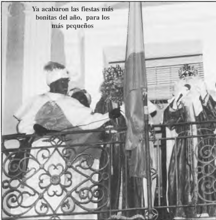
Ya acabaron las fiestas más bonitas del año, para los más pequeños