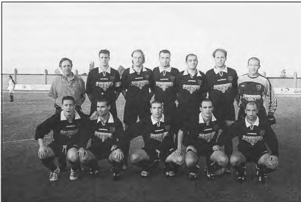
Esperemos que la segunda vuelta sea tan buena como esta primera que acaba de terminar

El Daimiel C.F. ha realizado la mejor primera vuelta de su historia. Con 50 puntos en su casillero de los 19 partidos jugados