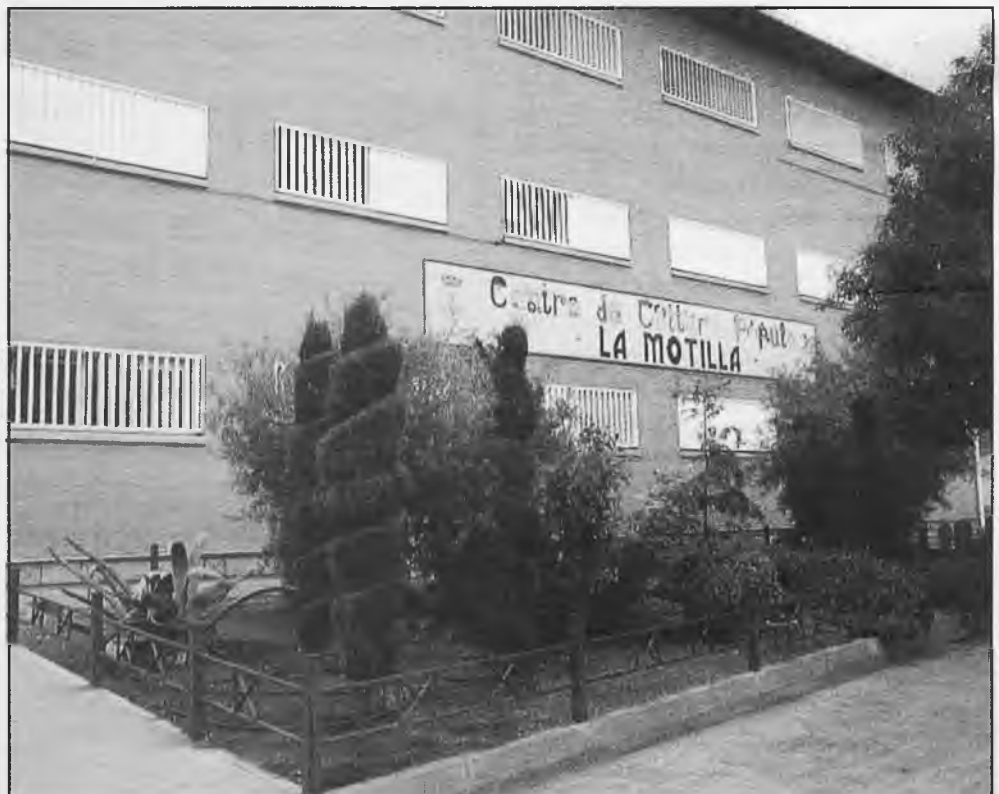
Centro Popular "La Motilla"