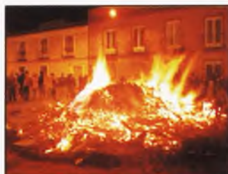
Fiesta de Nuestra Señora de la Paz (Pág. 8)