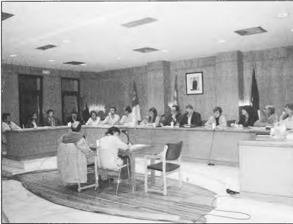
El trabajo de la oposición en el Ayuntamiento, no siempre es reconocido

deración que los daimieleños deberían valorar, como es la ausencia de soluciones al problema laboral, haciendo que la gente piense que su única meta es la de ponerse encima un peto amarillo durante unos meses al año, al igual que permitir que sigan saliendo tantos trabajadores hacia Madrid. Después de doce años de gobierno socialista, los parados aumentan, la fiscalidad es excesiva en comparación con los servicios ofrecidos, las empresas que vienen a Daimiel no se ajustan a las necesidades ecológicas de nuestro acuífero y además repercuten, muy poco, en la oferta de trabajo (tan amplia y beneficiosa que se prometía a nuestros ciudadanos, nuestros jóvenes no tienen alternativas nocturnas de ocio y la inseguridad ciudadana en nuestro pueblo está siendo un problema que va creciendo, entre otras muchas cosas más.