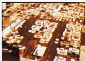
Proyectado un Aparcamiento Para el Centro (Pág. 17-18)