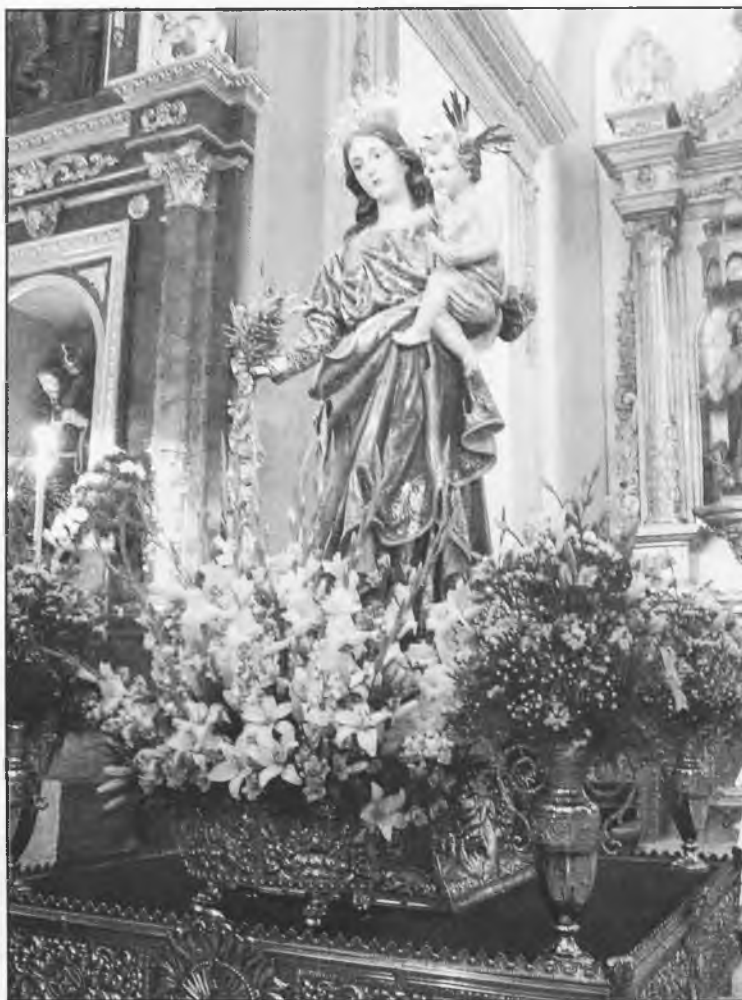
Virgen de la Paz

- También he visto yo en el antiguo archivo de Santa María, un recibo sobre el entierro del varón de Eroles, un famoso guerrillero de la Guerra de la Independencia, que murió aquí, cuando iba de viaje a