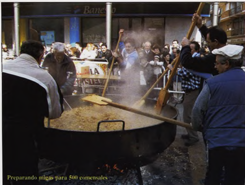
Preparando migas para 500 comensales