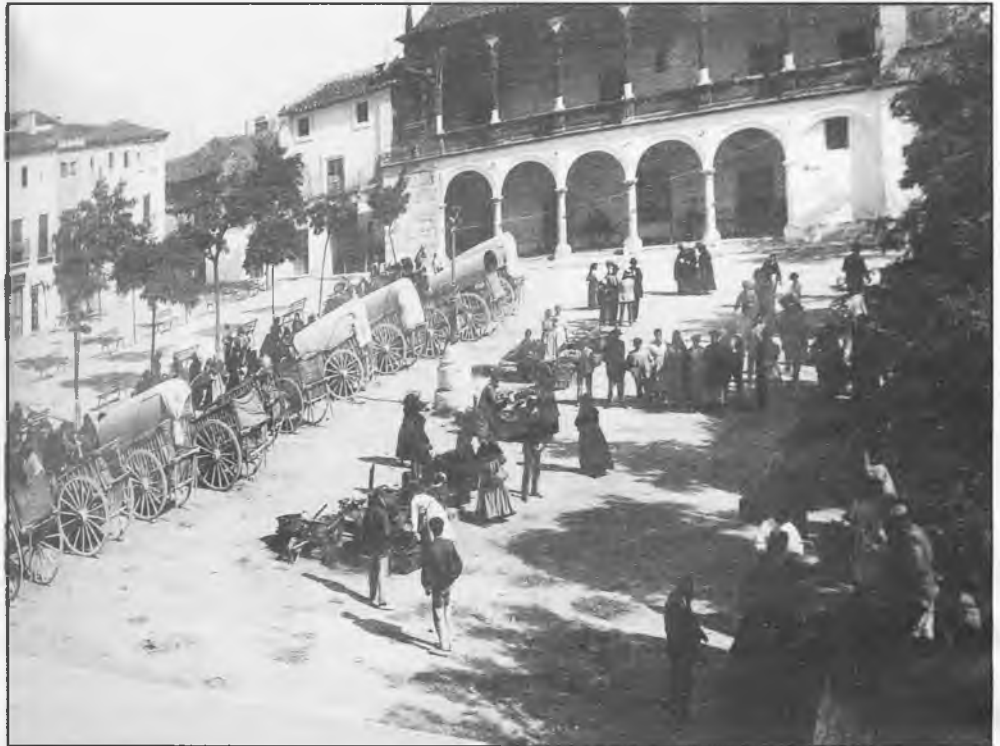
Uno de los cuadros expuesto en la Casa de Cultura

bres, los paisajes y formas de vida en la región durante el siglo XX. Estuvo organizada por la obra social de Caja Castilla La Mancha. La exposición se dividió en cuatro etapas: Pictoralismo, fotografía documental, fotoperiodismo y Postguerra (años 60 y 80).