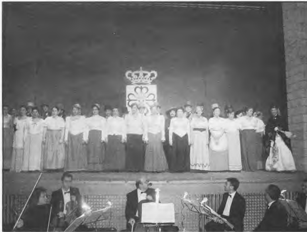
Momento de la presentación de la Zarzuela en el Teatro Ayala

elegido por las Concejalías de Juventud y Deportes para practicar el llamado "deporte blanco". El primer viaje se realizó el 23, 24 y 25 de enero y el segundo está previsto para el 6, 7 y 8 de febrero. Su precio es de 165 euros, e incluye autobús de ida y vuelta además de media pensión.