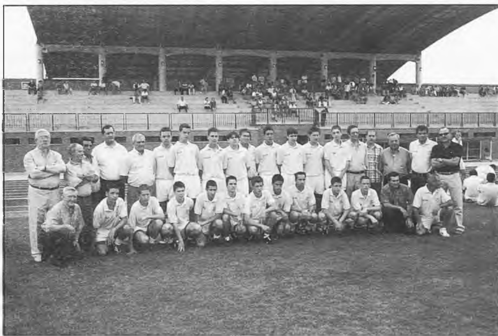
El futbol de Daimiel, está teniendo una buena temporada por lo general