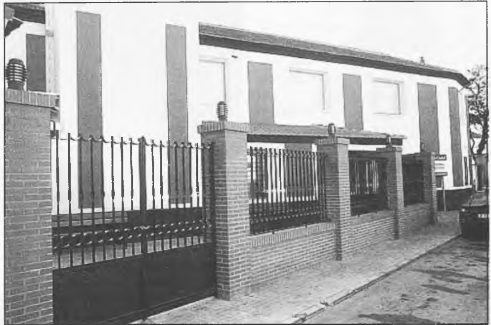
Centro Ocupacional Azuer

Los alumnos del Centro Ocupacional Azuer, por tercer año consecutivo, pusieron en escena una obra de teatro, titulada "Buena, buena, Nochebuena", contando con el apoyo de la Compañía de Teatro Narea, realizándose posteriormente una exposición de los trabajos lle-