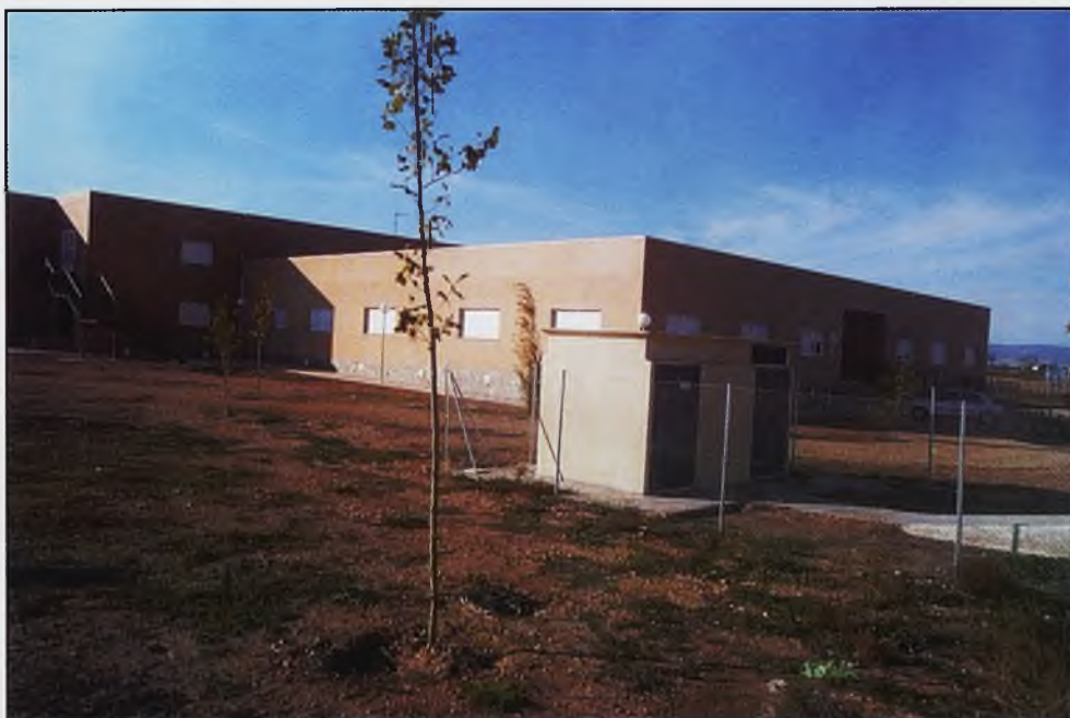
La residencia "Hotel Bahía Blanca", continua cerrada, a pesar de haber sido inaugurada ya.