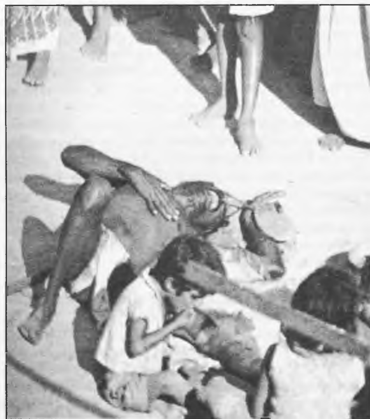
Escenas de hambre, muerte o desolación, podemos verlo en televisión a cualquier hora y en las diferentes cadenas que podamos elegir

prensión y piedad, en la acepción más profana de esta última palabra, cuando, imposible utopía, experimentáramos cualquier dolor, sea físico o psicológico, propio o ajeno, como si fuera nuestro o de nuestros seres más queridos. Imagino que esto, debemos construirlo nosotros, y que de poco nos sirve en estos casos profesar alguna creencia, ser ateo o agnóstico, pues no en vano