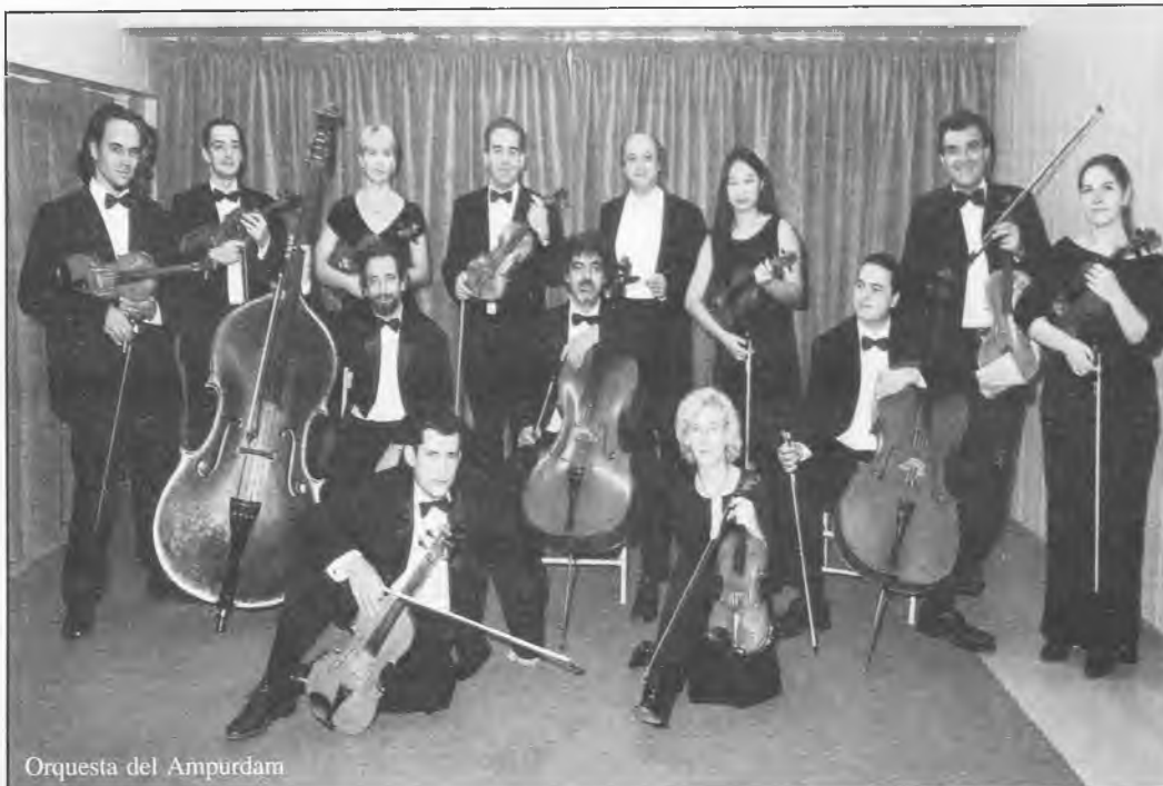
Orquesta del Ampurdan

Muchas actividades están programadas, aunque las fechas no están fijadas, como es el caso del teatro de adultos, con la representación de la obra "La casa de los siete balcones", de Casanova.