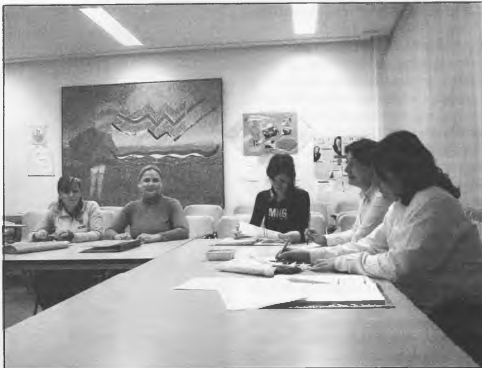
Curso de “Técnicas de mejora en la comunicación, gestión y motivación empresarial”