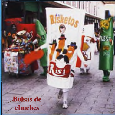
Bolsas de chuches