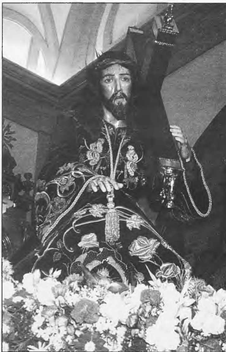
Pronto podremos ver la imagen de Jesús de Nazareno y todas las demás, por las calles daimieleñas

Con la llegada de la Cuaresma se inician los preparativos para la celebración de las Semana Mayor daimieleña: salen