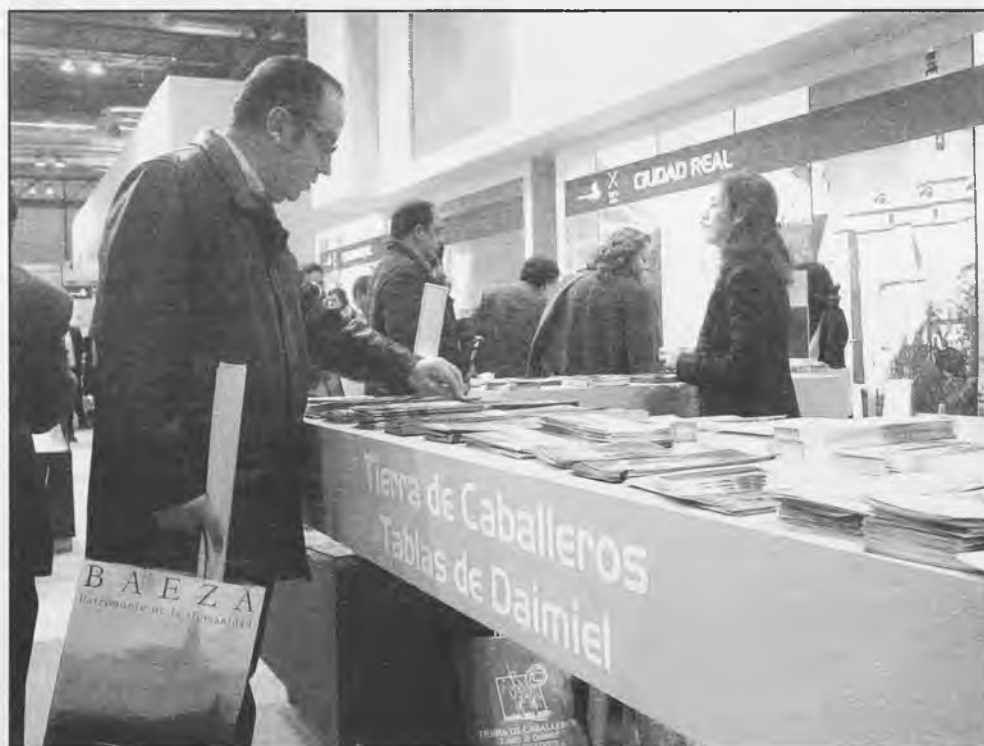
Daimiel asistió un año más a la ya famosa Feria Internacional de Turismo (FITUR)