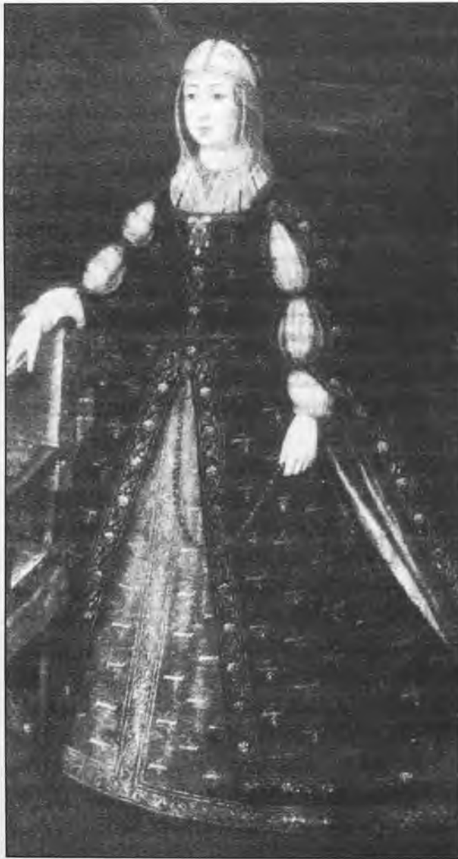
Isabel la Católica

Concilio de Beziere, en donde a modo del Evangelio, se indicaba que, "primero se aplique el aceite y el vino a las llagas del herido". Pero, dado que las rebeliones de los tolosanos prosiguieron, Gregorio IX, en 1231, quita la jurisdicción a los Obispos, que juzgaban a los herejes y se la da a los dominicos y Gualterio de Marnís, obispo de Tournay, nombra dos inquisidores en