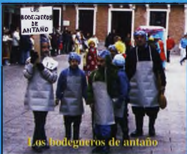
Los bodegueros de antaño