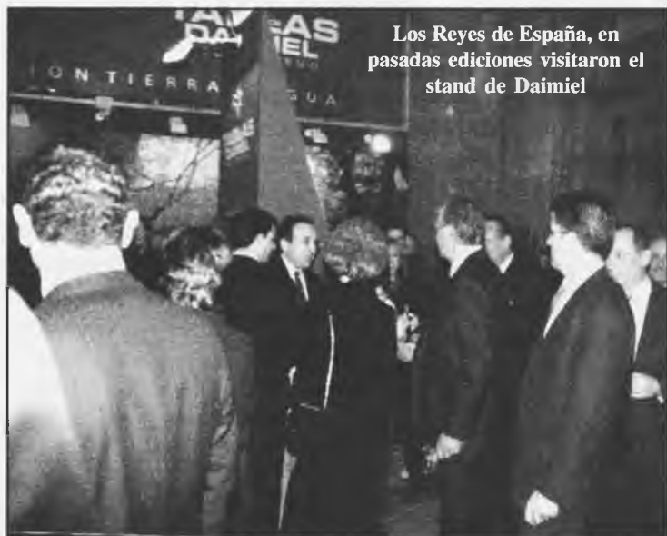
Los Reyes de España, en pasadas ediciones visitaron el stand de Daimiel

Como sabe el lector, a finales del pasado mes de enero, se celebró en Madrid la XXIV edición de la Feria Internacional de Turismo (FITUR) con la asistencia de los Reyes de España y del presidente de la República Argentina don Néctor Kirchner, acompañados por autoridades españolas y representantes de ciento setenta países. Han participado once mil empresas y la afluencia de personas, primero de profesionales y después de público ha sido masiva.