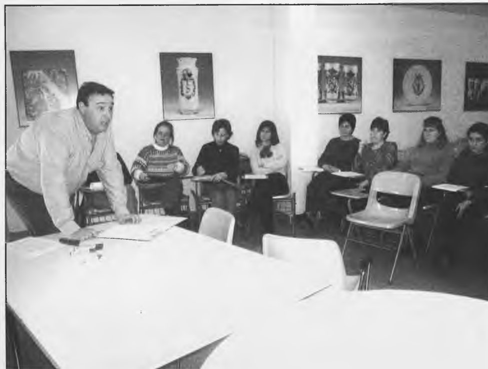
Escuela de Padres y Madres del año 2003

de vida de los padres y madres con hijos con discapacidad, el área psicológica del Centro de la Mujer, tras el éxito obtenido con la escuela de padres y madres, ha creado la “Escuela de padres y madres de chicos y chicas con discapacidad”, surgiendo este proyecto por la gran demanda de familias con hijos e hijas con una problemática determinada ya que en ocasiones se sien-