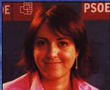
Cristina Maestre Candidata al Senado (Pág. 9-10)