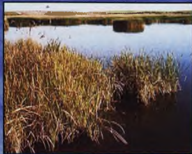
Mariano Rajoy Visitó Las Tablas de Daimiel (Pág. 6)