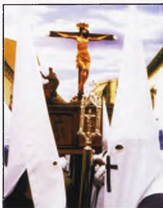
Presentado el Cartel de la Semana Santa 2004 (Pág. 12)