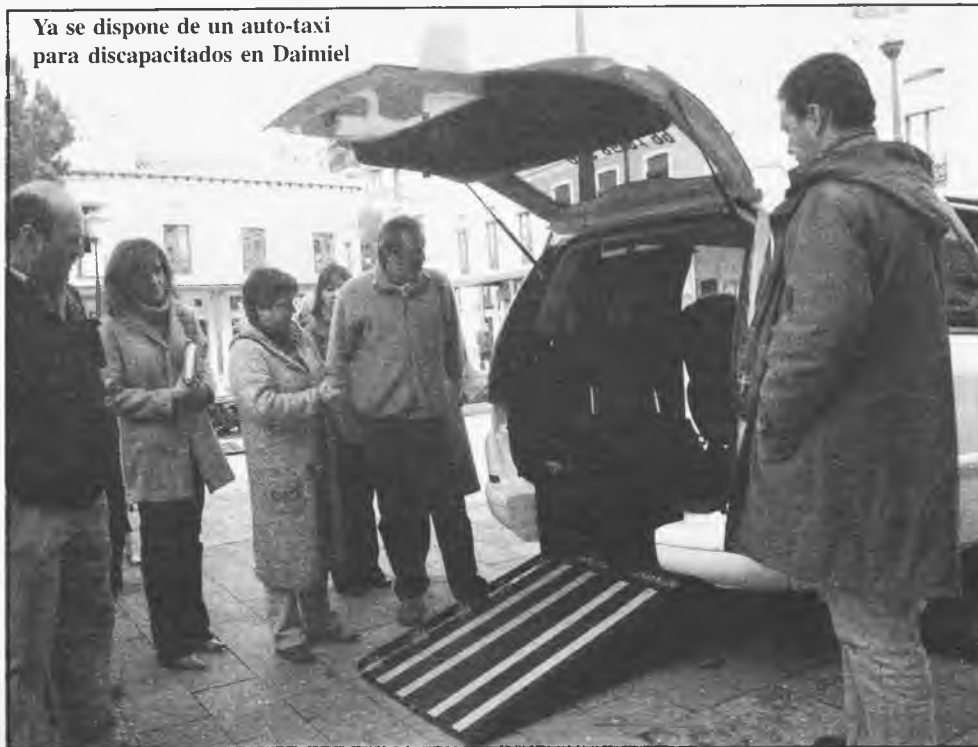
Ya se dispone de un auto-taxi para discapacitados en Daimiel

- Nuestro director, ha sido nombrado miembro de la Academia de las Ciencias y de las Artes de TV; y también nombrado miembro de la Cofradía Internacional de Investigadores, ubicada en el Ayuntamiento de Toledo. Parece que suena por ahí y por eso lo buscan para tantos comeditos culturales.