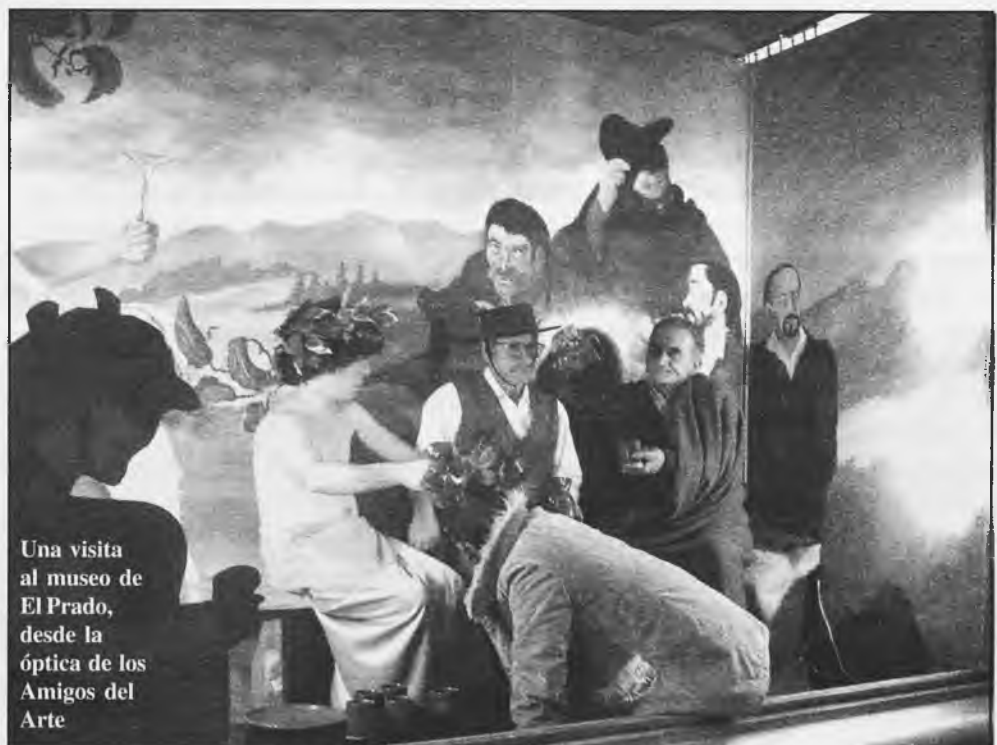
Una visita al museo de El Prado, desde la óptica de los Amigos del Arte

En la escuela se aprendían las oraciones en clase de Religión y las más largas eran más difíciles. Pues un día se me llegó un pequeñín muy contento a decirme: "Ya me sé el Cerdo "