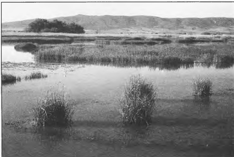
Ya se han mandado al Parque Nacional de las Tablas, 15 hectómetros cúbicos de agua

Hay que recordar que fue en el año 1982 cuando los Ojos del Guadiana dejaron de llorar por última vez, era la señal para que se hubiera puesto fin al deterioro que suponía para