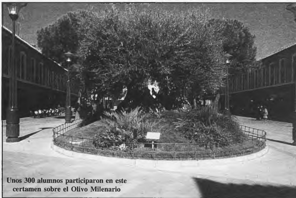
Unos 300 alumnos participaron en este certamen sobre el Olivo Milenario

los artistas protagonistas del acto. Unos 300 alumnos, de los últimos cursos de Educación Primaria, ocuparon los alrededores del olivo; y era curioso ver las posturas originales de los pintores, que habían recibido el material preciso y como premio general, una camiseta alusiva, que fue donada por la Obra Social de la Caja de Castilla La Mancha, que patrocinaba el concurso. Luego una "cata", es decir, pan untado de aceite y azúcar o sal. Al día siguiente, se les hizo un obsequio simbólico.