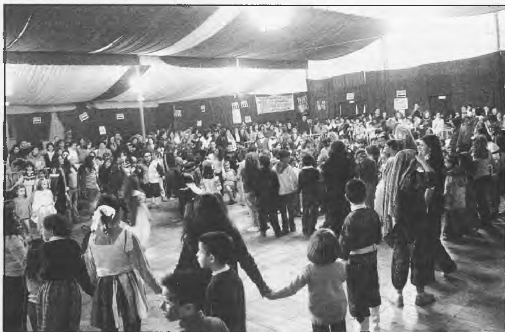
El pasado lunes de Carnaval, muchos niños pudieron disfrutar de bailes y juegos en la Carpa Municipal

La sala permanecerá abierta los miércoles y jueves para niños de 9 a 14 años de 16,00 a 17,30 horas. Los viernes se proyectará una película, cuyo título dependerá de la elección de ellos mismos.