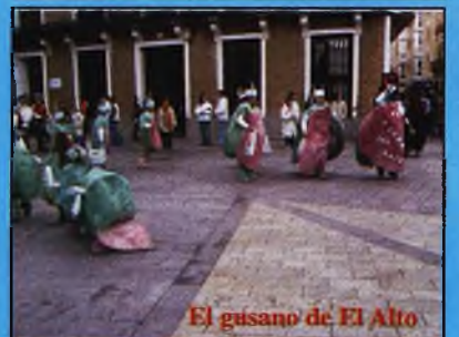
El gusano de El Alto