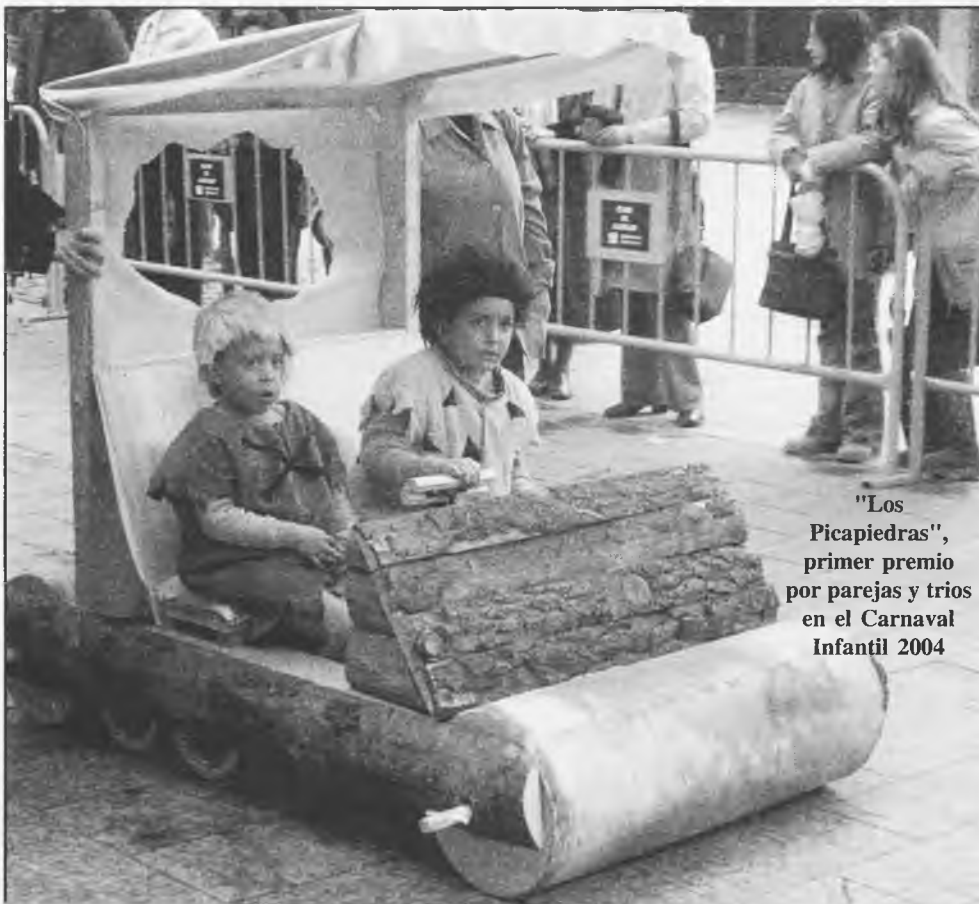
"Los Picapiedras", primer premio por parejas y trios en el Carnaval Infantil 2004

ban. Los premios fueron: el primero a: "Los Amigos en Bora Bora" de los Amigos de Tomelloso; 2º "Paseo por la Edad Media", de la Blanca Doble de Almagro; 3º, "1812, Viva la peña", de La Escacharrá, de Almagro; 4º, "Del trópico al circo" de la cultural el Tambor de Ventas de Peña Aguilera; 5º, "La cigarra y la hormiga", de los Ojonudos de Valdepeñas; 6º, "La cocina viviente y todos los ingredientes", de "Los echaos pa'lante de Manzanares; 7º, Surgudos del Cosmo", de Asociación la Planeca de Polán; 8º, "El mar en carnaval", de Vecinos la Verdad de Tomelloso; 9º, "Los segadores y espigadores" de Tercera Edad de Villarrubia de los Ojos; 10º, "Lo que el viento se llevó", de Amas de Casa de Villarrubia de los Ojos; 11º, "Si recortas, no te cortes", de Peña Alpiltraque Fresquito de Valdepeñas; 12º, "Los chuches del Quijote", de la Peña el Quijote de Almagro. Y el jurado calificador acordó conceder un accésit con 100 euros a las peñas: Cultural los Cascabeles de Urda, Peña Alcatús, de Villalta, Peña Los Legales, de las Labores y Los Formalitos de Consuegra. Los premios a las peñas, que antes comento, se premiaron con largueza: desde 1.800 euros p'abajo.