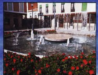
Aprobado Proyecto Para un Parking Cercano a la Plaza (Pág. 12)