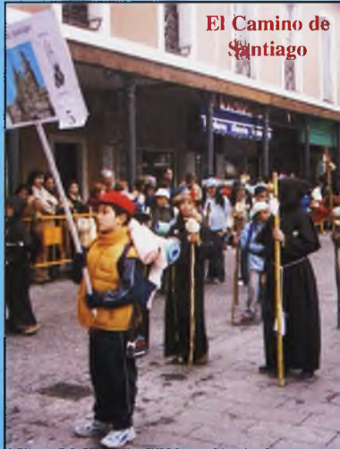
El Camino de Santiago