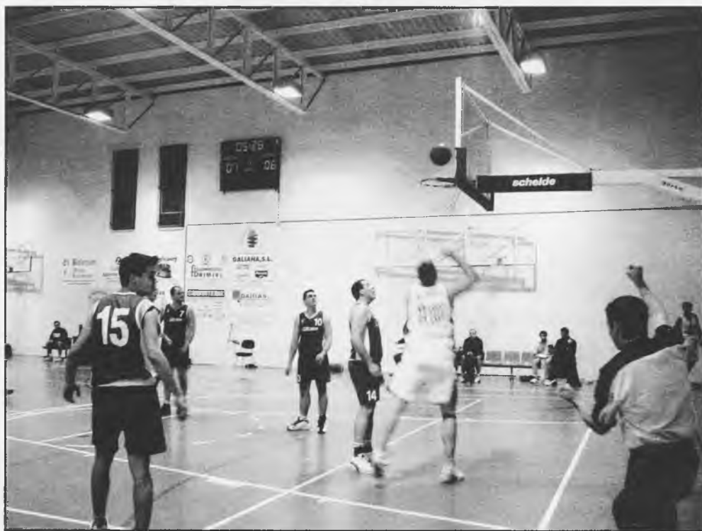
Esperemos que el Gar-Sanchez y Daygas se recupere pronto y siga sumando puntos