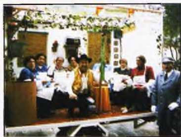
Taller de costura y bordado, primer premio de grupos en el Día del Río