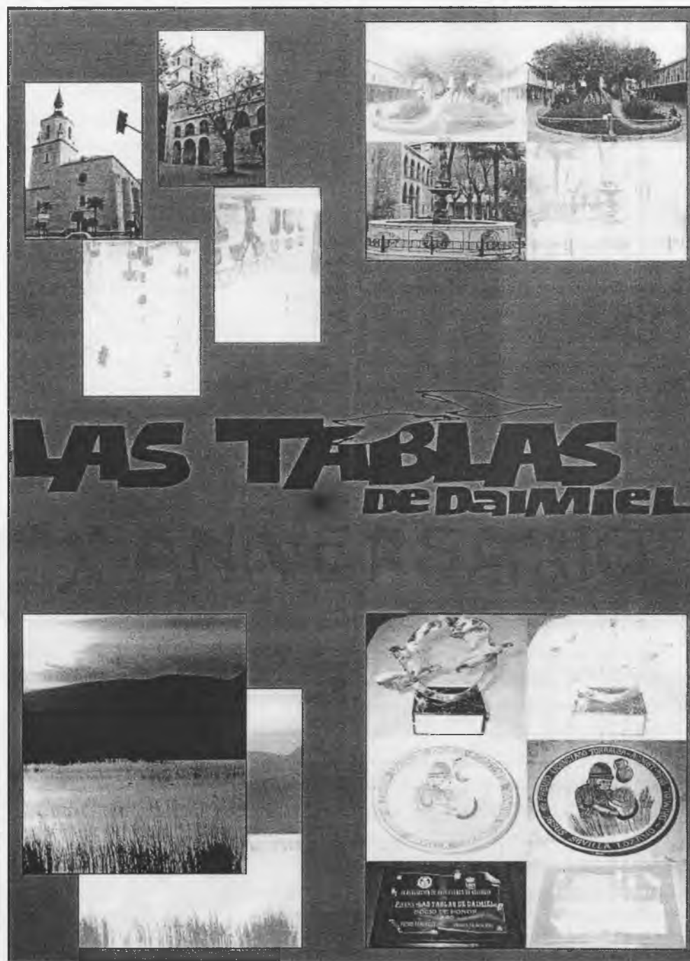
Portada del número extraordinario con motivo del X aniversario de nuestra publicación