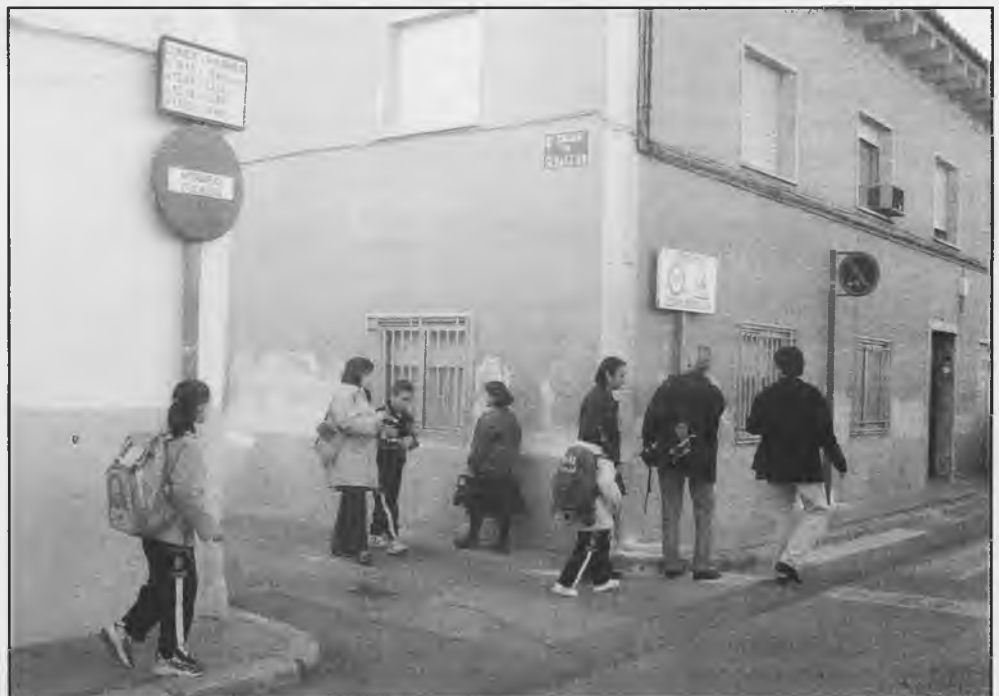
La indicación de los horarios de entrada y salida del colegio, tiene una altura excesivamente elevada.

¿Por qué no se reparan y adecantan las Capillas del Camino de las Cruces que regalara Vicente Carranza y que algunas están en muy mal estado de conservación?