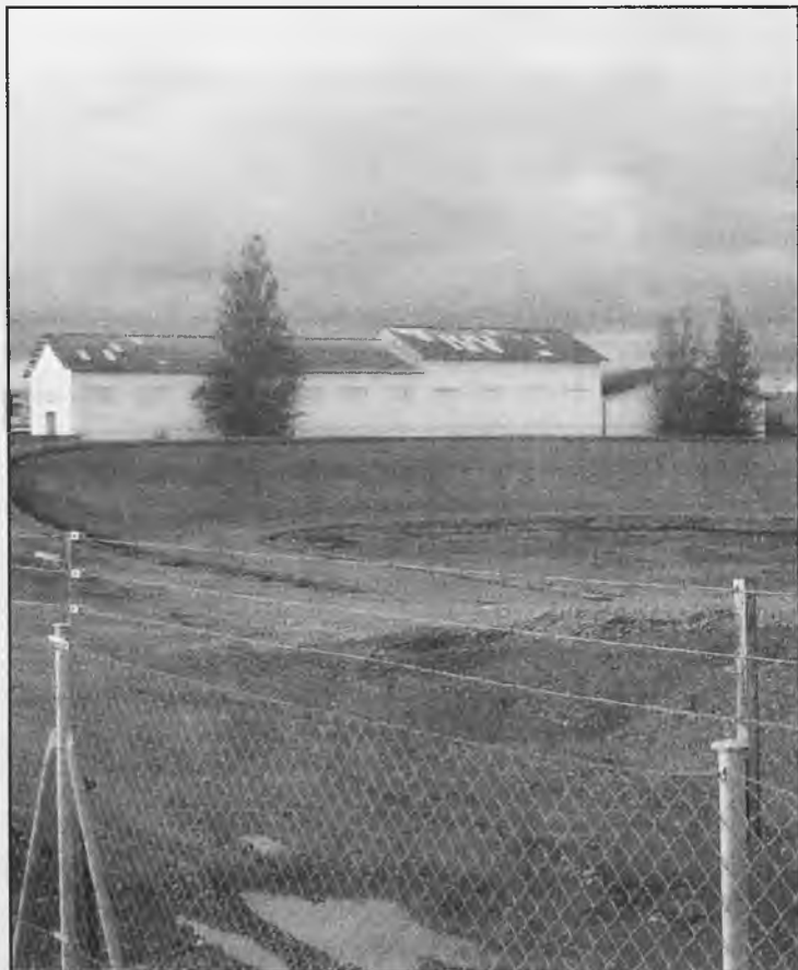
Vista parcial del actual estado del Velódromo