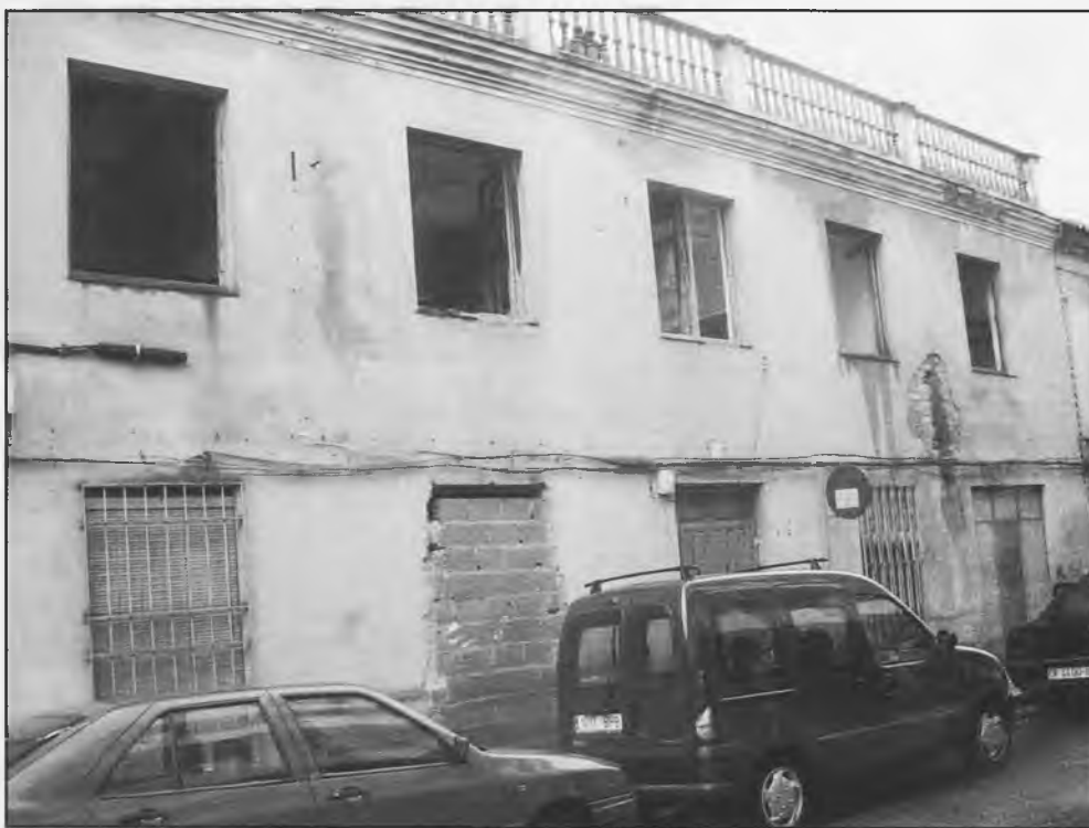
Casa situada en la calle Mendez Núñez

Pero, 'hay! no podemos olvidar que al no estar incluido en el catálogo de bienes culturales, por la Corporación, hará cinco o