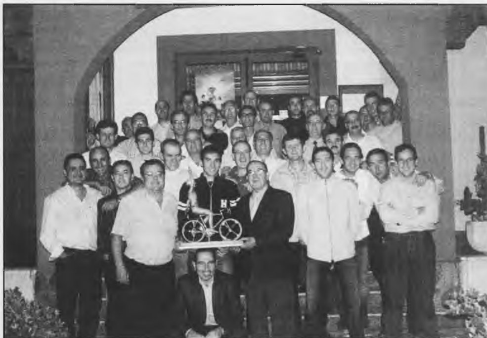
Miembros de la Peña Ciclista "José Antonio Pecharromán"