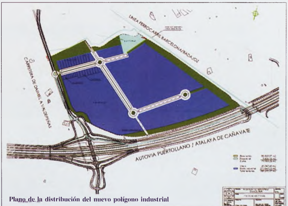
Plano de la distribución del nuevo polígono industrial