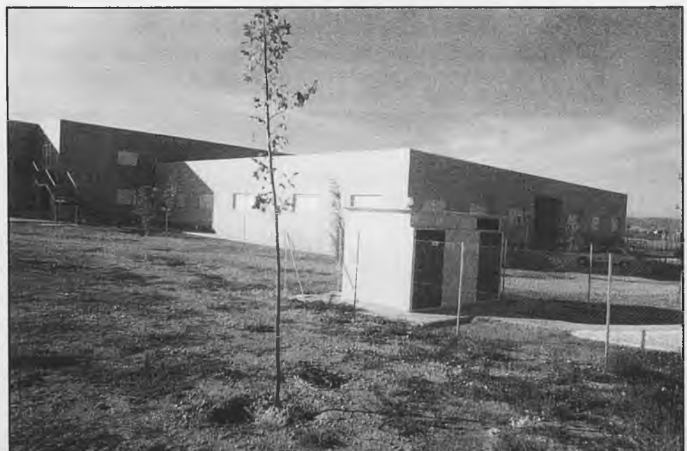
Residencia Hotel Club Blanco.