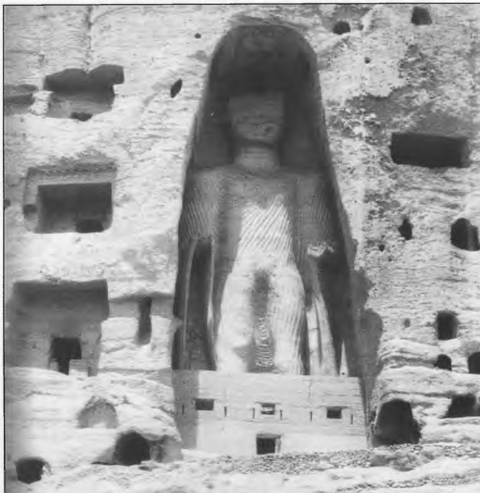
En la imagen, uno de los maravillosos y colosales Budas del Valle de Bamiyan en Afganistán, patrimonio de la humanidad, destruidos a base de dinamita y morteros por la sinrazón fundamentalista talibán en marzo de 2001

tienen ningún tipo de formación religiosa y menos de calidad humana, pero con un elevado exceso de ineducación, intransigencia, chulería, soberbia, prepotencia, y paranoia dictatorial sobrevenida y acentuada al sentarse en el sillón de mando, y por perpetuarse en él sin ninguna clase de limitación, pudor o freno fuera de lo común y de lo medianamente aceptable y soportable; y por si fuera poco, carentes incluso de lo más esencial en un católico que se califique como tal, esto es, caridad, servicio, prudencia, amor al prójimo y humildad; “espantando”, para rematar su faena, a los pocos sensatos que, sacrificando su tiempo y ocupaciones, desean poner lo mejor de sí mismos, hasta que decepcionados, optan por retirarse cansados de tantos desprecios e ingratitudes. ¡Y todavía tenemos el cinismo de condenar a los que practican posturas intolerantes en otros ámbitos!. Pero, ¡hasta donde vamos a llegar en este loco mundo! Por favor, seamos sensatos y, sobre todo, verdaderos seres humanos, y pensemos que si algo hay que aniquilar no es al otro porque sea distinto a mí, sino al fundamentalismo que sólo genera odio y mierda.