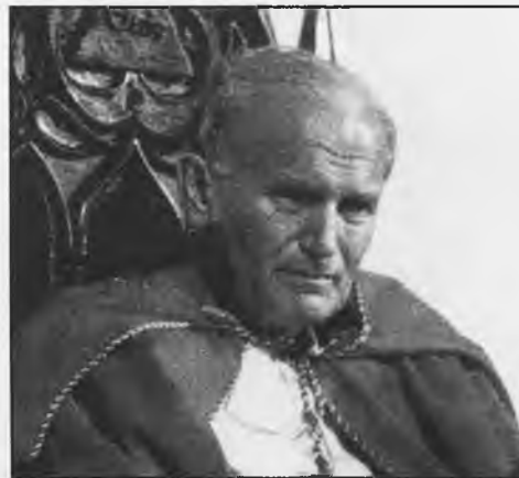
Juan Pablo II

Y he aquí que la Catequesis no es un inicio para comenzar a vivir como Jesús, sino una actividad extraescolar más (nos duele hasta dar un donativo y comprar un libro, o sea, más o menos una ronda de cañas en el bar), un rollo que hay que cumplir hasta que mi hijo o hija reciba la Primera Comuni3n y al año siguiente, si te he visto no me acuerdo, porque “habiendo inglés o fútbol” no podemos “perder el