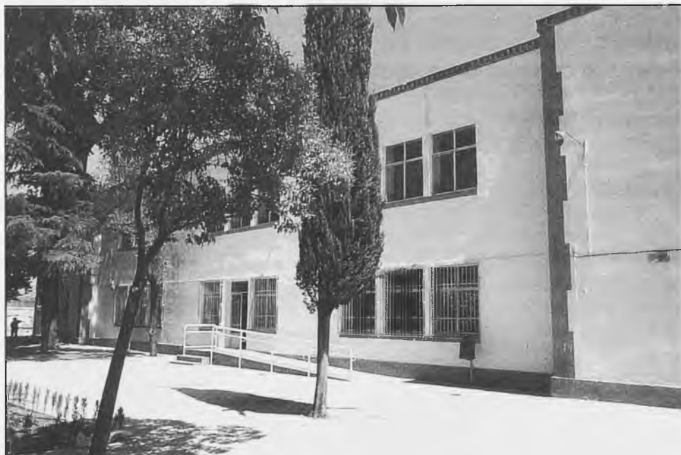
Colegio Público San Isidro

El domingo, 19 de octubre, no hubo misa del mediodía en San Pedro, pues se concentraron todos los sacerdotes en Santa María, donde el Sr. obispo presidió la misa, con 9 sacerdotes. Se trataba de celebrar la "Misa de Envío" (enviar obreros a recoger la mies), es decir el curso pastoral, el inicio de todas las actividades parroquiales. Actuaron los dos coros conjuntamente. El templo estaba ocupado totalmente.