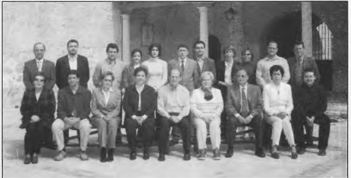
Componentes del Partido Popular de Daimiel

Por cierto, sólo un apunte más. La Virgen del Carmen, tal y como emitimos desde TeleDaimiel, ha estado olvidada durante meses, entre escombros, contenedores de basura y material de construcción, como rezan las fotografías que se hicieron "in situ" y están a su entera disposición. Seguro que algún lector de "Las