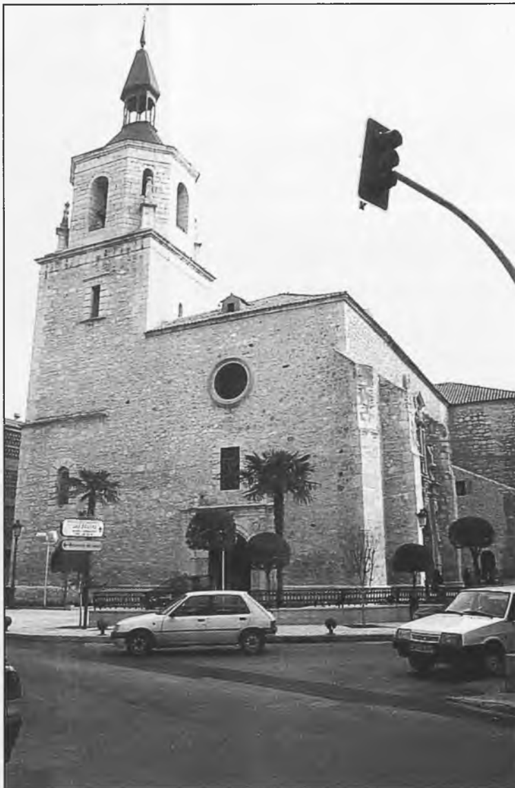
La iglesia de San Pedro, está incluida en los bienes de interés cultural de Daimiel

- La huelga de los guías de Las Tablas, que demandan se les asigne la categoría a