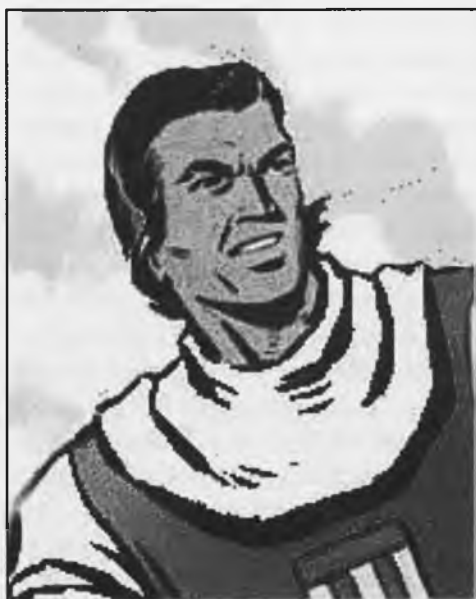
El Capitán Trueno, uno de los comic más leídos en España