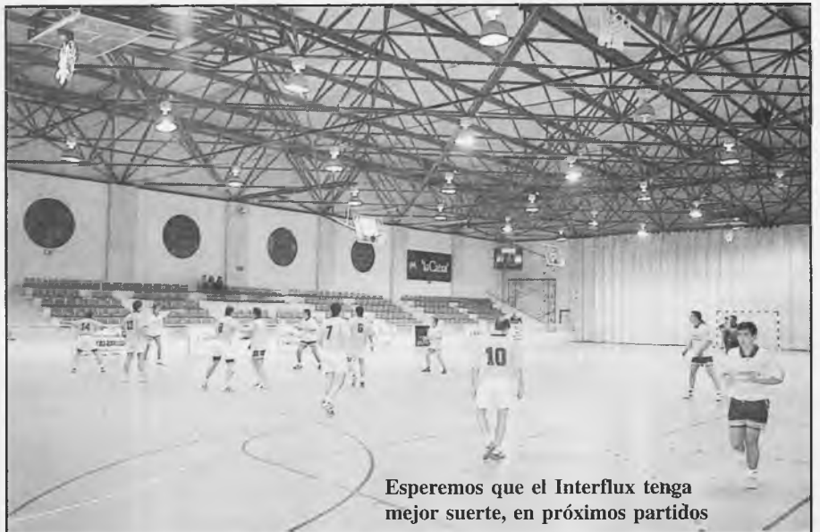
Esperemos que el Interflux tenga mejor suerte, en próximos partidos

No tuvo suerte el conjunto de balonmano de nuestra localidad en el primer partido de Liga, ya que jugó con el campeón de la temporada pasada, el Balonmano Toledo, todo un señor equipo, y que este año va a intentar de nuevo repetir la hazaña del año pasado. Los toledanos fueron muy superiores ganando, en todo terreno, al conjunto Interflux de Daimiel. Desde el comienzo del encuentro, los toledanos salieron muy mentalizados para ganar el partido y hacerlo con bastantes goles, para de esta forma ir cogiendo el pulso a la competición y colocarse en los primeros puestos de la clasificación general. Los representantes daimieleños pusieron ilusión, pero enseguida vieron lo que les venía encima, el resultado al final del partido fue de 4-33. El Interflux mantiene los mismo jugadores del año pasado, no han reforzado con nadie, y se espera que sea un año, como el anterior, de sufrimiento.