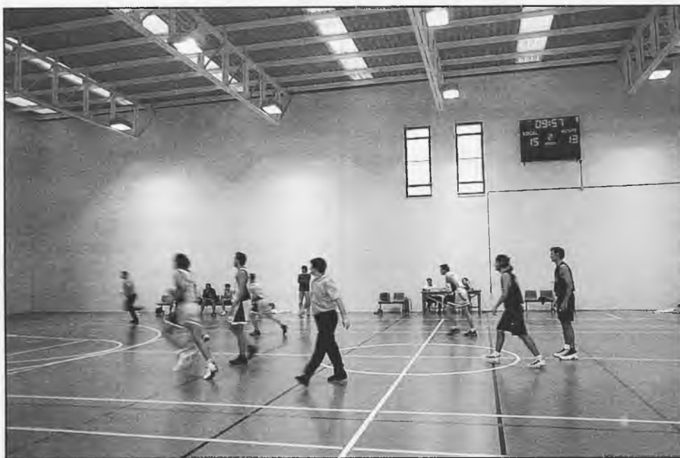
Buen comienzo para el baloncesto daimieleño