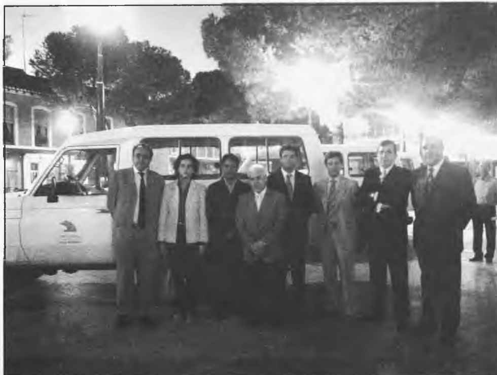
Se han donado 4 ambulancias todo-terreno para el pueblo saharauí

- La Asociación de Discapacitados COCENFE-Oretania de la provincia, ha dado fin a un curso de cinco meses, para que 15 alumnos discapacitados, adquieran el carnet de conducir. Eran de Ciudad Real, Puertollano, Valdepeñas, Carrizosa, Almagro y Daimiel. Han obtenido la capacitación, cuatro de ellos y otros siete, aprobaron el examen teórico. Para realizar las prácticas, la Federación posee dos coches adaptados a las facultades de los alumnos, con doble mando alumno-profesor. Se ceden los vehículos a las academias del ramo, que no los poseen, pero cursan por ellas algunos discapacitados.