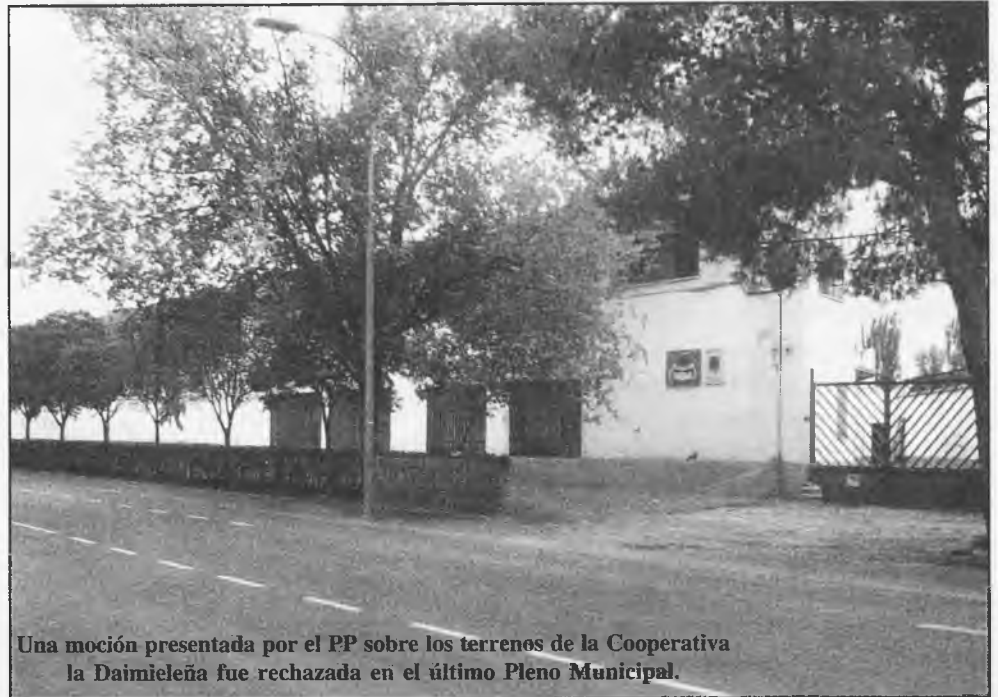
Una moción presentada por el PP sobre los terrenos de la Cooperativa la Daimieleña fue rechazada en el último Pleno Municipal.

Tendrá una capacidad de noventa y nueve residentes y está, según informan, perfectamente equipada. Cuenta con una