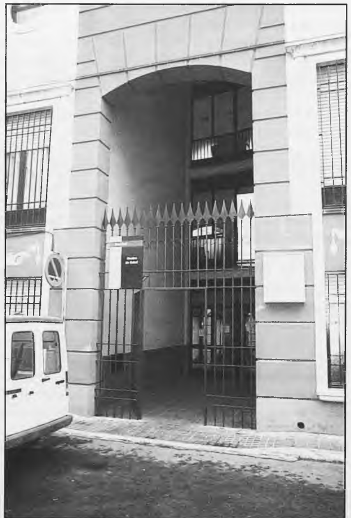
Centro de Salud de Daimiel

Guadalajara que nos envían trasvases, aunque sólo llega una ínfima parte. Y la Primavera tan lluviosa, ha propiciado que