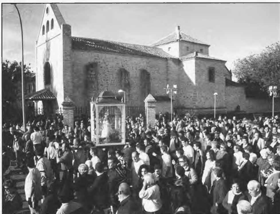
El día 9 de mayo, fue el traslado de nuestra Patrona a Daimiel por los jóvenes daimieleños

que actúa en Zambia, con un padecimiento en su "andadura", de lo que se está tratando. Y es que en su lugar de trabajo, no hay médicos ni quien le pueda ayudar en eso. Así está mas tiempo con su familia.