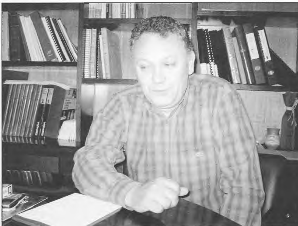
El nuevo alcalde, manifiesta sentirse muy arropado por las bases de su partido y sus conciudadanos.

He llegado a la Alcaldía con los votos del grupo municipal socialista, de igual modo que mi antecesor. Soy alcalde porque los concejales del Pleno me votaron mayoritariamente, por tanto, no hay puerta de atrás. Aunque no era cabeza de lista en las últimas elecciones, yo estaba en ella