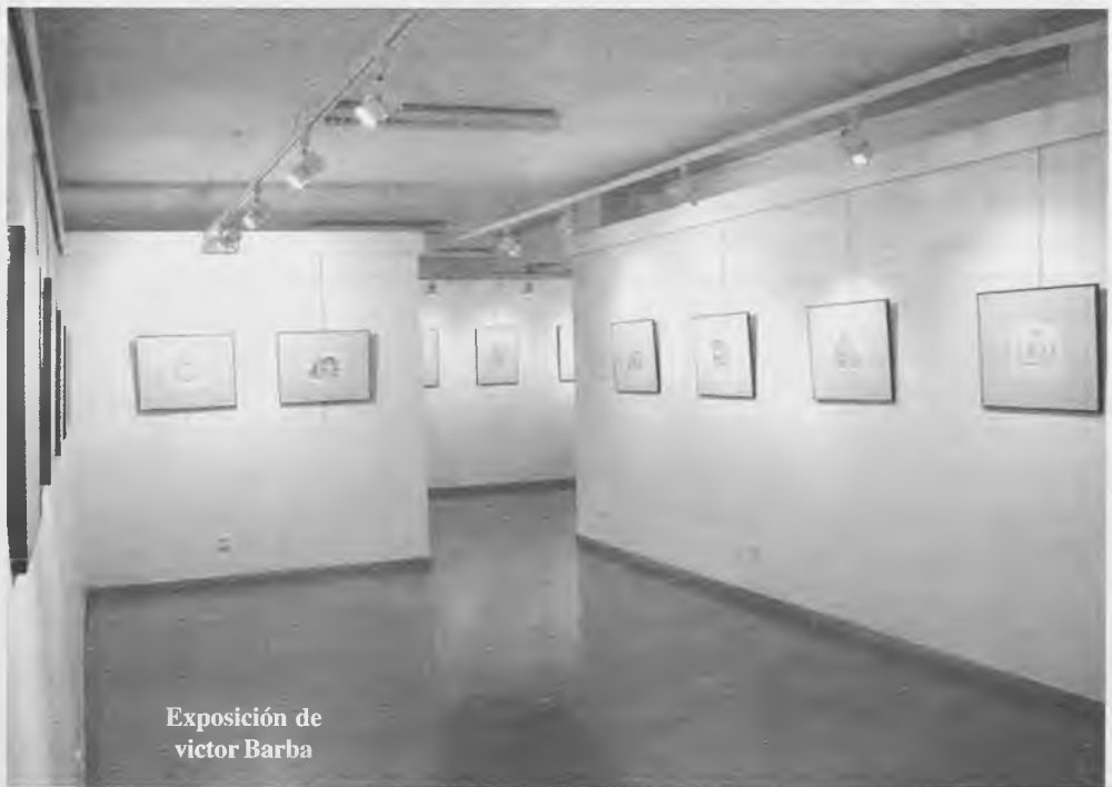
Exposición de victor Barba