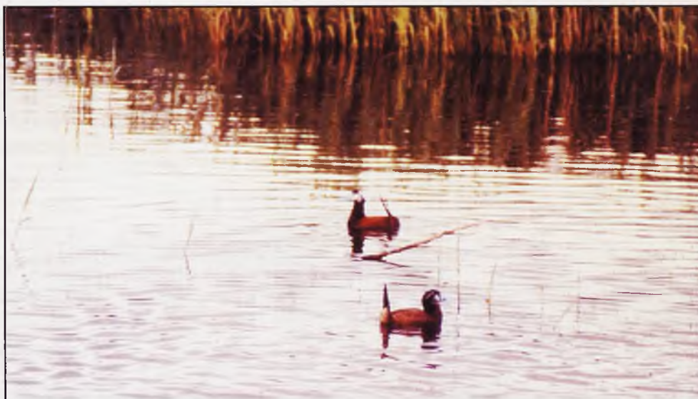
Pareja de Malvasías, especie que se encuentra en peligro de extinción.