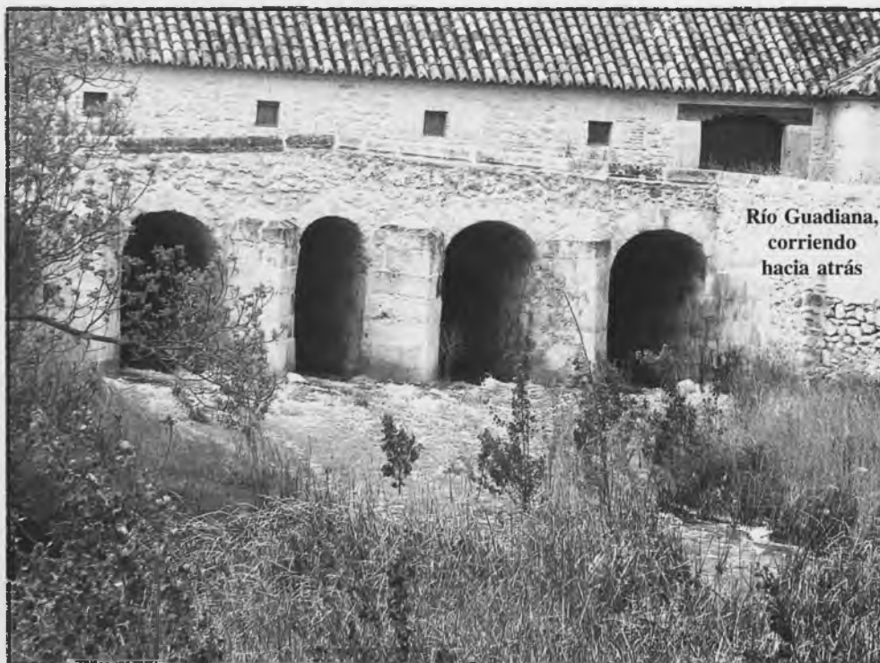
Río Guadiana, corriendo hacia atrás

Se encuentra en estos días en "estado momentáneo de gracia". La presa de Puente Navarro está vertiendo agua al cauce, seco ya varios años, del malogrado Guadiana. La entrada de agua del Gigüela, junto con la recientemente recibida del Trasvase, ha logrado colmar provisionalmente de agua todo el vaso del humedal. Si quieren darse un paseo por el puente de Molemocho, verán algo inaudito: CORRER EL GUADIANA AGUAS ARRIBA .. La presa que divide Las Tablas al remansar las abundantes - por poco tiempo- aguas actuales, origina "la vuelta atrás" comentada.