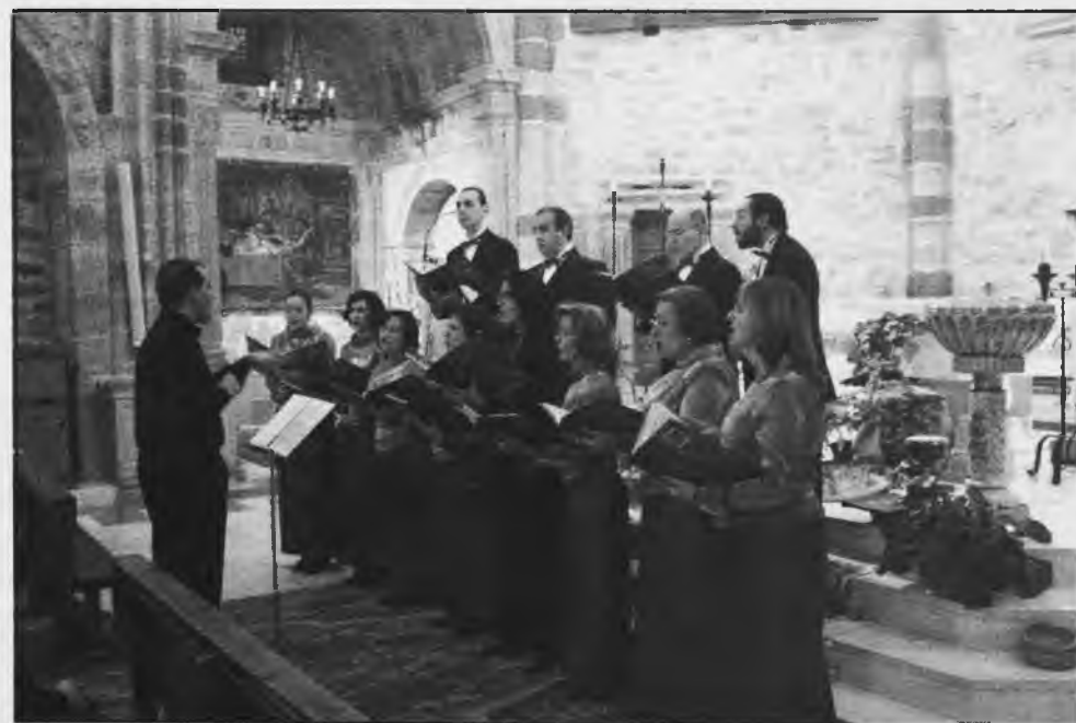
Coro de Cámara Laminium, en su actuación en la iglesia de Santa María

En el Teatro Ayala de Daimiel se celebró la II Gala Local de la Escuela Municipal de Música y Danza festejando el Día Internacional de la Danza; alumnos y profesores de la escuela interpretaron "En-