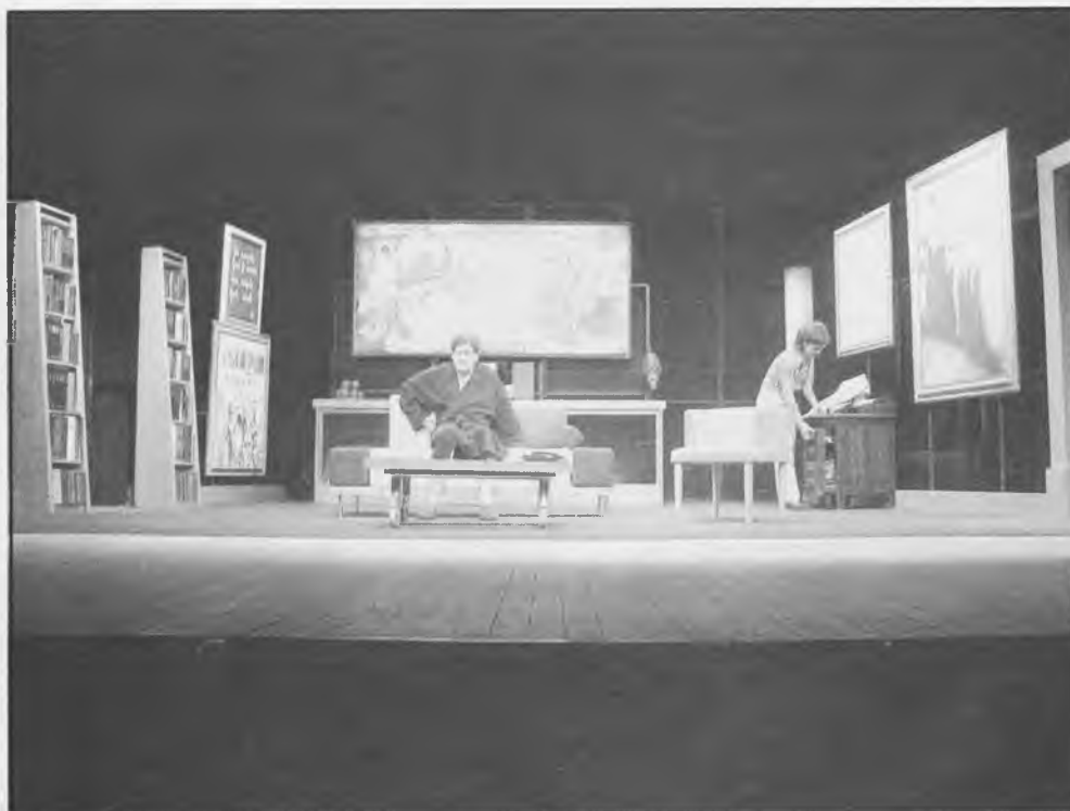
Representación de la obra "La Cena de los Idiotas"