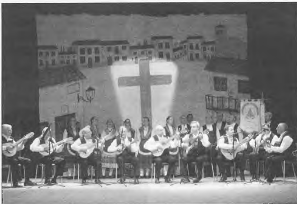
XVI Certámen de Mayos Manchegos, celebrado en el Teatro Ayala

A primeros de mayo, la asociación de familiares de enfermos con demencia senil o el alzheimer, organizó unas