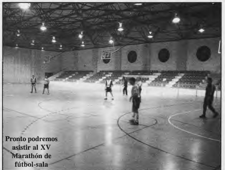
Pronto podremos asistir al XV Marathón de fútbol-sala

La organización no se hará responsable de posibles accidentes que pudieran ocurrir durante este marathón.