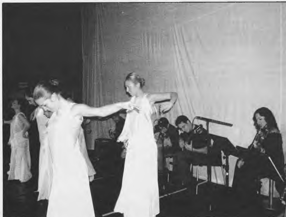
II Gala Local de la Escuela Municipal de Música y Danza

se desarrolló en mayo, con proyecciones semanales todos los miércoles que comenzaron con la proyección de la película "Little Senegal" y continuó con la proyección de "La ciudad tranquila", "Osama", finalizando con "Ciudad de Dios".