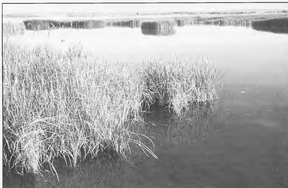
Estas lluvias están haciendo que el Parque de Las Tablas, tenga más hectáreas inundadas