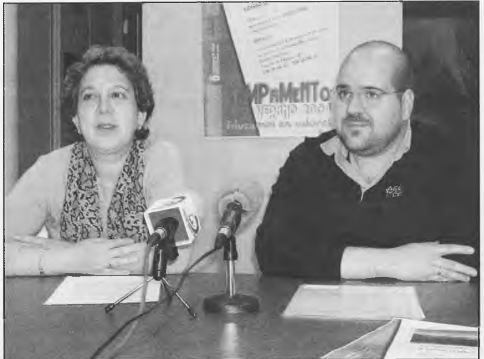
Presentación del Campamento Infantil y Juvenil