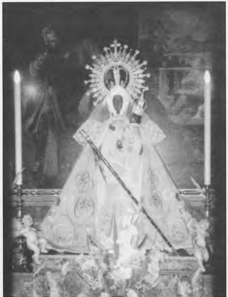
Ntra. Sra. Virgen de las Cruces

Como es habitual, Perfumería SUYA sorteó diversos re-