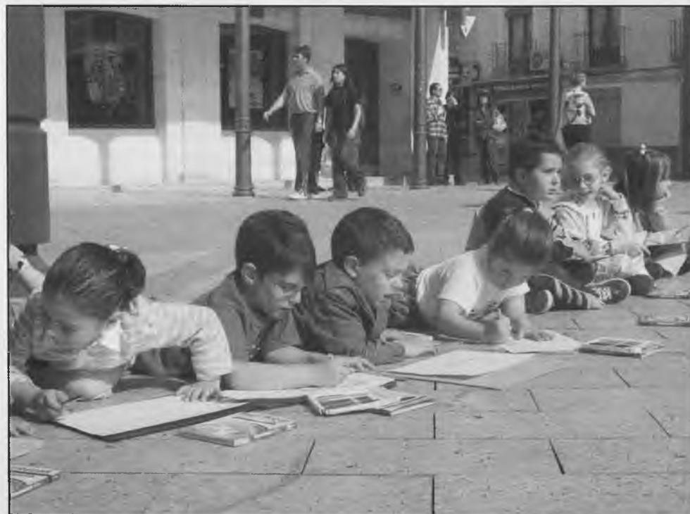
Jóvenes dibujando en el pasado Certámen de Pintura Juan D'Opazo