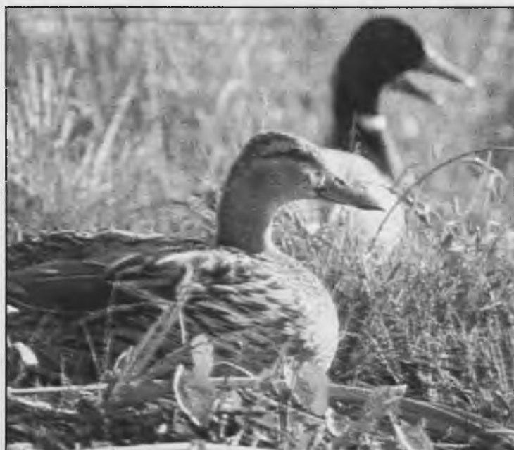
La cacería de patos en "Las Tablas", era un deporte bastante practicado por muchos personajes ilustres y famosos