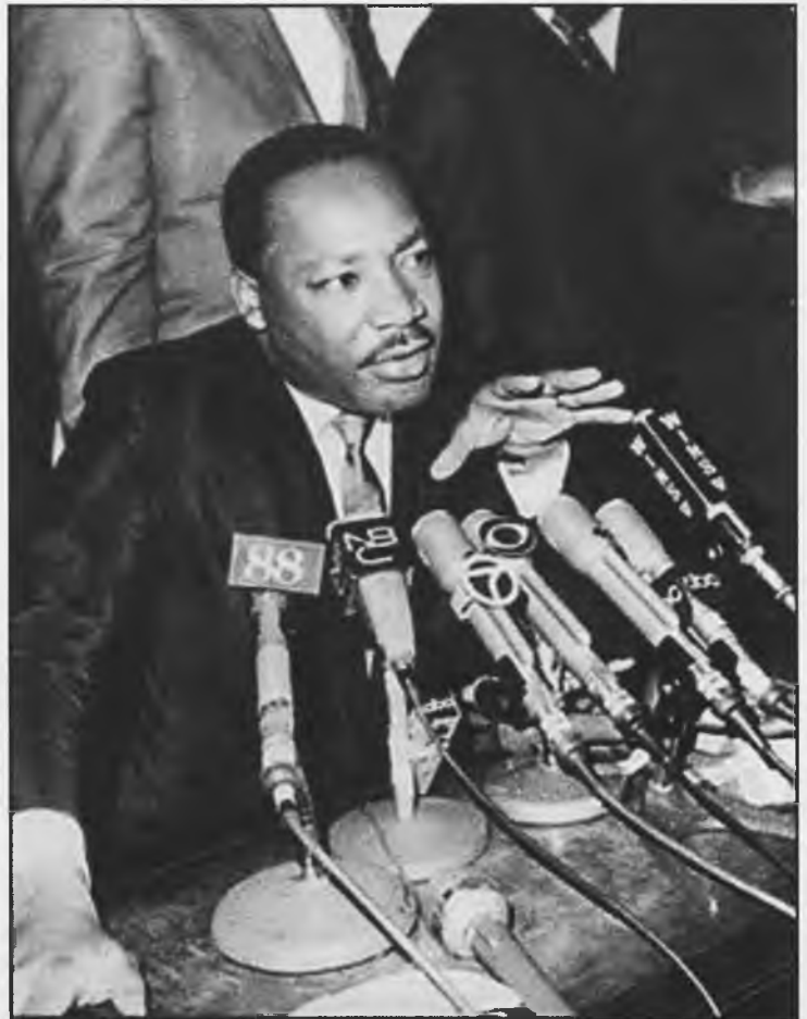
Cuando Martin Luther King (1920-1968), resumió su vida, su lucha y su doctrina con la frase "He tenido un sueño", reflejaba con ella la aspiración suprema de todos los hombres de buena voluntad

Cuando el gran líder pacifista, tristemente asesinado, Martin Luther King regaló al mundo su célebre y legendario discurso en el que resumía la esencia de sus maravillosas enseñanzas doctrinales, y de su no menos asombrosa y valiente vida, lo comenzó con una frase- “He tenido un sueño (I had a dream)” pero eso no debe hacernos creer que ese sueño se tuvo y nunca se realizará, se pensó y nunca se hará realidad, se poseyó y se