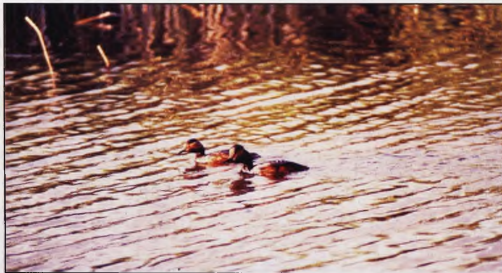
El zampullín cuellilargo también se ha dejado ver por la laguna de Navaseca