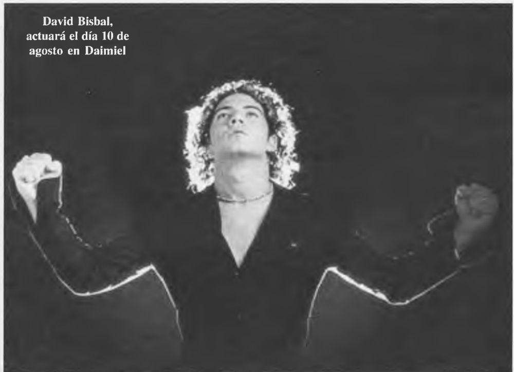
David Bisbal, actuará el día 10 de agosto en Daimiel

También la Asociación de Vecinos del Barrio "El Quijote" mantuvo una Asamblea en el Colegio Público "La Espinosa", dónde trataron, entre otros asuntos, la presentación del Programa de Fiestas 2004, la celebración en el 2005 del IV Centenario del Quijote y el estado de cuentas.