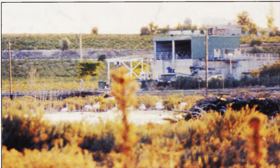
Flamencos junto al edificio de la depuradora