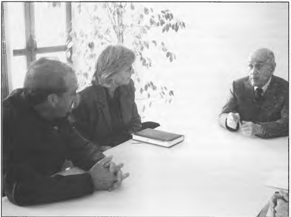
Miguel Fisac visitó Daimiel para dirigir las obras de remodelación del Mercado

en el templo de San Pedro y a la salida de los novios, recibieron una nutrida lluvia de arroz, con pétalos, de forma que la circulación era muy peligrosa, sobre todo para las personas con dificultad para andar. Puede dar lugar a un accidente leve o grave. ¿Pasaría algo si los bromistas barrieran luego la broma? Sería un buen complemento a la broma, ver a los "sembradores" barrer. Pero es que es exigible que lo hagan.