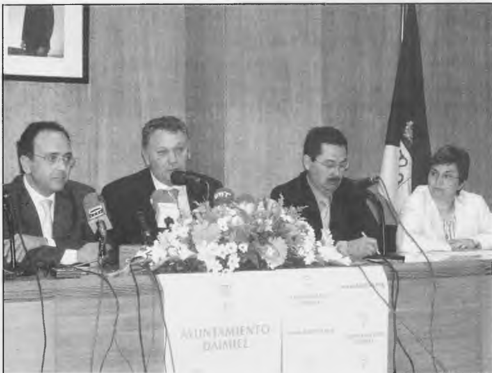
Presentación el pasado día 14 de mayo de la Fiestas del Marisco

Una de las iniciativas que pretende desarrollar la Mancomunidad a través del Plan de Dinamización Turística son las fiestas gastronómicas y el acercamiento con O'Grove se hace con la intención de aprender con el intercambio de experiencias entre instituciones y empresarios del turismo ante una fiesta "ya afianzada y de prestigio reconocido" y que este año