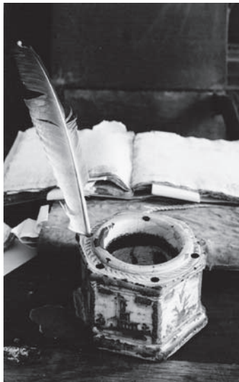
Tintero de Quevedo. Casa-Museo Torre de Juan Abad

Aunque se haya dicho que Camilo padre en sus textos cita pocas veces al hijo, hay un lugar donde habla de él con verdadero afecto dirigiéndose a otro niño, que es el pastorcito del atajo de Brihuega: “Verás: yo tengo un hijo pequeño, mucho más pequeño que tú, que colecciona sonrisas de su madre y cajas de cartón para guardarlas y que no puedan escapársele jamás. Mi hijo dice que, cuando sea mayor, quiere ser mendigo de los caminos, para ver el mundo y para no hacerle daño a nadie nunca: ni a los hombres, ni a los animales, ni a las yerbas del campo, ni al agua de los ríos, ni a las piedras del monte, ni a la cal que cae de las paredes... Es hermoso lo que quiere ser mi hijo cuando crezca, ¿verdad?”. ( Los viejos amigos . Ed. Noguer, 1961).