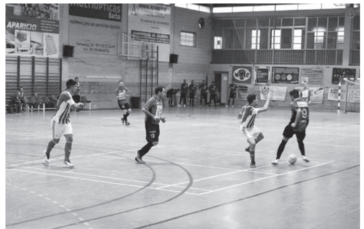
El equipo Panadería Ortiz - Infantes FS en uno de sus encuentros

En categoría juvenil, el equipo canterano del Panadería Ortiz – Infantes F.S. disputó su primer partido de temporada el pasado 7 de Octubre en La Solana donde perdió por 4 a 0.