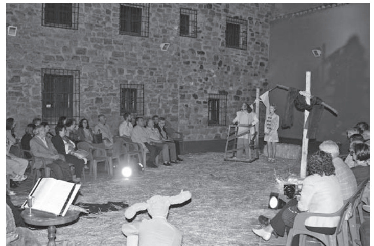
Auto de fe sobre Quevedo en Torre de Juan Abad

Al día siguiente la ruta Torre del Castillo, en Puebla del Príncipe, yacimientos de la Ontavia y Villa Romana del Calvario, en Terrinches, Villa Romana de Puente de la Olmilla en Albaladejo, tramo de la Vía Augusta en Sta. Cruz de los Cañamos para finalizar con la visita al yacimiento de Mentesa Oretana en Villanueva de la Fuente.