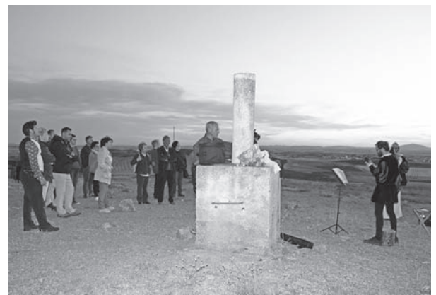
Clausura de Campo de Montiel Abierto en las Cabezas de Fuenllana con Villanueva de los Infantes al fondo