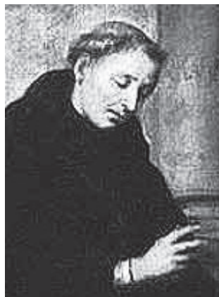
Santo Tomás de Villanueva

Más tarde expone una visión general de las Conciones , de Santo Tomás como predicador, tratando finalmente la presencia de Lutero en las Conciones del Arzobispo de Valencia citando diversos textos de las misma en las que se registra la presencia de Lutero lo que significa que Sto. Tomás conocía perfectamente el tema luterano aunque ignoramos si esa información la tuvo ya siendo agustino, y le vino por comunicaciones de la Orden, o recibía las noticias como arzobispo por la relación con el nuncio y con la curia romana.