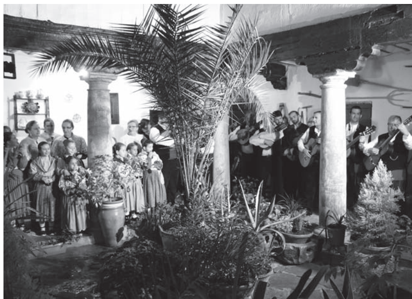
Actuación de la Cruz de Santiago en la Casa de la Pirra