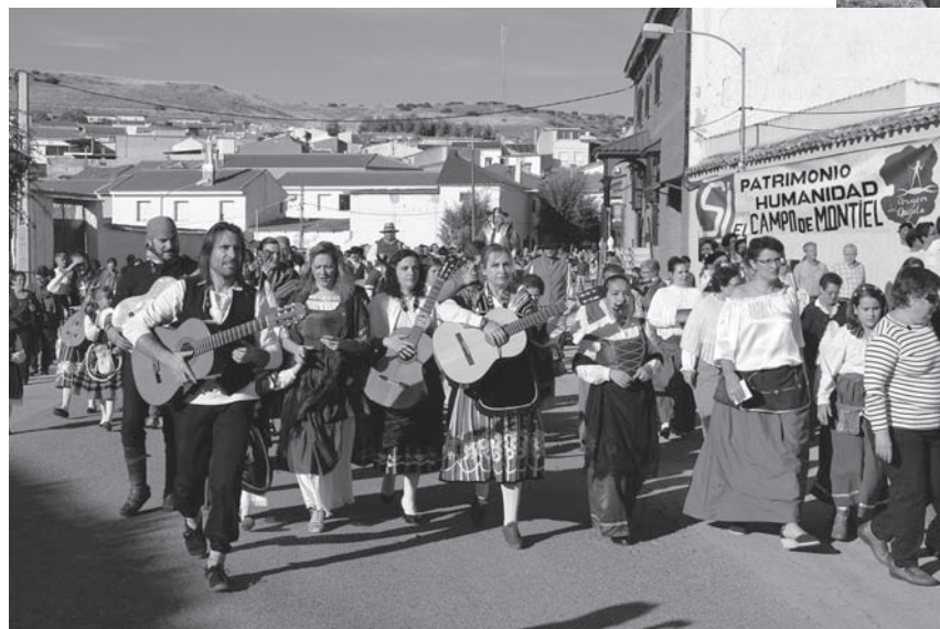
Tornaboda de Basilio y Quiteria con Don Quijote y Sancho en Carrizosa

Otra de las grandes fiestas cervantinas del Programa se celebró en Carrizosa, donde se celebró el regreso Quiteria y Basilio al pueblo de éste y la tornaboda, con representación de los Entremeses "Los habladores" de Cervantes y "Pagar o no pagar" de Lope de Rueda, donde los asistentes disfrutaron de un chocolate con dulces típicos.