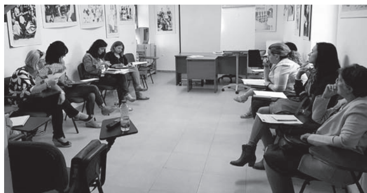
Reunión del Consejo Local de la Mujer

El domingo 16, se celebró la V Marcha Solidaria por la Igualdad, pasando al día 18 la Jornada "Emprender en femenino: un camino a la igualdad". En el marco de esta efeméride se incluyen también los talleres de 'Igualdad de Oportunidades y Prevención de Violencia de Género' y de 'Iniciación a la actividad emprendedora y empresarial' que se van a impartir en el Taller de Empleo de Montiel. También se programó el curso 'Cómo hablar en público', dentro de la convocatoria publicada por el Instituto de la Mujer de CLM.