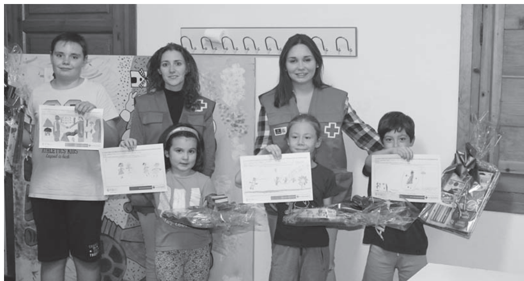
Ganadores del concurso de dibujo acompañados de miembros de Cruz Roja

Desde la Asamblea de Cruz Roja local, situada en la calle Don Tomás el Médico, 48, han señalado que el número de actividades va en aumento por lo que hacen un llamamiento a la población para que participe y colabore como voluntarios, consiguiendo llegar así a más personas. Las personas interesadas pueden contactar en los teléfonos 926 378 118 o 926 312 237.