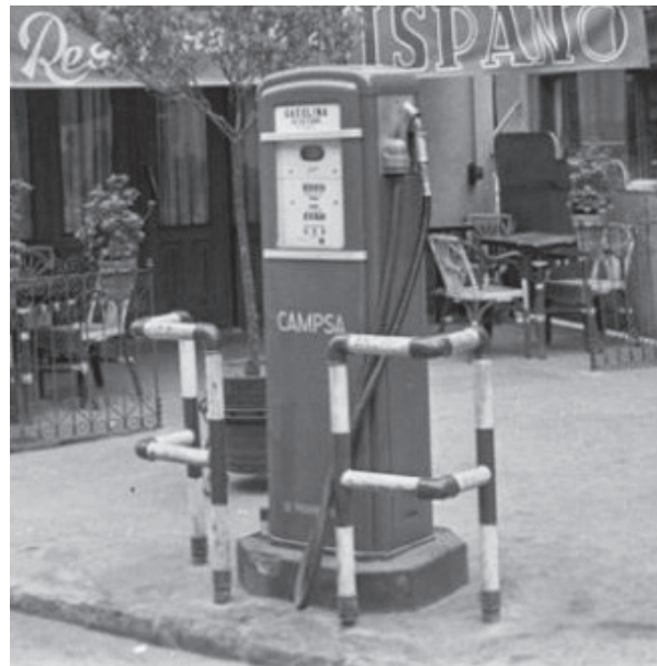
Surtidor de la compañía CAMPSA en los años 60

Interesar a la Eléctrica Centro España, cumplimente lo que se le ordenó por la Jefatura de Industria, en orden a reforzar la línea en varios sectores de la población, Santo Domingo, Frailes y Trinidad, por haber transcurrido el plazo señalado de seis meses para dichos trabajos.