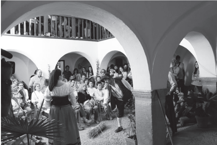
Literatura y escenificaciones en la Ruta de los Patios de La Solana y Villanueva de los Infantes

El miércoles 12, por la tarde, homenaje al pintor Yáñez de la Almedina y el auto de fe sobre Jiménez Patón, finalizando la jornada con el auto final Miguel de Cervantes, en Villanueva de los Infantes, representaciones a cargo del grupo Le Corps D'Ulan.