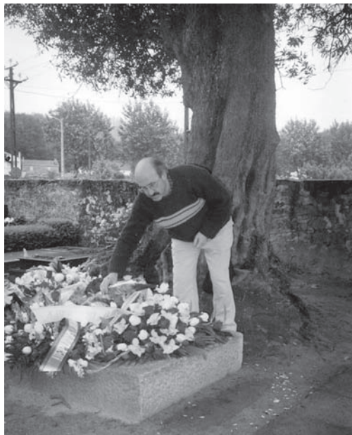
“Mi cuerpo deberá ser cubierto con tierra y sin más piedras que las de la losa” (Disposición testamentaria de Camilo José Cela).