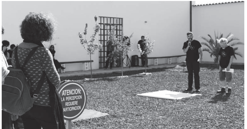
Un momento de la presentación del proyecto "Procesos"

La muestra permanecerá hasta el 30 de noviembre y las visitas pueden concertarse previa cita contactando en el teléfono 926 360 640 o a través del correo contacto@dadosnegros.com.