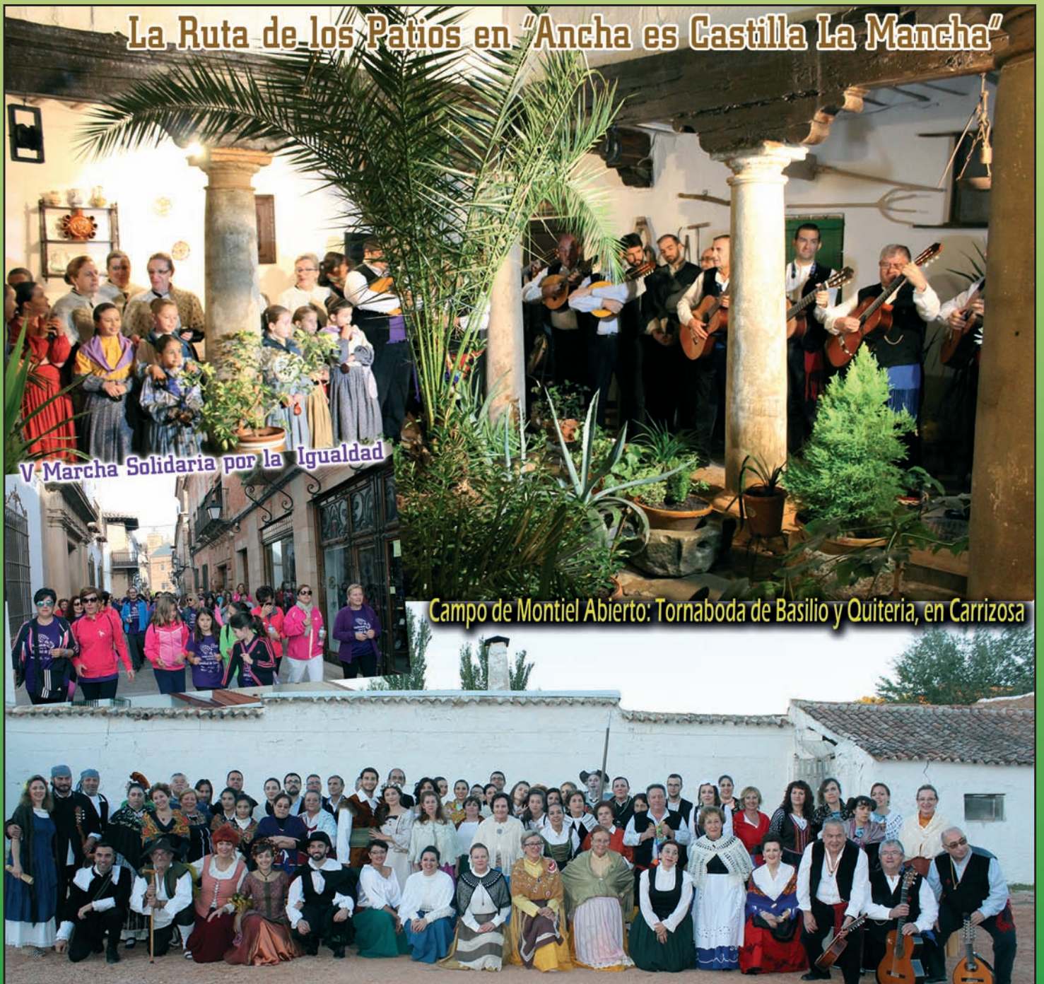
V-Marcha Solidaria por la Igualdad