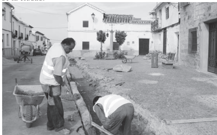
Operarios del Ayuntamiento realizando tareas de acondicionamiento en la "Cruz de la Tercia"

entorno de la Cruz de la Tercia, donde se está elevando el bordillo con el fin de proteger la plaza del acceso de vehículos. Unos trabajos que además de resolver los problemas del tráfico rodado, embellecerán el entorno de una de las Cruces más emblemáticas de la ciudad.