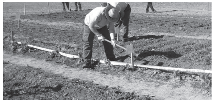
Trabajadores del Ayuntamiento en labores agrícolas

Las personas que cumplan los requisitos, que hayan sido remitidas por la oficina de empleo y que deseen participar en este programa, deben pasarse por las oficinas del Ayuntamiento para poder ser incluidas en el proceso de selección.