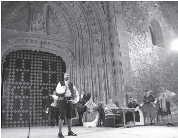
Muestra de folclore y trajes típicos por el Grupo Alcores, en Torrenueva

El programa se inició el viernes 23 de septiembre con distintas actividades en los municipios de Alhambra, Terrinches, Torrenueva y Montiel. El ciclo se ha desarrollado durante cuatro fines de semana, incluyendo también el miércoles 12 d con patrocinio de la Diputación de Ciudad Real y del GDR 'Tierras de Libertad', e octubre, y finalizó el 16 de octubre.