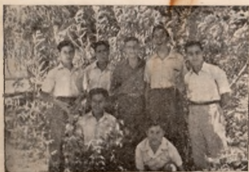
Grupo de los alumnos excursionistas en un maizal de Aranjuez.