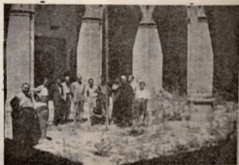
Visita al Instituto Laboral de Trujillo.

La excursión resultó altamente interesante y fructífera, habiendo redactado una Memoria de la misma, todos los alumnos.