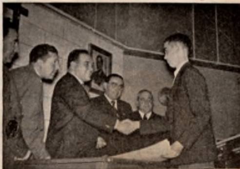
El Gobernador civil y Presidente del Patronato Provincial entregó personalmente los diplomas de Matrícula de Honor. Aquí felicita a uno de los alumnos premiados.

razón de ser de la enseñanza especial a la que está destinado este Centro: que no es actitud demagógica de un Estado que pretende la atracción de los más, mediante promesas de imposible cumplimiento.