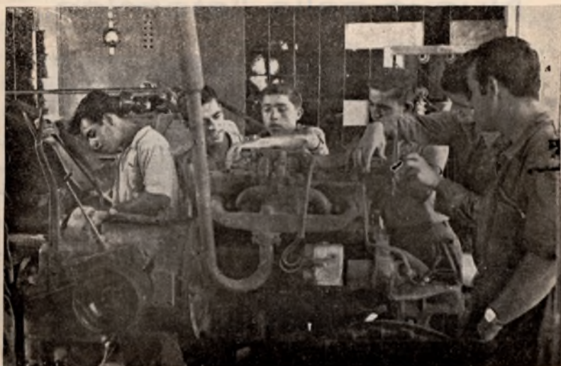
La mecanización agrícola obliga a la reparación de herramientas en el taller anejo.