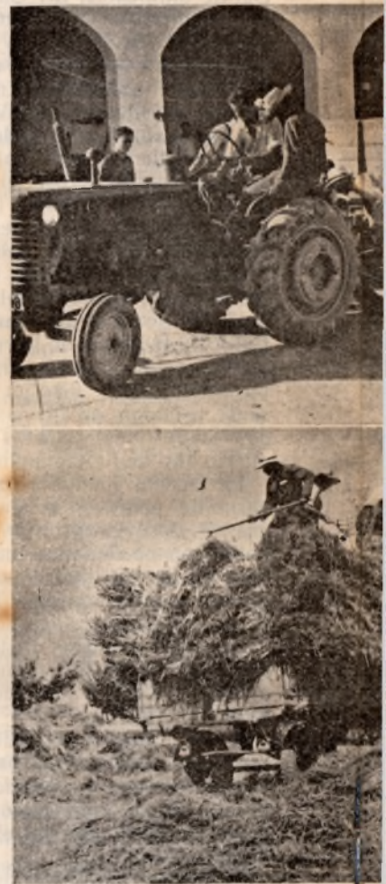
El tractor, con su remolque, sale de la granja y se procede activamente a la siega.

mente terminadas a mediados de julio. Esta residencia, cuyo fin principal es el alojar a los capataces agrícolas que permanecerán dos años siguiendo las respectivas enseñanzas, es capaz para 40 plazas y su distribución es la siguiente: en el piso inferior, a la izquierda del «hall» de entrada, se halla el