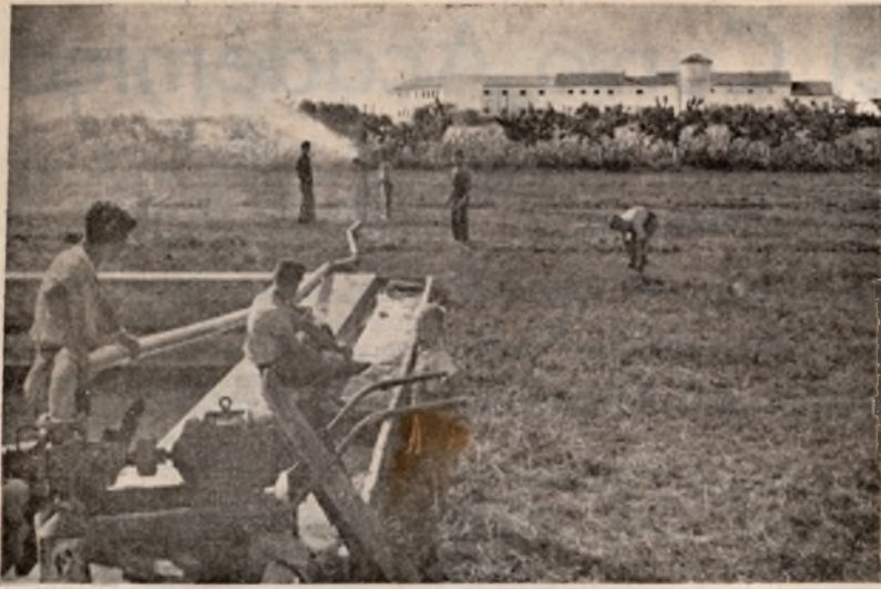
Prácticas de riego por aspersión. El ala izquierda del edificio que se divisa al fondo, es la del internado de la Granja-Escuela.

Se han cumplido los cinco primeros años de la Enseñanza Laboral, que es tanto como decir que han terminado sus estudios de Bachillerato aquellos alumnos que acudieron a las aulas de los primeros Institutos creados en el año 1950. Fueron éstos los de Valle de Carranza, Cangas de Onís, Túy, Medina del Campo, Trujillo, Alcañiz, Alcira, Ecija, Barbastro, Felanitx y Villafranca del Panadés, de modalidad agrícola y ganadera; los de Gándia, Tarazona y Guía de Gran Canaria, de modalidad industrial, y el marítimo-pesquero, emplazado en Santoña.