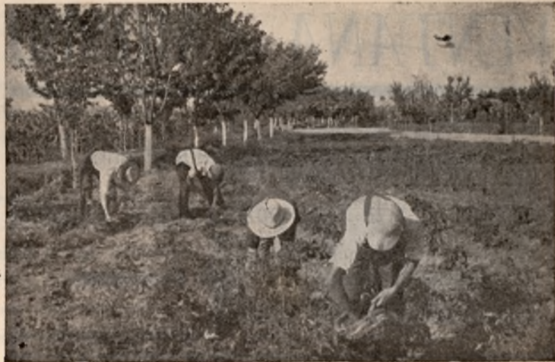
La recogida de hortalizas es trabajo paciente y laborioso, pero alegre y fructífero a la vez.

En todos estos estudios se ha comprobado la teoría explicada o se han deducido consecuencias prácticas, para su aplicación