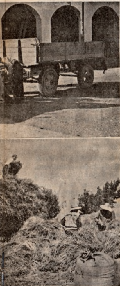
la Granja-Escuela. Después, en la era, ante a descargar la mies.

Durante estos dos meses los alumnos han tenido ocasión de tostarse al fuerte sol durante uno de los veranos más calurosos que hemos «disfrutado» en los últimos años y