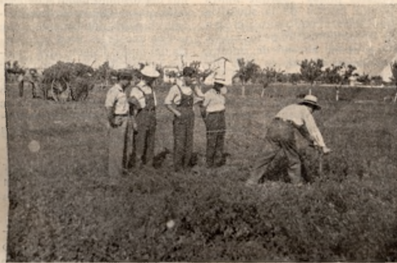
Los nuevos Bachilleres Laborales hacen prácticas de siega de alfalfa con guadaña, siguiendo atentamente las indicaciones del capataz.

Pero estos alumnos que han seguido en los cinco cursos las correspondientes enseñanzas, han tenido que sufrir una dura prueba antes de obtener su título. Durante seis días, en exámenes teóricos y prácticos, han demostrado el grado de su preparación ante un tribunal constituido por miembros de diversos Centros de en-