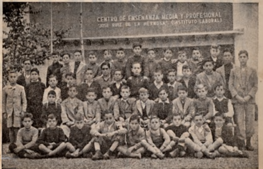
Curso 1954-55.—Alumnos de primer año.

(No se incluyen las notas de «suspense», que después de los exámenes extraordinarios arrojan un total de 38, así como tampoco los nombres de los alumnos repetidores de curso y no presentados.)